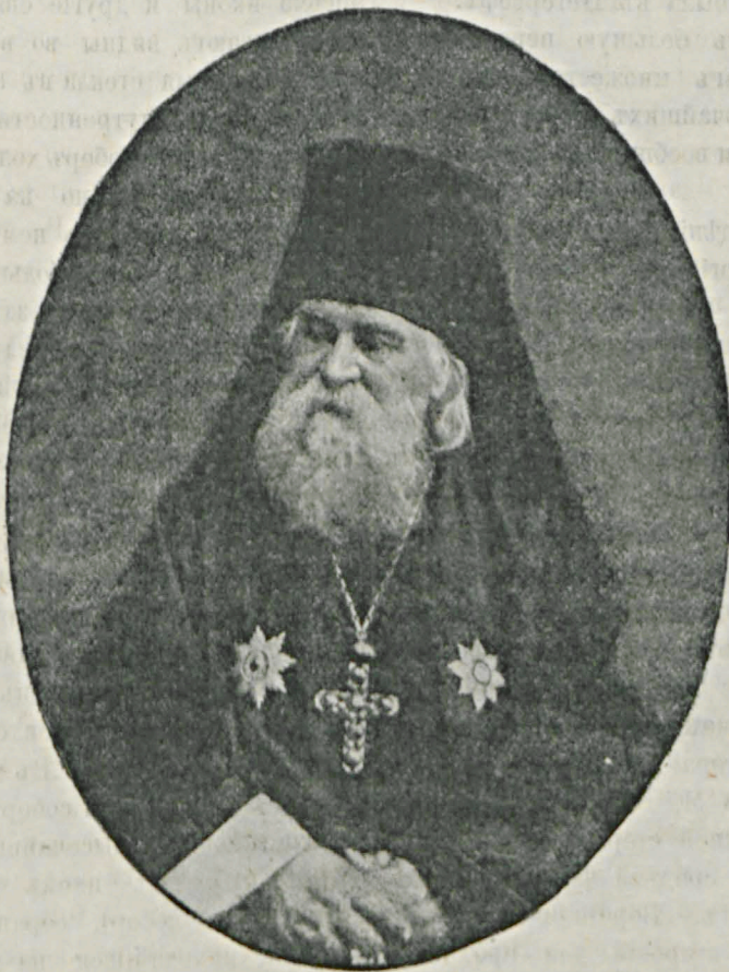
Архимандритъ Игнатій, скончавшійся 16 сего мая.

быть безгрѣшенъ и вполне совершенъ, онъ относился къ согрѣшившему иноку съ отеческимъ участіемъ, увѣщевалъ провинившагося, внушалъ ему исправиться чистосердечнымъ раскаяніемъ. Въ одинъ изъ дней въ 1863 году его запросто посѣтила въ Бозѣ почившая императрица Марія Александровна и при бесѣдѣ навела рѣчь на то, что близъ столицы и при большомъ посѣщеніи монастыря не только богомоль-