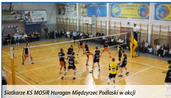
Siatkarze KS MOSiR Huragan Międzyrzec Podlaski w akcji

nia w hali ZPO nr 3, siatkarze Huraganu pokonali Wicher Wilkasy 3:0, a 17 stycznia wygrali po tie-breaku na wyjeździe z Legią Warszawa 3:2. 21 lutego Huragan Międzyrzec pokonał na wyjeździe Centrum Augustów 3:0. 7 marca Huragan Międzyrzec wygrał 3:1 z Centrum Augustów, a 8 marca z tą samą drużyną międzyrzeczanie przegrali 2:3.