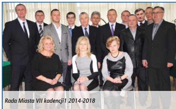
Rada Miasta VII kadencji 1 2014-2018