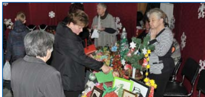
Na stoiskach można było kupić bombki, stroiki i kartki świąteczne