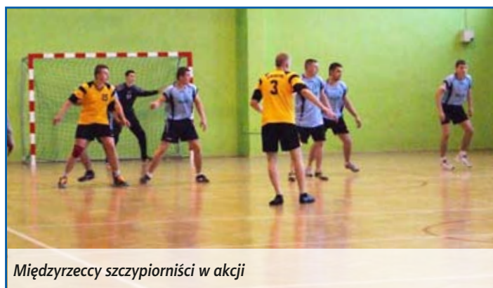
Międzyrzeccy szczypiornicy w akcji

20 stycznia na parkiecie hali w międzyrzeckiego Liceum Ogólnokształcącego odbyły się Mistrzostwa Powiatu w piłce ręcznej chłopców. Do turnieju zgłosiło się pięć drużyn: Liceum Ogólnokształcącego w Międzyrzeczu Podl., Zespołu Szkół Ekonomicznych w Międzyrzeczu Podl., Zespołu Szkół Ponadgimnazjalnych w Międzyrzeczu Podl., reprezentacje Janowa Podlaskiego i Leśnej Podlaskiej. Po wyczerpujących spotkaniach trwających 2 x 10 minut wyłoniono zwycięzcę. Okazała się nim drużyna z Janowa Podlaskiego, która w finale pokonała reprezentację ZSP Międzyrzec Podl. Na trzecim miejscu zawody zakończyła drużyna LO Sikorskiego, która w swoim ostatnim meczu pokonała skład z Leśnej Podlaskiej.