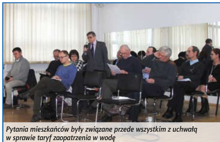
Pytania mieszkańców były związane przede wszystkim z uchwałą w sprawie taryf zaopatrzenia w wodę

siębiorstwo Usług Komunalnych nie wykazało szczegółowo wzrostu kosztów wpływających na proponowaną podwyżkę cen. Rada podjęła także uchwałę w sprawie powołania Zespołu na Rzecz Osób Niepełnosprawnych i Starszych.