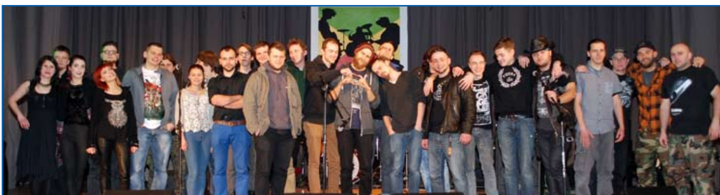
Uczestnicy tegorocznego przeglądu