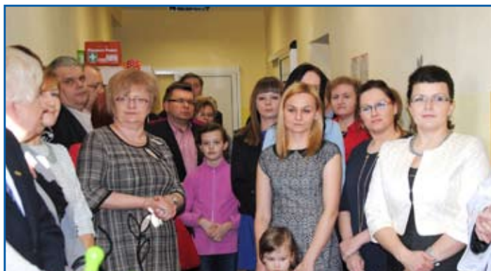
Uroczystość zgromadziła wielu gości