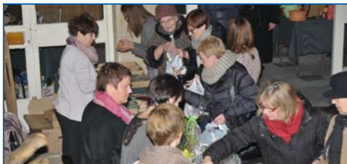
Międzyrzeccanie chętnie kupowali ręcznie wykonane ozdoby świąteczne