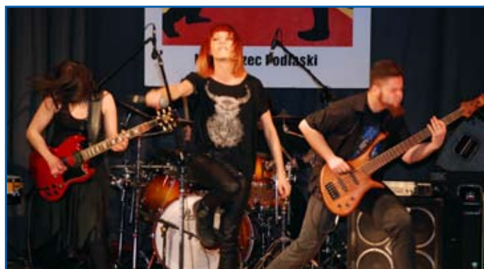
MERKFOLK – zespół, w którym grają międzyrzeczanie