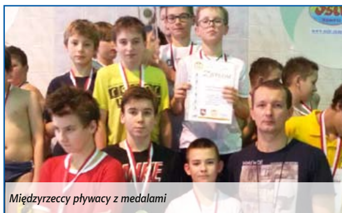
Międzyrzeccy pływacy z medalami