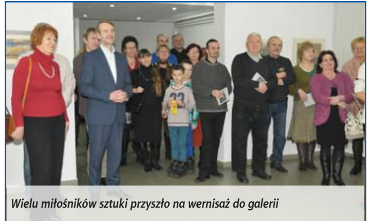
Wielu miłośników sztuki przyszło na wernisaż do galerii