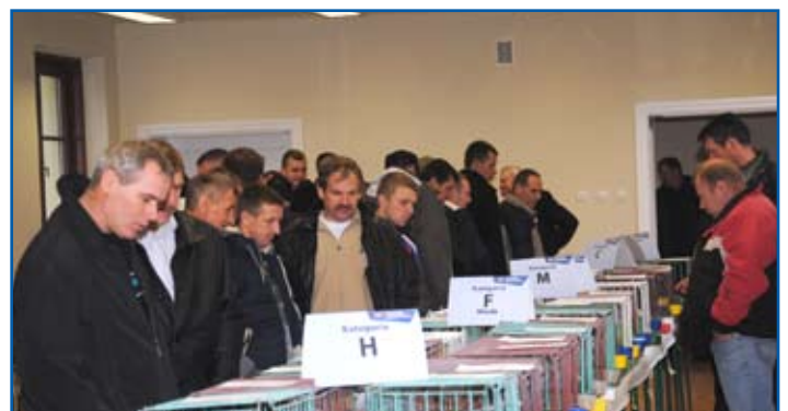
Hodowcy oglądali najlepsze gołębie sezonu