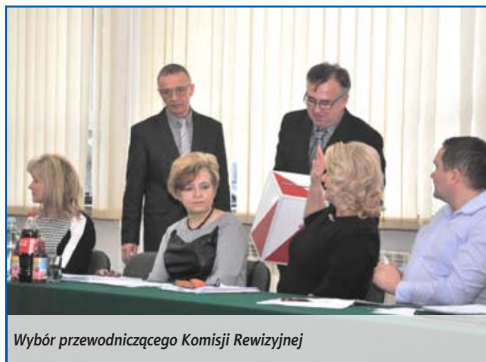
Wybór przewodniczącego Komisji Rewizyjnej