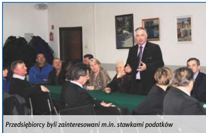
Przedsiębiorcy byli zainteresowani m.in. stawkami podatków