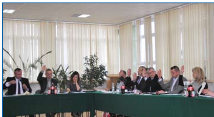
Głosowanie Rady Miasta

sanitarno-szatniowego stadionu MOSiR, a 30 tys. zł na dofinansowanie zakupu samochodu dla Policji.