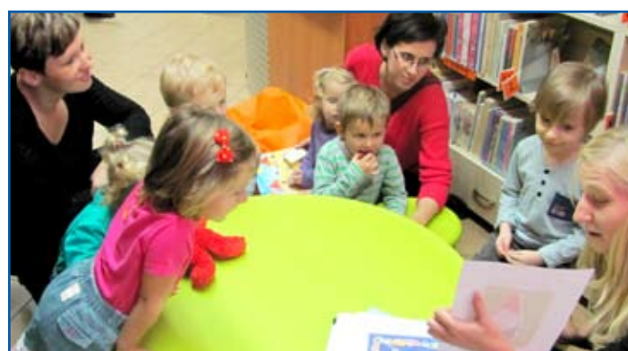
Zajęcia dla dzieci w Miejskiej Bibliotece Publicznej

Miejska Biblioteka Publiczna w Międzyrzeczu Podlaskim od dwóch lat prowadzi cykl zajęć dla najmłodszych i ich opiekunów „Wspólne czytanie sposobem na dobre wychowanie”. Spotkania są bardzo interesujące, rozwijają umiejętności i kreatywność dzieci. Jedno z takich spotkań zostało opisane i zgłoszone do ogólnopolskiego konkursu „Dzieci buszują w bibliotece”, organizowanego przez Fundację Rozwoju Dzieci im. J. A. Komeńskiego. Założeniem konkursu było zaktywizowanie bibliotek, które prowadzą innowacyjne, rozwijające i pomysłowe działania dla najmłodszych dzieci, rodziców i opiekunów do zaprezentowania efektów swoich działań. Zgłoszenie międzyrzeckiej biblioteki zyskało uznanie jury i otrzymała ona wyróżnienie w postaci zestawu książek, audiobooków, pacynek, gier planszowych i zabawek aktywizujących.