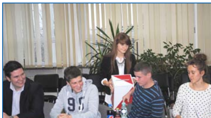
W głosowaniu tajnym, Młodzieżowa Rada Miasta wybrała swojego przewodniczącego