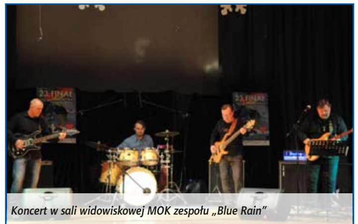
Koncert w sali widowiskowej MOK zespołu „Blue Rain”