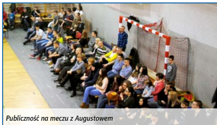
Publicność na meczu z Augustowem