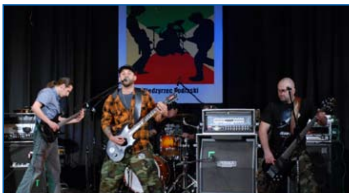
Zwycięzca ROCKwMOK – MADVISION

Przełgąd wygrał zespół MADVISION z Lublina. Grupa otrzymała główną nagrodę 1000 zł. Drugie miejsce zajęła grupa STEEL FIRE z Mińska Mazowieckiego, która dostała 600 zł. Trzecie miejsce zajęli i 300 zł nagrody otrzymał zespół MERKFOLK, który tworzą muzycy z Lublina i Międzyrzecza.