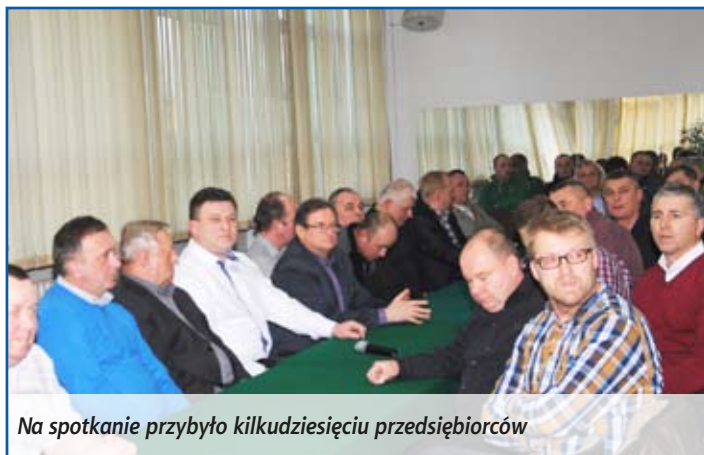
Na spotkanie przybyło kilkudziesięciu przedsiębiorców

wszystkie sprawy w urzędzie będą załatwiane od ręki. Poinformował też o możliwości zorganizowania na terenie miasta bezpłatnych szkoleń na temat pozyskiwania środków unijnych lub innych, np. na temat opodatkowania. Przedsiębiorcy nie narzekali na dotychczasową współpracę z Urzędem Miasta. Niektórzy mieli jednak uwagi do działalności urzędu pracy i organizacji staży. Zdania na ten temat były jednak podzielone. Prowadzący działalność gospodarczą na terenie miasta zainteresowani byli wysokością stawek podatków lokalnych, które jak wyjaśnił burmistrz nie wrosną. Pytali też o plany budowy kolejnych marketów w mieście i możliwości zablokowania takich inwestycji. Pojejmowano także temat szarej strefy i nielegalnego handlu na targowisku, pytano o budowę wschodniej obwodnicy miasta i utworzenie podstrefy ekonomicznej. Padła też propozycja przyjrzenia się uchwale o zwolnieniach firm z podatku, czyli tzw. pomoc de minimis, a także wsparcia inicjatywy „Kupuj lokalnie”. Burmistrz zachęcał przedsiębiorców do udziału w rozwoju międzyrzecznego sportu i wspierania lokalnych klubów. Poinformował także, że chce rozwiązać problemy związane z planem zagospodarowania przestrzennego miasta, aby przedsiębiorcy mogli rozwijać swoje działalności. Zapewnił też, że chce podtrzymać funkcjonowanie Rady Przedsiębiorców Ziemi Międzyrzeckiej.