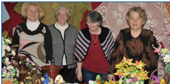
W holu można było podziwiać rękodzieło Międzyrzeckiego Klubu Miłośników Robótek Ręcznych

26 lutego w sali widowiskowej Miejskiego Ośrodka Kultury odbył się Przegląd Twórczości Seniorów „Trochę Wiosny Jesienią”. Rozpoczęła go prezentacja zdjęć wykonanych przez międzyrzeckich seniorów. Na scenie wystąpili: Zespół „Zorza” i kapela „Nas Troje”, zespół Seniorów z Szóstki, chór UTW z Międzyrzecza Podlaskiego, zespół wokalny „Chłopcy z Wrzosa” z Białej Podlaskiej, zespół wokalny „Wrzos” z Radzyna Podlaskiego, teatr „To i Owo” z Białej Podlaskiej, grupa teatralna UTW z Międzyrzecza Podlaskiego i „Zaścianek” z Trzebieszowa. Natomiast w holu kina można było podziwiać efekty twórczości seniorów – rękodzieło i malarstwo. Przegląd Twórczości Seniorów odbył się w Międzyrzecu po raz pierwszy. Został zorganizowany przez międzyrzecki Uniwersytet Trzeciego Wieku i Miejski Ośrodek Kultury.