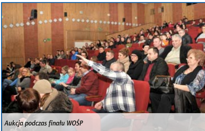
Aukcja podczas finału WOŚP

obrazy i rzeźby oraz wiele innych przedmiotów przekazanych przez darczyńców. Najwyższą cenę osiągnęło złote serduszko Orkiestry – 800 zł. W sumie, z aukcji pozyskano 8935 zł. Po aukcji zagrał zespół „Blue Rain”, a imprezę zakończyło tradycyjne „Świąteczko do nieba”.