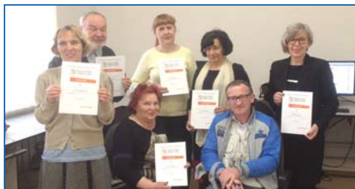
Jedna z grup drugiej edycji bezpłatnych zajęć

Zakończyła się druga edycja bezpłatnych zajęć z podstaw obsługi internetu dla osób 50 plus w ramach programu PCRS, które odbywały się w miejskiej kawiarence internetowej pod kierunkiem trenera kompetencji cyfrowych. W pierwszej i drugiej edycji wzięło udział ponad siedemdziesiąt osób. Większość uczestników nie miała nigdy kontaktu z komputerem i Internetem. Dziś już potrafią posługiwać się myszką i korzystać z klawiatury, przeglądają w internecie strony, korzystają z wyszukiwarki, wysyłają i odbierają wiadomości i korzystają z Facebooka. Podczas zajęć uczestnicy poznali też edytor tekstu, mapy, YouTube, komunikator Skype i obsługę portalu Allegro. Uczyli się przeglądać zdjęcia z płyt i wybrane fotografie przenosić do folderów. W zależności od konkretnych potrzeb, na zajęciach mogli nauczyć się obsługi serwisów internetowych swoich banków, przeglądać faktury za telefon, a także zgrywać zdjęcia z telefonów i wielu innych przy-