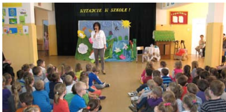
Dzień Otwarty był bogaty w różnorodne atrakcje dla dzieci

Zwieńczeniem przygotowanych niespodzianek było obdarowanie naszych gości słodyczami oraz ołówkami i kolorowymi kredkami, które mają zachęcić dzieci do nauki w szkole. Później grupy wyruszyły na zwiedzanie szkoły i jej pomieszczeń: biblioteki szkolnej, klasopracowni, windy, gabinetu stomatologa, sklepiku szkolnego, gabinetu dyrektora, placu zabaw czy hali gimnastycznej, na której dzieci pokazały swoje niewyczerpane zasoby energii.