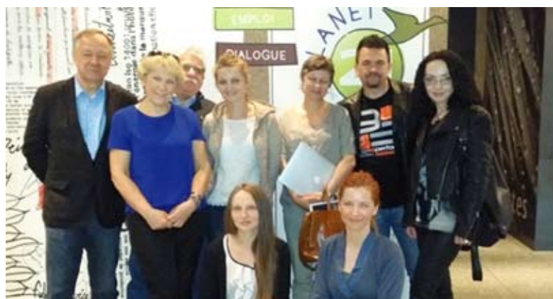
Kolejny gość specjalny aktor Stellan Skarsgard znany z takich filmów jak m.in. „Buntownik z wyboru”, „Piraci z Karaibów”, „Avengers”