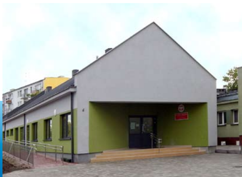
Foto: Pierwszy historyczny żłobek w Międzyrzecu Podlaskim

Zakończenie budowy nastąpiło w grudniu 2014 roku. Żłobek w Międzyrzecu cieszy się popularnością. Obecnie znajdują się w nim 22 dzieci podzielone na dwie grupy. Pierwsza grupa mieści ośmiu dzieci w wieku pół roku do półtora roku druga czternaścioro od 2 r. ż do 3 r. ż. Rodzice cały czas składają wnioski o przyjęcie i już od września na pewno będzie komplet dzieci w pierwszym międzyrzeckim żłobku.