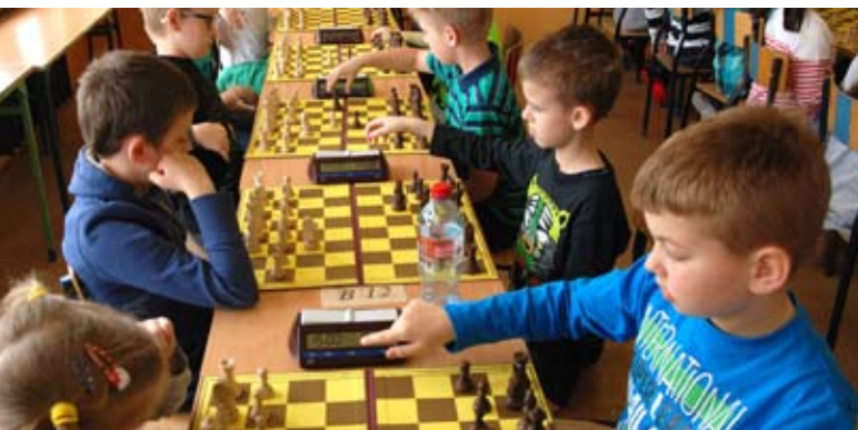
Młodzi mieli szansę wykazać się swoimi umiejętnościami

Zwycięzcy poszczególnych klasyfikacji zostali wyróżnieni pucharami, dyplomami oraz nagrodami finansowymi i rzeczowymi. Wszyscy uczestnicy turnieju do lat 10 otrzymali pamiątkowe dyplomy i upominki.