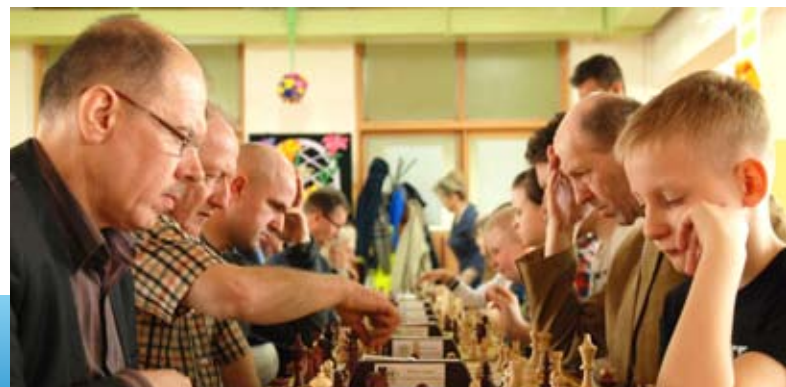
Do rywalizacji przystąpiły także osoby z różnych pokoleń, co dodawało charakteru całej imprezie