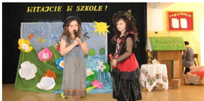
Przedstawienie pt. „Calineczka” przygotowane przez uczniów klasy 2b pod kierunkiem p. Grażyny Podgajnej