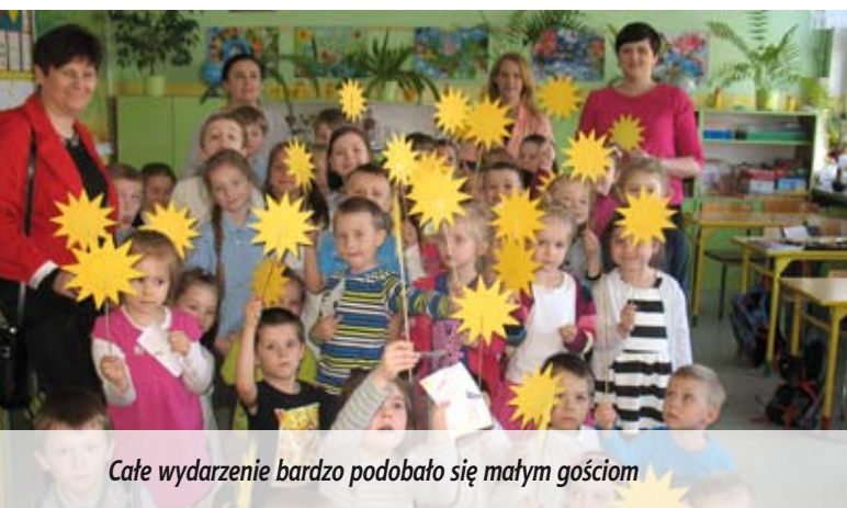
Całe wydarzenie bardzo podobało się małym gościom