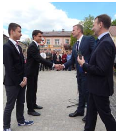
Kadeci z UKS Międzyrzecka Trójka za świetne wyniki otrzymali „Międzyrzecki Wawrzyn”