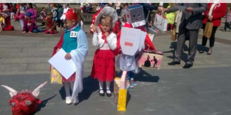
Przedszkolaki zaskoczyły publiczność i jury oryginalnymi charakteryzacjami