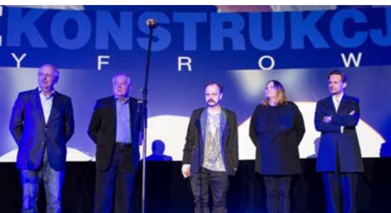
Wydarzenie zjechało wielu znanych aktorów m.in. Arkadiusza Jakubika, Andrzeja Zaborskiego, Iwonę Bielską, Bartłomieja Topę, Mariana Dziędziela

Festiwal był możliwością zetknięcia się z ludźmi związanymi z filmem, jego produkcją i dystrybucją. Spotkania i rozmowy animatorów kin poruszały kwestie związane z przyszłością projektu Kino za Rogiem. Wszystko po to, aby poszerzyć i uatrakcyjnić ofertę kina. Przyszłość zapowiada się interesująco.