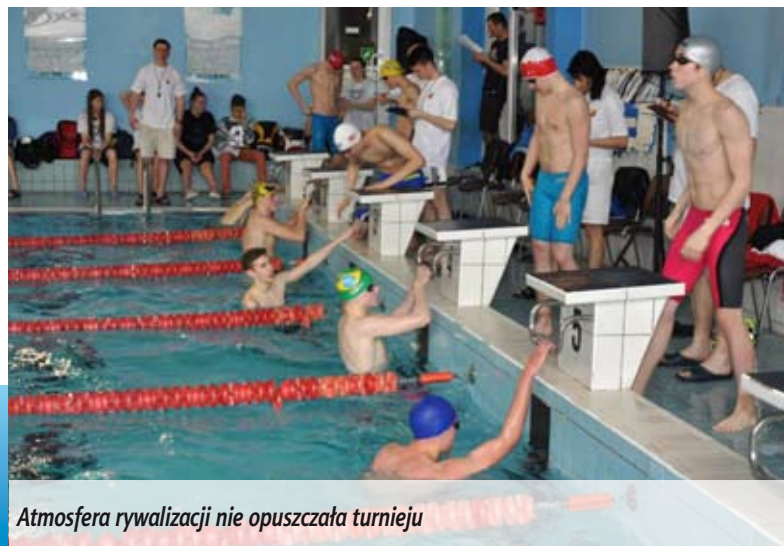
Atmosfera rywalizacji nie opuszczała turnieju

W klasyfikacji drużynowej ekipa międzyrzecka zajęła 6 miejsce.