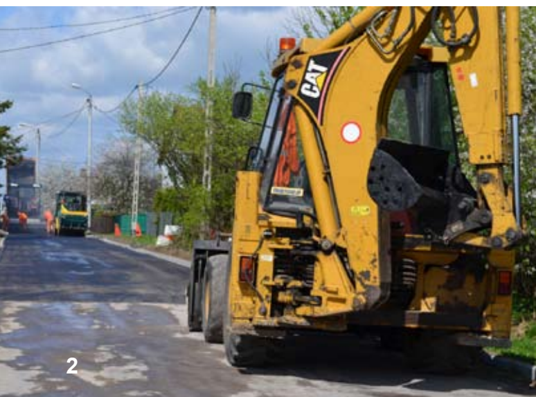
Foto: Roboty budowlane na ul. Zachodniej.

Następna inwestycja będzie realizowana na ul. Staromiejskiej. Zmieniona będzie nawierzchnia chodnika na kostkę brukową. Kolejna przebudowa nastąpi na ulicy Parkowej. Następnie zostanie wykonana zatoka parkingowa przed blokiem przy ul. Partyzantów 10H z 23 miejscami parkingowymi. Kolejna przebudowa nastąpi na ul. Ceglanej na odcinku 460 m będzie wykonana nawierzchnia asfaltowa, krawężniki, przykanaliki z wypustami ściekowymi kanalizacji deszczowej. Dokończona zostanie przebudowa ul. Piramowicza. Kolejne przebudowy będą opisywane na bieżąco.