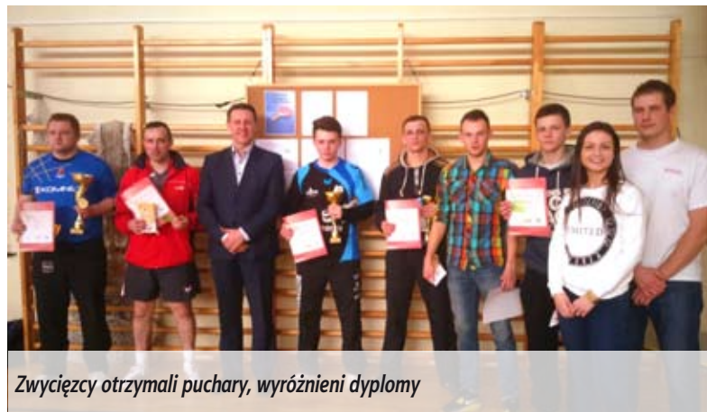
Zwycięzcy otrzymali puchary, wyróżnieni dyplomami