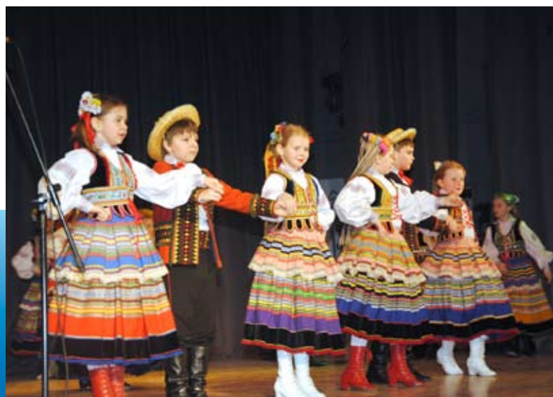
Dzieci pięknie zaprezentowały tańce i stroje ludowe przy akompaniamencie kapeli