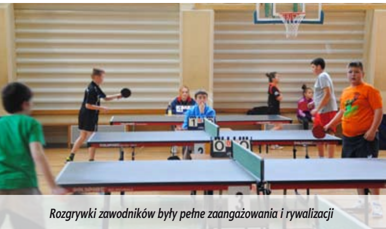
Rozgrywki zawodników były pełne zaangażowania i rywalizacji

W turnieju reprezentowane były takie miejscowości jak: Lublin, Lubartów, Bełżyce, Włodawa, Siedlce, Parczew, Łosice, Biała Podlaska i Międzyrzec Podlaski.