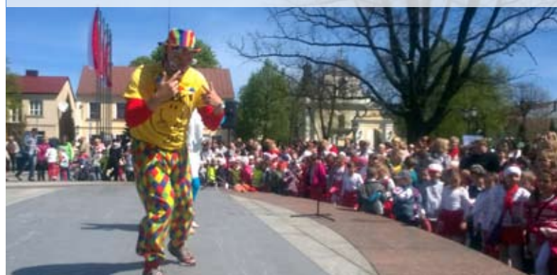
Klaun rozbawił i wciągnął w imprezę całą publiczność