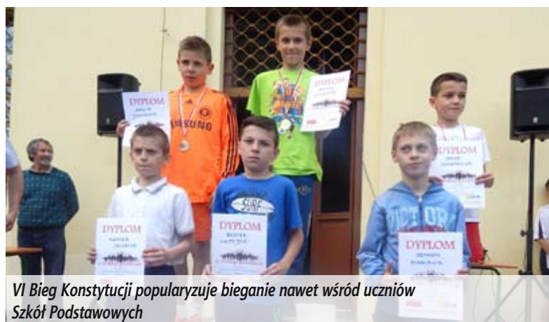
VI Bieg Konstytucji popularyzuje bieganie nawet wśród uczniów Szkół Podstawowych