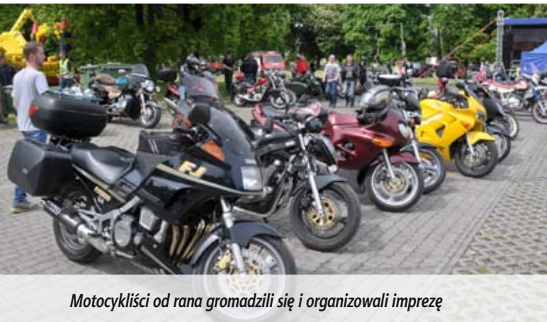
Motocykliści od rana gromadzili się i organizowali imprezę