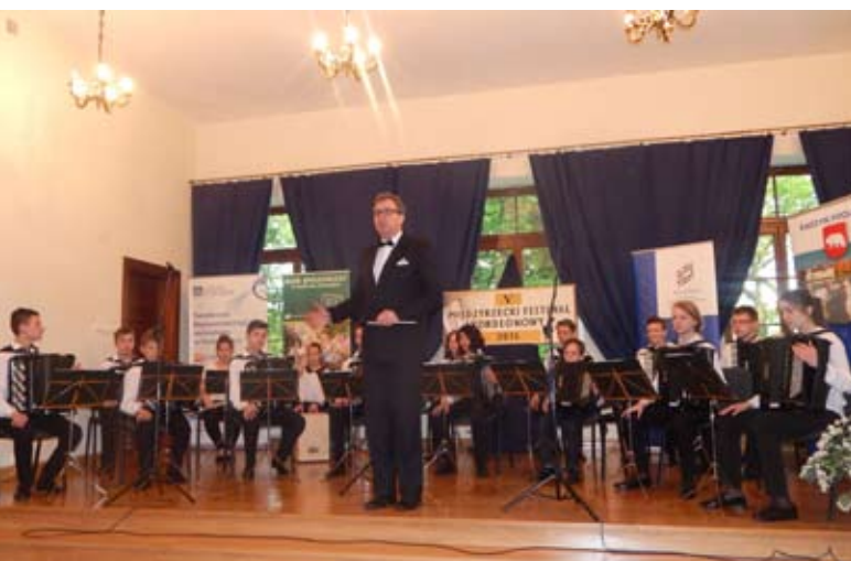
Orkiestra Akordeonowa Arti Sentemo z Radzyna Podlaskiego