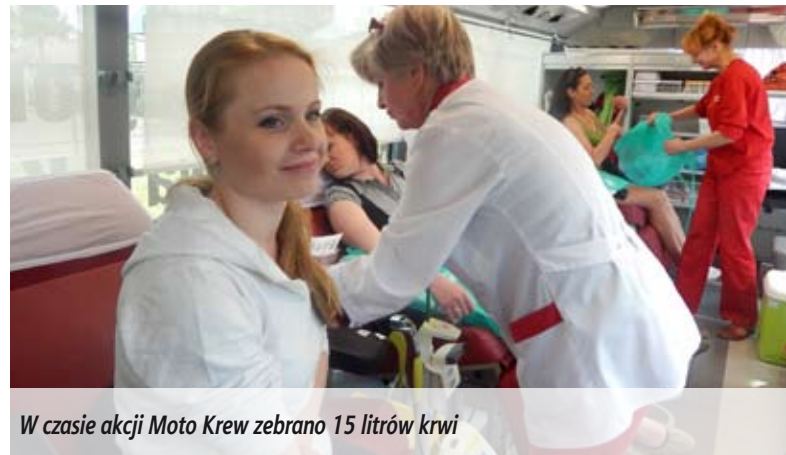
W czasie akcji Moto Krew zebrano 15 litrów krwi