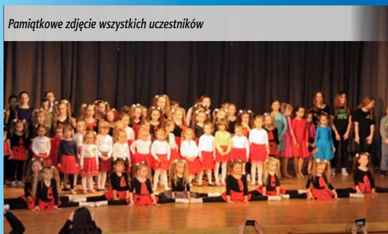
Pamiątkowe zdjęcie wszystkich uczestników