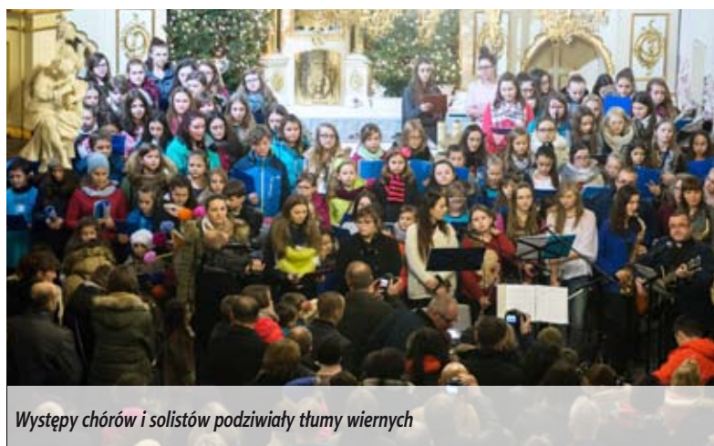
Występy chórów i solistów podziwiali tłumy wiernych