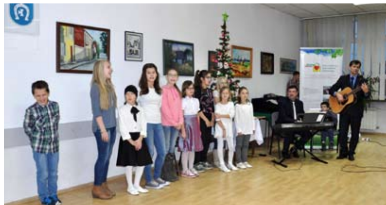
Podopieczni świetlicy zaśpiewali najpiękniejsze kolędy