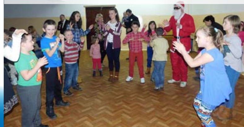
Dzieci najbardziej ucieszyły się z wizyty Mikołaja

Aż 150 paczek otrzymali podopieczni organizacji „Podaj dziecku pomocną dłoń” podczas zabawy choinkowej, która odbyła się 29 stycznia w świetlicy Zespołu Szkół Ponadgimnazjalnych w Międzyrzeczu Podlaskim. Dzieciaki świetnie bawiły się przy muzyce ze swoimi rówieśnikami i zjadały słodkości. Po długim oczekiwaniu pojawił się Mikołaj. Dzieci przyjęły go z radością i zaprosiły do zabawy. Wyjątkowy gość obdarował je paczkami pełnymi słodyczy. Wszystko dzięki wsparciu sponsorów, za które organizatorzy serdecznie dziękują.