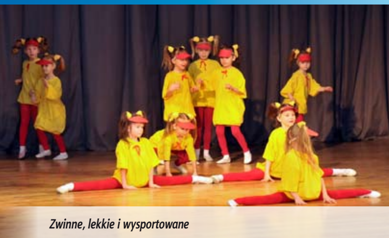
Zwinne, lekkie i wysportowane