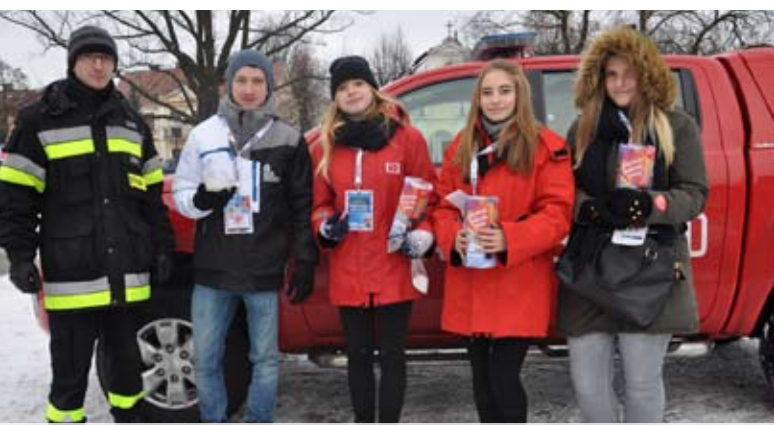
Wolontariuszy nie był w stanie zniechęcić duży mróz