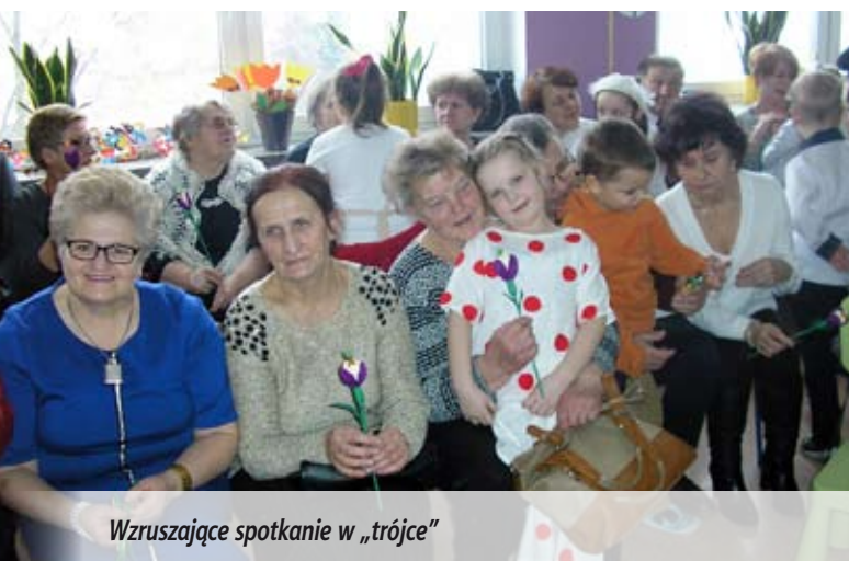
Wzruszające spotkanie w „trójce”