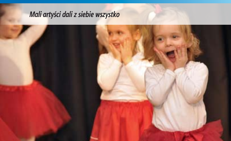
Mali artyści dali z siebie wszystko