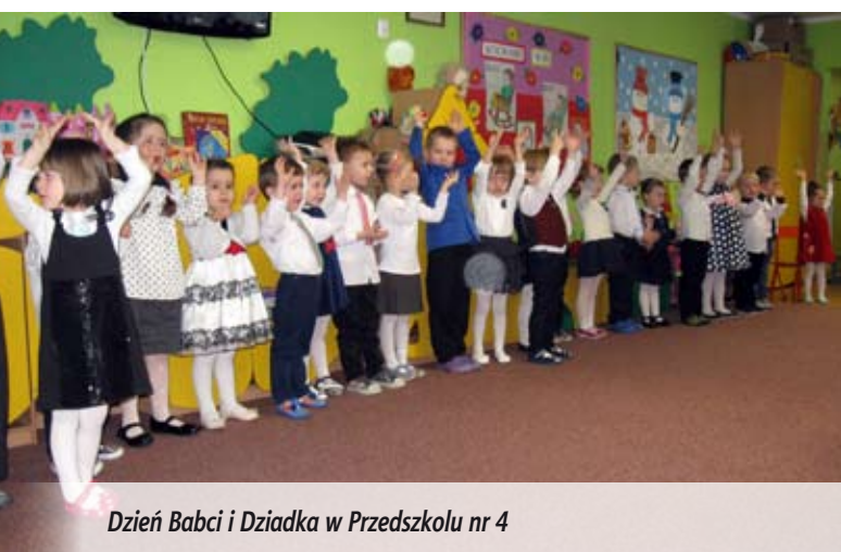
Dzień Babci i Dziadka w Przedszkolu nr 4