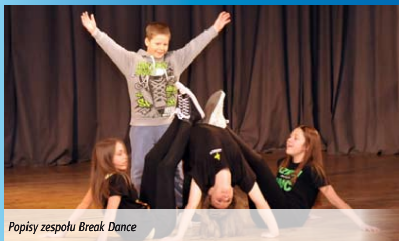
Popisy zespołu Break Dance