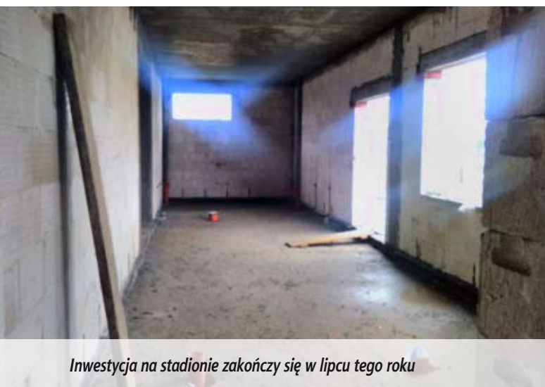
Inwestycja na stadionie zakończy się w lipcu tego roku

W ramach resortowego programu opieki nad dziećmi w wieku do lat 3 „Maluch 2015” prowadzonego przez Ministerstwo Pracy i Polityki Społecznej Międzyrzec Podlaski w 2015 roku otrzymał ponad 78 tys. zł dofinansowania na funkcjonowanie Żłobka Miejskiego.