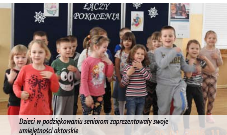
Dzieci w podziękowaniu seniorom zaprezentowały swoje umiejętności aktorskie

W środę 20 stycznia w Zespole Placówek Oświatowych nr 2 odbyło się spotkanie uczniów klas 0-III ze słuchaczami Uniwersytetu Trzeciego Wieku. Zapoczątkowało ono współpracę biblioteki szkolnej z seniorami pod hasłem „Czytanie łączy pokolenia”. Goście zaprezentowali wiersze Juliana Tuwima i Jana Brzechwy oraz wspólnie z dziećmi bawili się śpiewając piosenki. Uczniowie w podziękowaniu za ciekawe spotkanie i poświęcony czas zaprezentowali swoje umiejętności aktorskie i obdarowali przybyłych własnoręcznie wykonanymi podarunkami. Z okazji zbliżającego się Dnia Babci i Dziadka złożyli seniorom najserdeczniejsze życzenia oraz umówili się na kolejne spotkania.