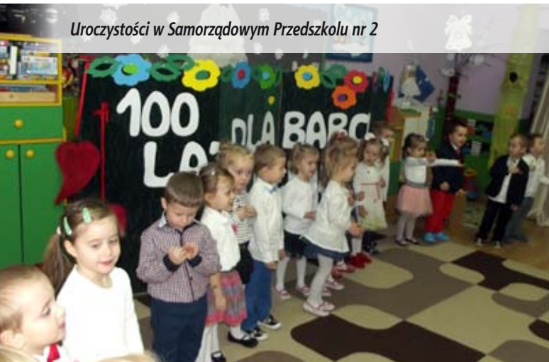
Uroczystości w Samorządowym Przedszkolu nr 2

Dzieci z międzyrzeckich przedszkoli wspaniale podziękowały swoim dziadkom za wielkie serca. Z okazji ich święta zaprezentowały programy artystyczne. Przedszkolaki śpiewały piosenki, tańczyły i recytowały wiersze. Dziękujemy babciom i dziadkom za to, że są i zawsze mają czas dla swoich wnuków!