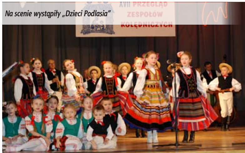
Na scenie wystąpiły „Dzieci Podlasia”

Podczas XVII Przeglądu Zespołu Kolędniczych, który odbył się 17 stycznia sala widowiskowa Miejskiego Ośrodka Kultury wypełniona była po brzegi. Widzowie wysłuchali najpiękniejszych polskich kołęd w wykonaniu miejscowych chórów, solistów i instrumentalistów. Artyści zaprezentowali utwory te dawne i współczesne w przeróżnych interpretacjach. Poza tradycyjnymi można było usłyszeć wersję rockowe kołęd. W tegorocznym przeglądzie wystąpili: Orkiestra parafii pw. św. Mikołaja, Zespół Pieśni i Tańca Ludowego „Dzieci Podlasia”, Chór parafii pw. św. Mikołaja, Chór Kameralny „Veritatis” z parafii pw. św. Mikołaja, Schola dziecięco-młodzieżowa z parafii pw. Mikołaja, Chór „Oremus” parafii pw. św. Józefa, Schola parafii pw. Chrystusa Króla, Zespół Wokalny „Radość” z Uniwersytetu Trzeciego Wieku i Chór „Wiarus” Miejskiego Ośrodka Kultury.