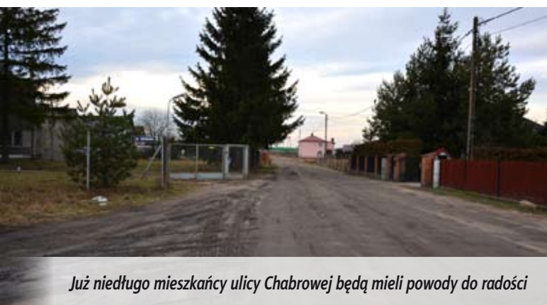
Już niedługo mieszkańcy ulicy Chabrowej będą mieli powody do radości

Budżet na 2016 rok radni uchwalili pod koniec grudnia zeszłego roku. Dochody zaplanowano na poziomie 51,7 mln zł zaś wydatki wyniosą 51,5 mln zł. Prawie 3 mln zł będą kosztowały inwestycje. Za te pieniądze wybudowane zostaną ulice: Brzozowa i Chabrowa, przebudowana będzie też ulica Niewęglowskiego. 10 tys. zł. to koszt opracowania planu budowlanego ścieżki rowerowej przy ul. Brzeskiej, w tym roku powstanie również projekt budowlany ul. Modrzewiowej. Kontynuowana będzie również budowa kanalizacji deszczowej w ul. Adamki, na kolejny etap zarezerwowano 200 tys. zł. Budowa systemu monitoringu w mieście to koszt 20 tys. zł, są też pieniądze na opracowanie projektu budowlanego oświetlenia w ul. Krysińskiego.