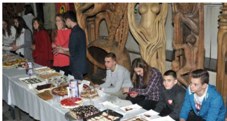
Dochód z kiermaszu ciast także trafił na konto WOŚP

32 calowy telewizor wylicytowano za 760 zł