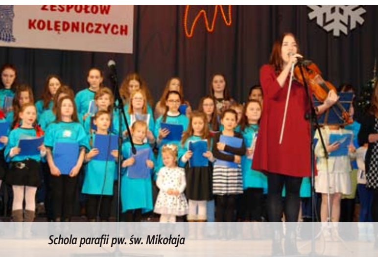
Schola parafii pw. św. Mikołaja