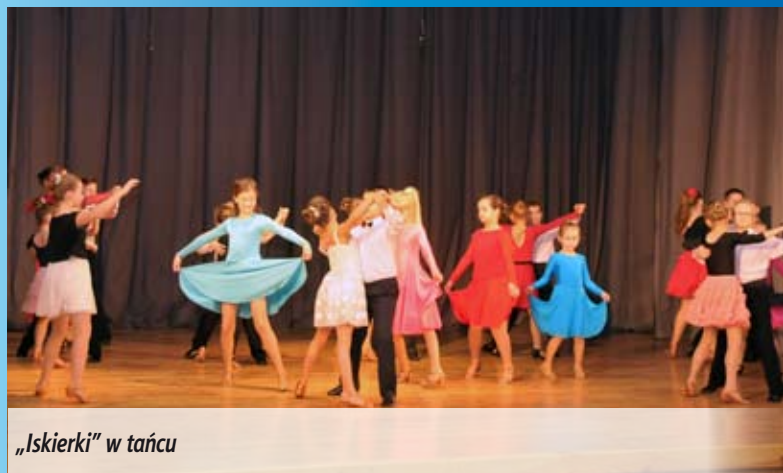
„Iskierki” w tańcu