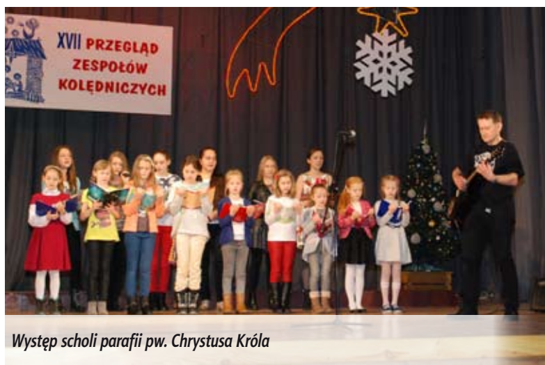
Występ scholi parafii pw. Chrystusa Króla