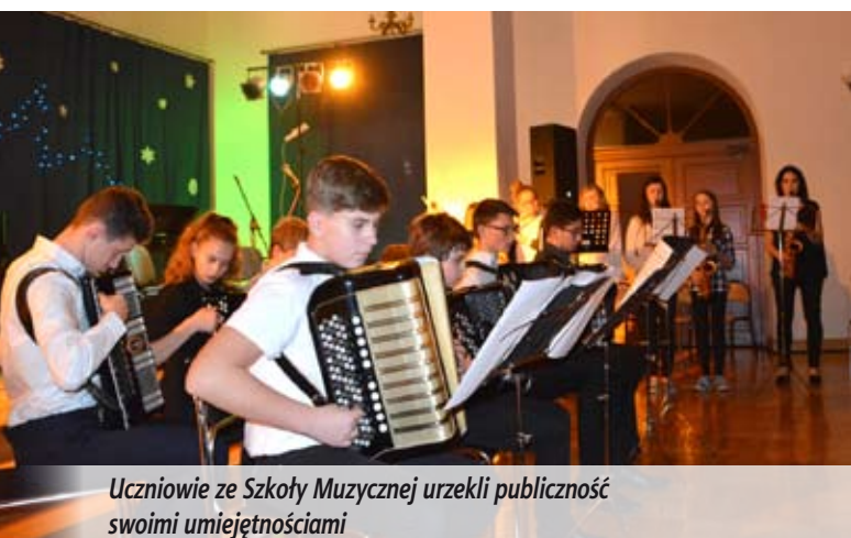
Uczniowie ze Szkoły Muzycznej urzekli publiczność swoimi umiejętnościami