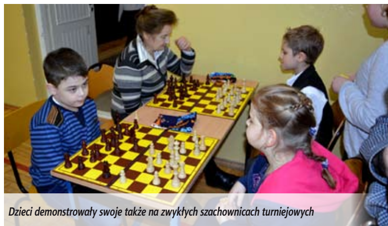
Dzieci demonstrowały swoje także na zwykłych szachownicach turniejowych

W obu placówkach przygotowano ciekawe programy artystyczne. Uczniowie przy pomocy dużych szachów plenerowych zaprezentowali także bajkę szachową pt. „Żelazna klatka Tamerlana”. Były życzenia, słodki poczęstunek, a także wspólna gra. Wielkoformatowe gry planszowe pozwoliły na połączenie ruchu z wysiłkiem umysłowym przy grach logicznych. Spotkania odbyło się dzięki dotacji, którą „Gambit” pozyskał z Fundacji Banku Zachodniego WBK im. Stefana Bryły na realizację projektu, w ramach drugiej edycji konkursu „Tu mieszkam, Tu zmieniam”. Głównym założeniem projektu, jest zachęcenie juniorów i seniorów do wspólnego spędzania wolnego czasu przy szachownicach i innych grach planszowych, a także wymiana doświadczeń między pokoleniami.