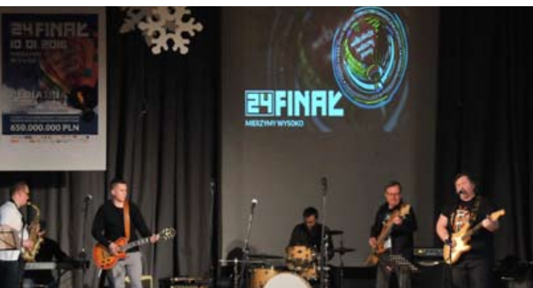
Na początek zagrał zespół Blue Rain