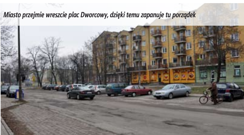
Miasto przejmie wreszcie plac Dworcowy, dzięki temu zapanuje tu porządek

Za kilka miesięcy sfinalizują się formalności związane z przejęciem placu Dworcowego od PKP. Mieszkańcy od lat uskarżają się na brak oświetlenia i bałagan w obrębie tej ulicy. Gdy miasto wykupi teren i stanie się jego właścicielem, będzie mogło bez przeszkód tu inwestować i dbać o porządek. Tymczasem, w porozumieniu z międzyrzeczą Spółdzielnią Mieszkaniową zdecydowano o montażu dodatkowych lamp na pobliskich blokach, by choć trochę zrekompensować mieszkańcom i pasażerom brak oświetlenia przy tej ulicy.