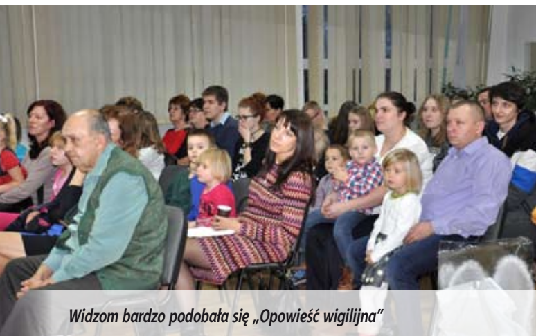
Widzom bardzo podobała się „Opowieść wigilijna”

W tym roku dzięki życzliwości ludzi, paczki otrzymało 370 dzieci z miasta i gminy Międzyrzec Podlaski. Wcześniej, na choinkach w trzech parafiach zawisły bombki z opisem konkretnych potrzeb danego dziecka. Prezenty sprawiły dzieciom mnóstwo radości. – Najwięcej, bo 200 bombek rozprowadziła parafia