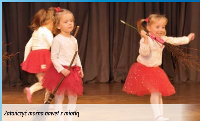
Zatańczyć można nawet z miotłą