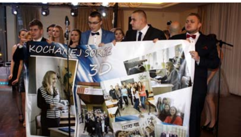
Studniówka młodzieży z Liceum Ogólnokształcącego

Zakończyły się studniówki w Międzyrzecu Podlaskim. Przez trzy weekendy stycznia Hotel Chrobry, gdzie odbywały się imprezy należał do przyszłych maturzystów. Uczniowie Liceum Ogólnokształcącego, Zespołu Szkół Ekonomicznych i Zespołu Szkół Ponadgimnazjalnych wspaniale bawili się podczas tego najważniejszego balu w życiu. Uroczystość rozpoczął tradycyjny polonez, potem były przemówienia gości oraz podziękowania wychowawcom za lata nauki. Uczniowie przygotowali też prze zabawne programy artystyczne, kapitalnie odgrywając role swoich wychowawców. Taneczne szaleństwo z gronem pedagogicznym trwało do białego rana.