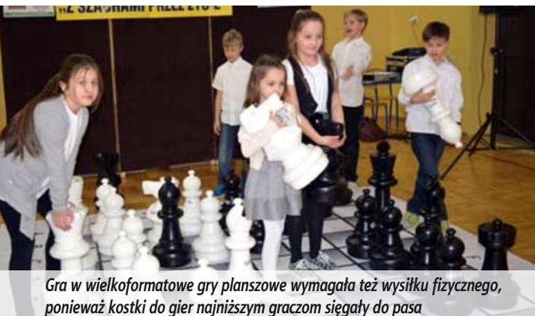
Gra w wielkoformatowe gry planszowe wymagała też wysiłku fizycznego, ponieważ kostki do gier najniższym graczom sięgały do pasa

W obydwu uroczystościach wzięło udział blisko 300 osób: dzieci, ich rodziców oraz dziadków. Organizatorzy przybliżyli juniorom czasy dzieciństwa babć i dziadków, gdy gry planszowe cieszyły się dużo większym powodzeniem, szczególnie w długie zimowe wieczory.