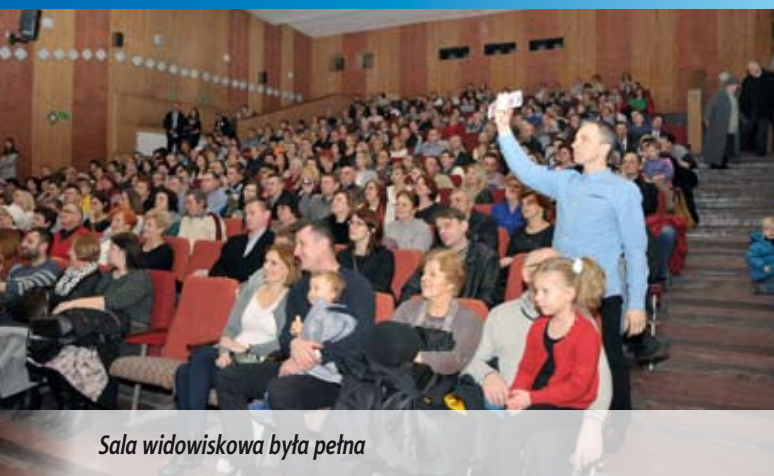
Sala widowiskowa była pełna