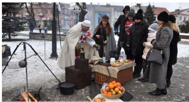
Templariusze z Międzyrzecza częstowali kawą po saraceńsku i wieprzowiną na miodzie