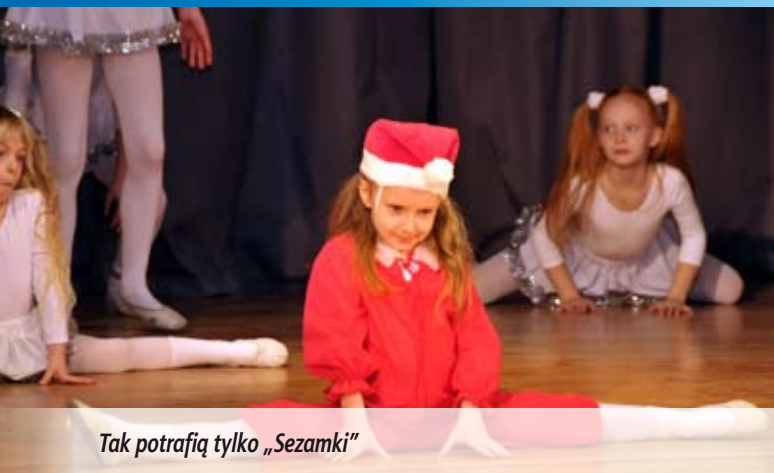
Tak potrafią tylko „Sezamki”

Burzą oklasków nagrodzono występy najmłodszych z okazji Dnia Babcia i Dziadka, które odbyły się 31 stycznia w sali widowiskowej Miejskiego Ośrodka Kultury. Na widowni zasiedli nie tylko dziadkowie i babcie, ale także rodzice małych artystów. Na scenie wystąpiły grupy: „Pozytywka”, „Sezamki”, zespół Break Dance i tancerze z Klubu Tańca Towarzyskiego „Iskra”. Wszyscy zaprezentowali się wspaniale.