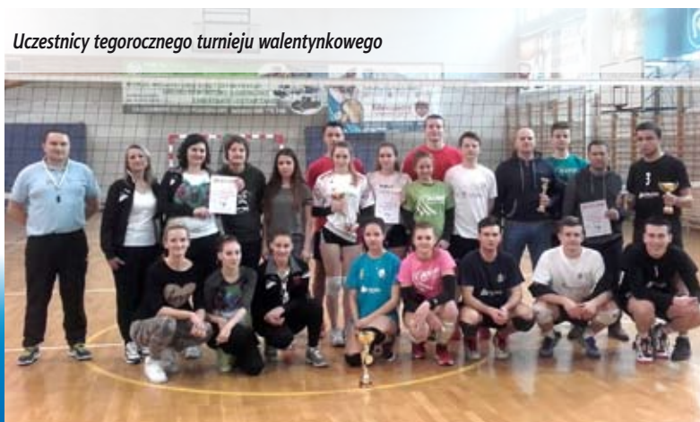
Uczestnicy tegorocznego turnieju walentynkowego