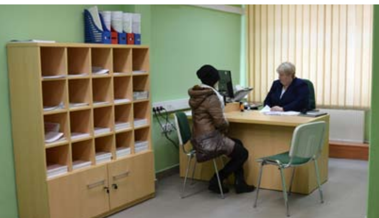
W nowej siedzibie załatwianie spraw jest o wiele przyjemniejsze

W punkcie można składać dokumenty i uzyskać porady w indywidualnych sprawach emerytalnych i ubezpieczeniowych. Na miejscu i od ręki można też otrzymać różne zaświadczenia, np. o wysokości emerytury, wysokości składek odprowadzanych przez pracodawcę lub zaświadczenie o niezaleganiu ze składkami.