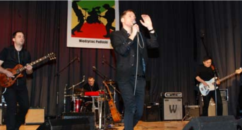
Spring Rolls – zdobywcy I miejsca

wali do przeglądu 6 kapel. Ostatecznie w konkursie wzięły udział cztery. Zgodnie z przyjętą przed laty formułą, to uczestnicy wybrali zwycięzców spośród siebie. Pierwsze miejsce i nagrodę w wysokości 1000 zł otrzymał zespół Spring Rolls z Kraśnika, drugą lokatę i 600 zł zdobyła formacja The Riddle z Krakowa, na trzecim miejscu uplasowała się kapela Hard Gock z Kobylan wygrywając 400 zł. Nagrodę pocieszenia – 300 zł dostał zespół Folya z Kielc. Gwiazdą wieczoru był koncert międzyrzecko-lubelskiego zespołu Merkfolk.