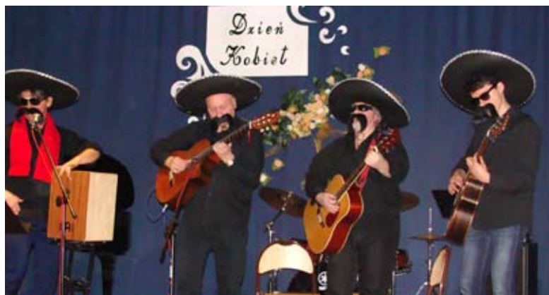
Meksykańskie klimaty rozruszały publiczność

Koncerty w Szkole Muzycznej cieszą się ogromnym powodzeniem. 10 marca uczniowie i nauczyciele przygotowali niespodziankę z okazji Dnia Kobiet. Tym razem występowali tylko mężczyźni wykonując zróżnicowany repertuar: solowy i zespołowy, instrumentalny i wokально-instrumentalny. Przeważała muzyka rozrywkowa. Gromkimi brawami nagrodzono gości „prosto z Meksyku”, którzy wykonali piosenkę z filmu „Desperado”. Żadna z pań nie wyszła z pustymi rękami, każda otrzymała symboliczny kwiat.