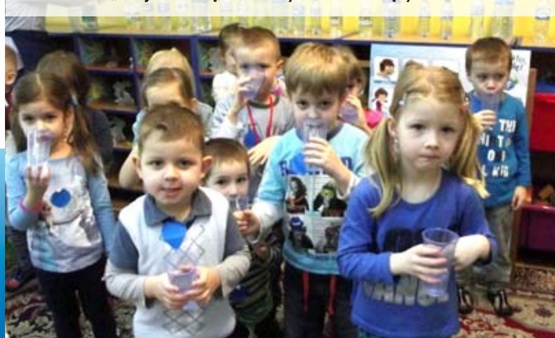
Przedszkolaki z „dwójki” wiedzą, co robić by mieć zdrowe zęby

Samorządowe Przedszkole nr 2 wzięło udział w ogólnopolskim programie „Dzieciństwo bez próchnicy”, który polega na edukacji i profilaktyce w kierunku zdrowia jamy ustnej. Kampania skierowana jest nie tylko do maluchów, ale ich rodziców i opiekunów. Wzięli oni udział w spotkaniu i prelekcji multimedialnej, podczas której przybliżony im został problem próchnicy u małych dzieci. W każdej grupie odbyły się spotkania ze stomatologiem, który wytłumaczył przedszkolakom, czym jest próchnica i jak można jej zapobiec. Każde dziecko otrzymało broszurkę z ilustracjami oraz pastę i szczotkę w etui. Przedszkole uczestniczy także w programie edukacyjnym „Mamo, tato wolę wodę”. Jego celem jest podkreślenie roli wody w codziennej diecie oraz wspieranie rodziców w kształtowaniu prawidłowych nawyków żywieniowych u dzieci.