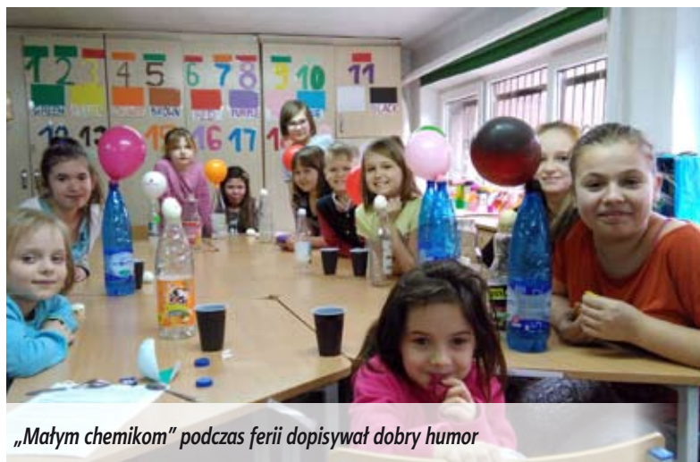
„Małym chemikom” podczas ferii dopisywał dobry humor

W czasie ferii zimowych Świetlica Środowiskowa „Strefa Serca” była bardzo aktywna. Tematem wiodącym zajęć były kontynenty świata. Dzieci poznawały je podczas zabawy, zajęć plastycznych i prezentacji multimedialnych, a także z tematycznych czytanek. Najwięcej entuzjazmu wywołały domowe eksperymenty. Przeprowadzane w bezpieczny i ciekawy sposób zachęciły wychowanków do pogłębiania wiedzy, a przede wszystkim stanowiły wspaniałą zabawę i pracę w grupie. Uczestnicy zajęć regularnie chodzili na basen, lodowisko oraz na spacer do parku.