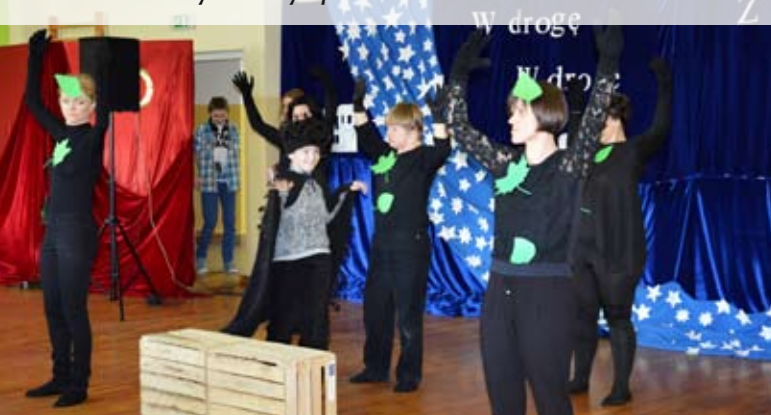
Iskierki w symbolicznym przedstawieniu