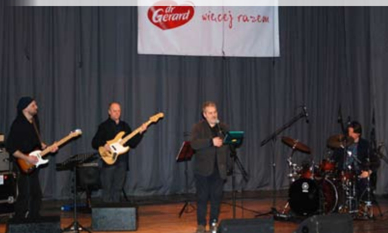
Artyście towarzyszyli bialscy muzycy

wplótł nawet Międzyrzec Podlaski, czym zdobył sympatię publiczności. Skolias jest muzykiem poszukującym nie tylko indywidualnej formuły na zastosowanie głosu ludzkiego w muzyce, ale również inspiracji w bluesie, jazzie, rocku oraz w muzyce etnicznej. Studiuje starodawne techniki wokalne. Jako jeden z niewielu na świecie wokalistów opanował technikę śpiewania harmonicznego, czyli równoległego prowadzenia trzech głosów, nazywanego także gardłowym. Sponsorem koncertu była firma dr Gerard.