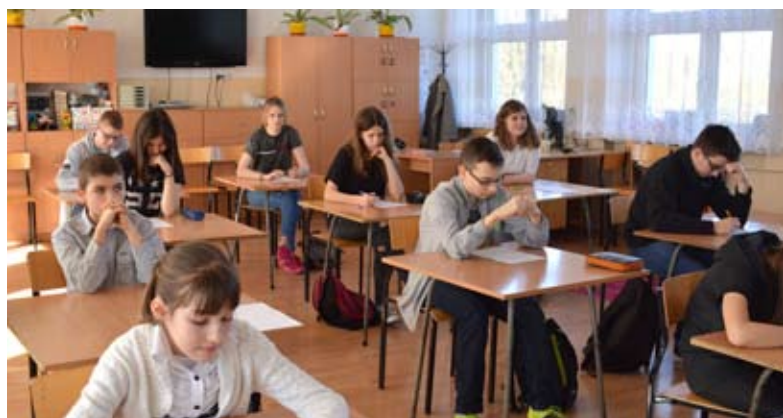
Władze miasta i międzyrzeckich placówek oświatowych stawiają na wszechstronny rozwój dzieci

w ramach Europejskiego Funduszu Społecznego, które umożliwiają realizację dodatkowych zajęć i wyposażanie pracowni. Wszystkie międzyrzeckie szkoły przystąpiły do Narodowego Programu Rozwoju Czytelnictwa, dzięki któremu możemy pozyskać pieniądze na zakup ciekawych pozycji książkowych. W budżetach szkół zaplanowano środki finansowe na zakup pomocy dydaktycznych, doskonalenie zawodowe nauczycieli oraz na zastępstwa za nieobecnych nauczycieli.