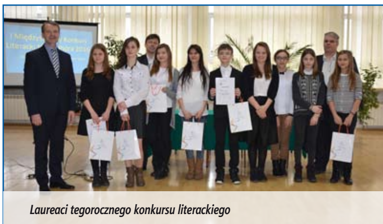
Laureaci tegorocznego konkursu literackiego