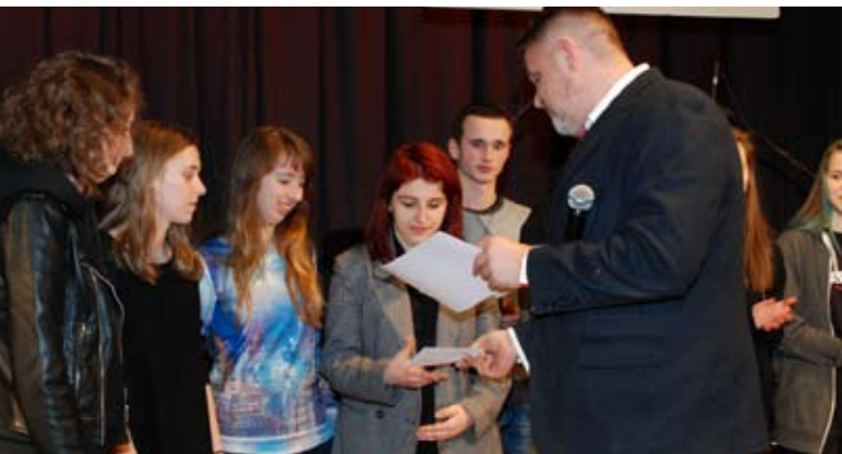
Żeńska grupa The Riddle z Krakowa odebrała nagrodę za II miejsce