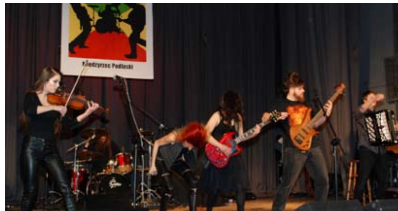
Gwiazda wieczoru – Merkfolk