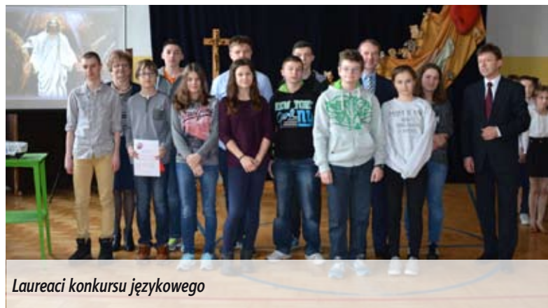
Laureaci konkursu językowego