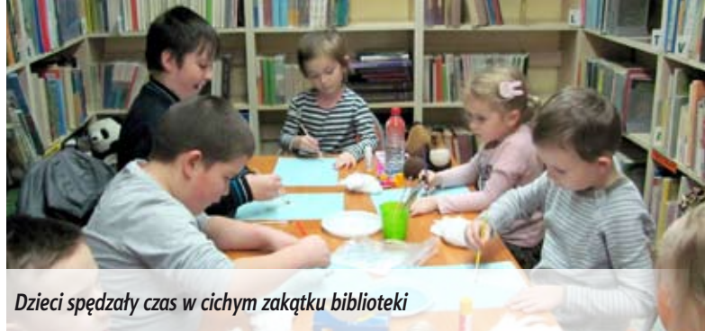
Dzieci spędzały czas w cichym zakątku biblioteki

Choć na dworze zabrakło śniegu w Miejskiej Bibliotece Publicznej w Międzyrzeczu Podlaskim w czasie ferii było bardzo zimowo. Panie bibliotekarki zadbały o atrakcje dla najmłodszych. Było wspólne czytanie, wykonywanie zimowych prac plastycznych. Czas miło płynął przy grach planszowych i klockach.