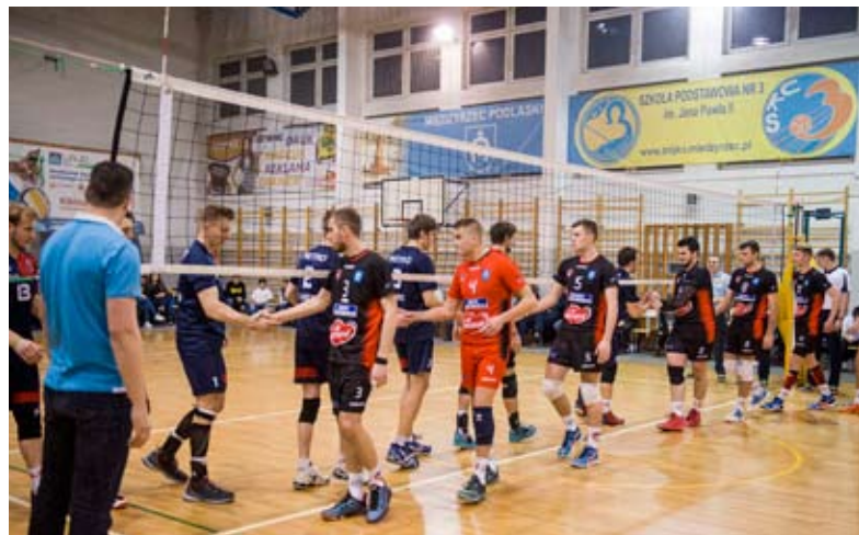
Przywitanie drużyn KS MOSiR Huragan – KS Metro Warszawa

W półfinale, który odbędzie się w dniach 22-24 kwietnia, Huragan Międzyrzec zagra z SKS Hajnówka, Czarnymi Rzańsina i Norwidem Częstochowa