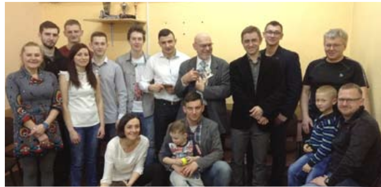
Spotkanie po latach. Niektórzy zawodnicy przejechali kawał drogi, aby spotkać się ze swoim dawnym trenerem