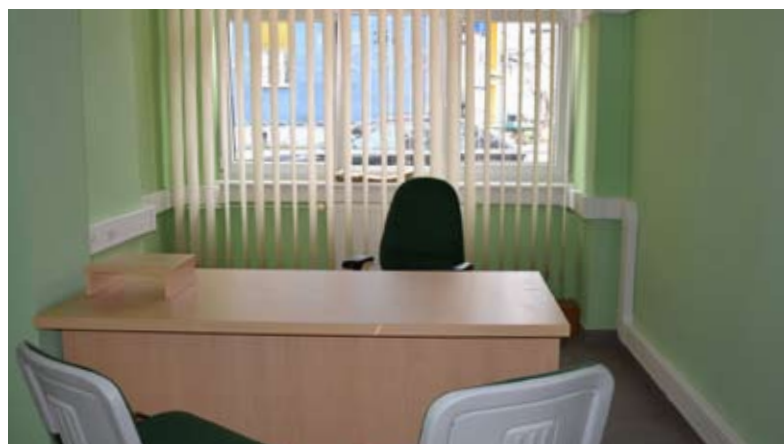
Wolne pomieszczenie czeka na drugiego pracownika, bo docelowo w punkcie mają pracować dwie osoby