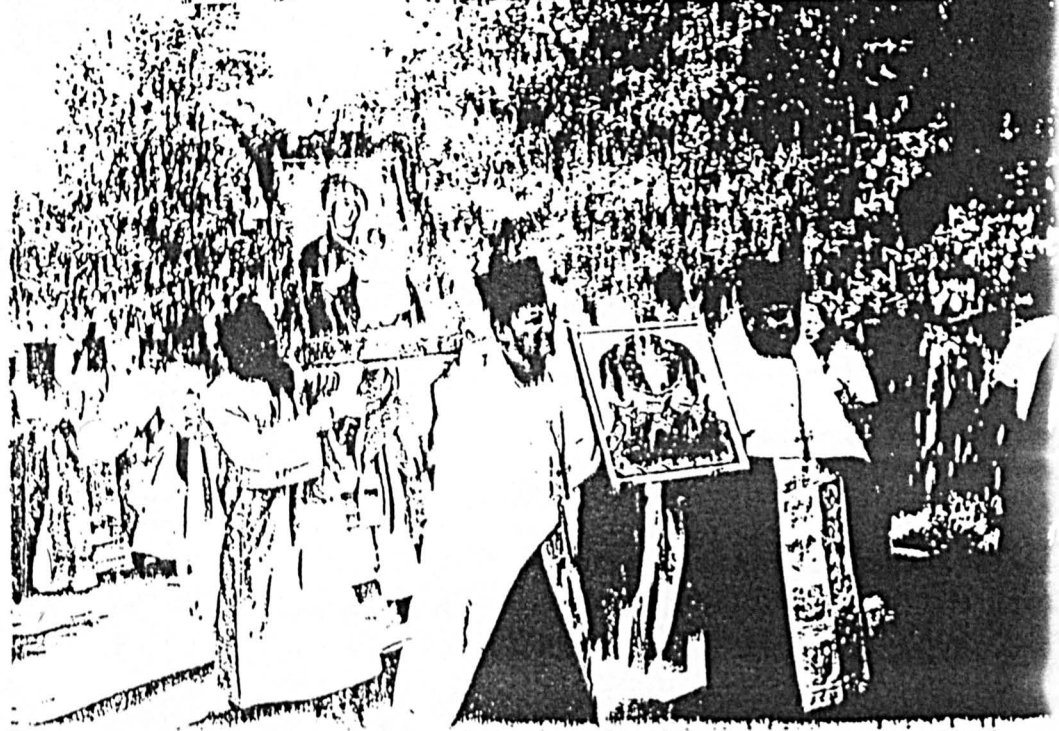
Wzięcia z ulicami święta Przemienienia Pańskiego na świętej Górze