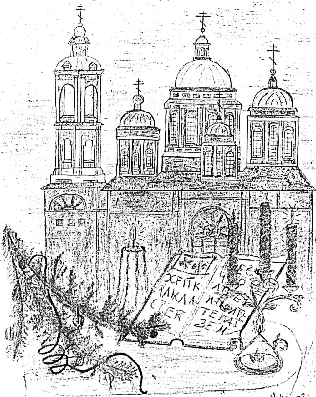
Hykomai: Janosian Gasm