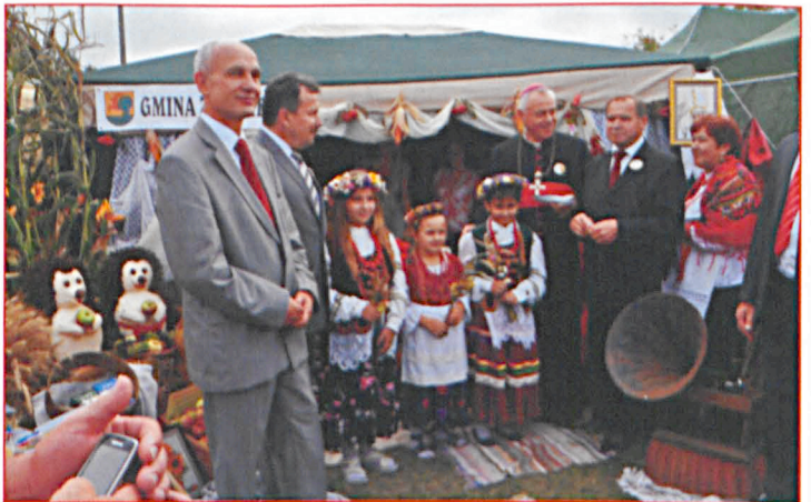
Wieniec i stoisko przygotował GOK, panie z zespołu śpiewaczego Dobrynianki potrawy regionalne.