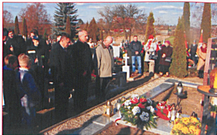
Tradycyjnie coroczne święto Niepodległości 11 listopada obchodzono w Malowej Górze. Msza św. w miejscowym kościele i uroczystości na cmentarzu to uczczenie pamięci tych wszystkich, którzy walczyli o niepodległą Polskę.