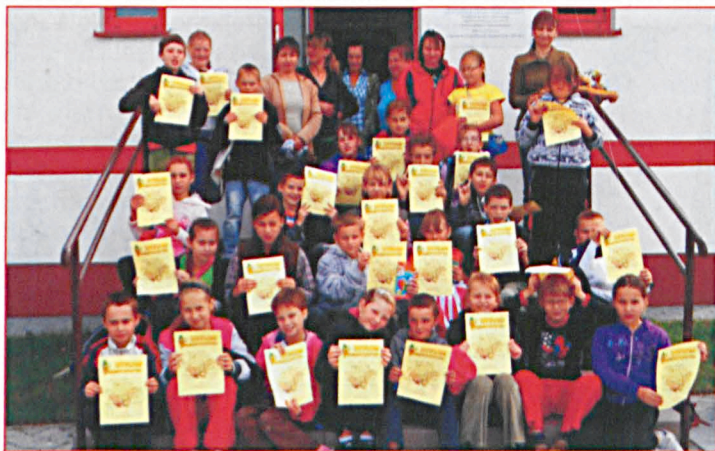
Szkoła Podstawowa w Dobryniu Dużym przy współpracy rodziców i Stowarzyszenia na rzecz Rozwoju Miejscowości Dobryń Duży zorganizowała w dniach 5-6 października Święto Pieczonego Ziemniaka