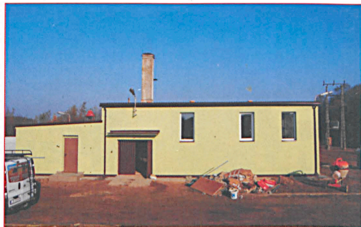
Zostało zmodernizowane gminne ujęcie wody w Zalesiu