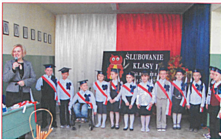
Jak co roku pierwszaki z gminnych szkół podstawowych składały ślubowanie, na zdjęciu pierwszoklasiści z Zalesia i Wólki Dobryńskiej.