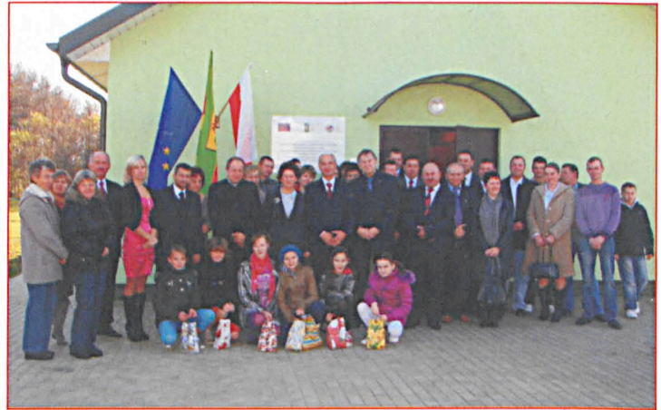
Świetlica w Kijowcu PGR przed remontem i podczas uroczystości otwarcia po remoncie