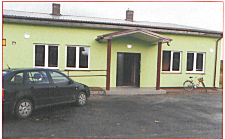
Świetlica w Malowej Górze przed i po remoncie