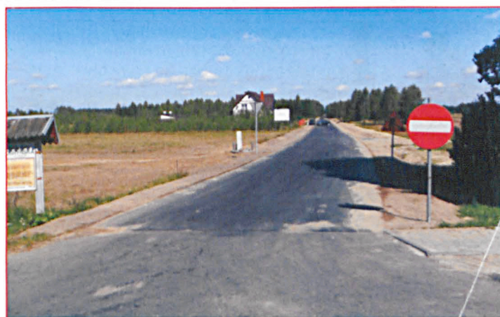
Droga pomiędzy Dobryniem Dużym a Wólką Dobryńską w trakcie budowy i po jej zakończeniu