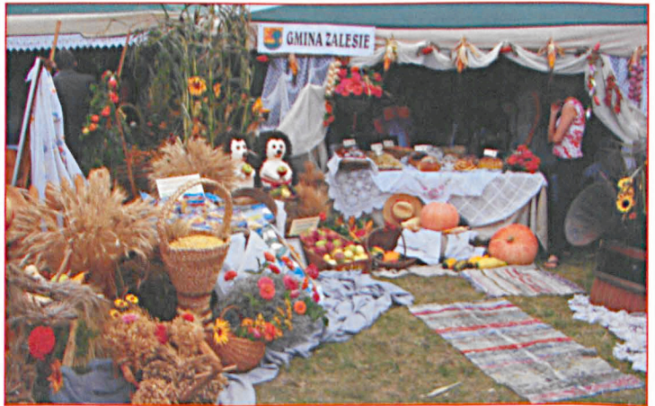
Dożynki powiatowe w Sławatyczach 28 sierpnia 2011 r. Tradycyjnie gminę Zalesie reprezentowała delegacja. Gmina Zalesie otrzymała wyróżnienie w kategorii najpiękniejszy wieniec dożynkowy i najładniejsze stoisko gminne oraz nagrodę specjalną w kat. nowoczesny wieniec dożynkowy.