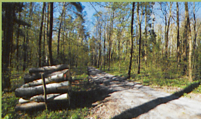
Rezerwat "Czarny Las"