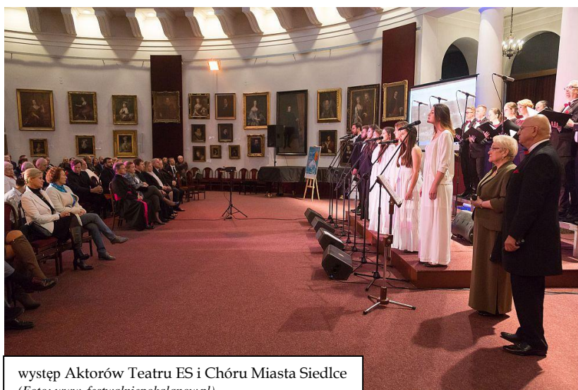
występ Aktorów Teatru ES i Chóru Miasta Siedlce