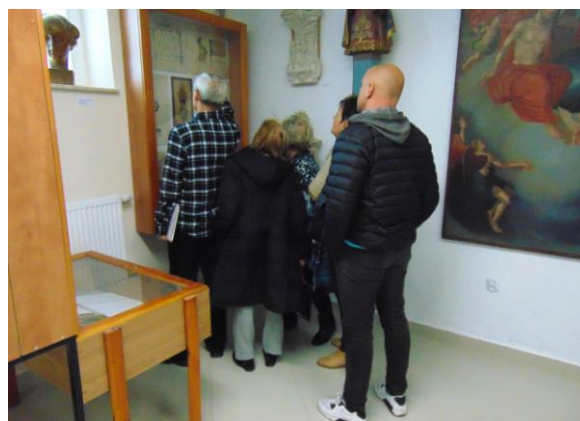
w muzeum przed gablotą z własnoręcznymi szkicami dziadka