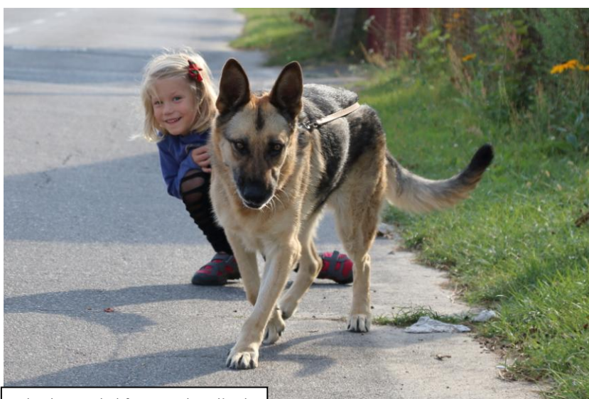
wierni ze swoimi futrzanymi pupilami