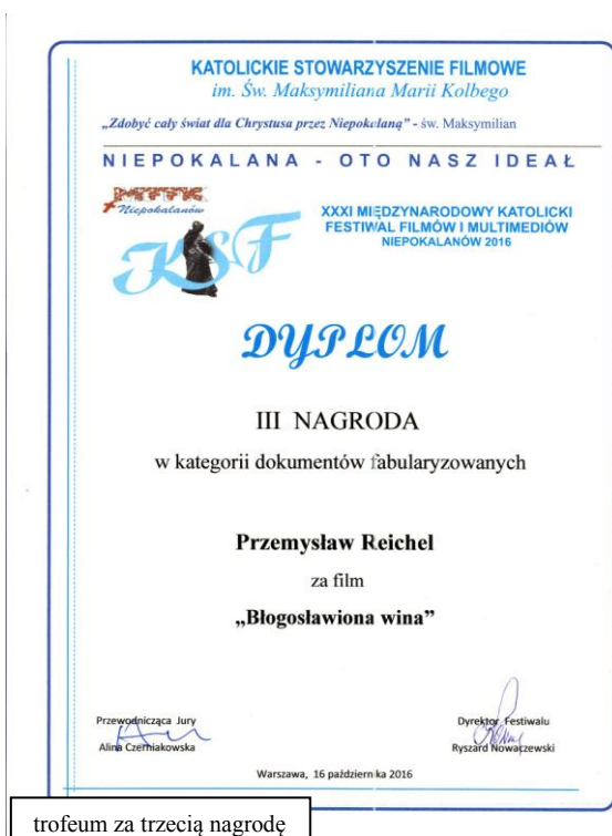
trofeum za trzecią nagrodę