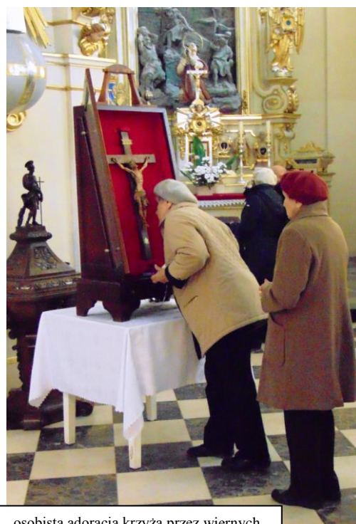
osobista adoracja krzyża przez wiernych

W okresie czterech miesięcy, krzyż nawiedzi 68 ośrodków Towarzystwa w całej Polsce (na terenie diecezji siedleckiej są trzy placówki). Do Kodnia przybył z Terespoła, zaś w południe (14 X 2016r.) został pożegnany i przewieziony do Chelma.