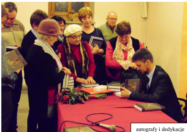
autografy i dedykacje