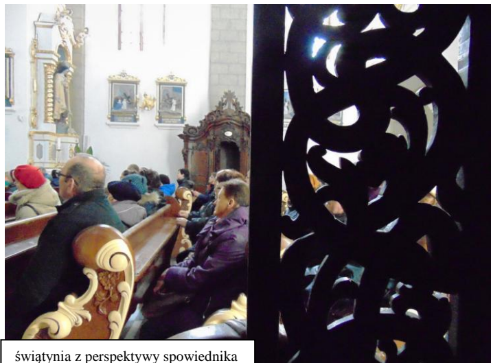
świątynia z perspektywy spowiednika

Tajemnicą Boga jest, że szafarzem pojednania, przebaczenia, rozgrzeszenia, nawet z najbardziej ciężkich grzechów, uczynił człowieka - kapłana. Tylko jego! To niektórym penitentom sprawia trudność. Mają pokusę, by