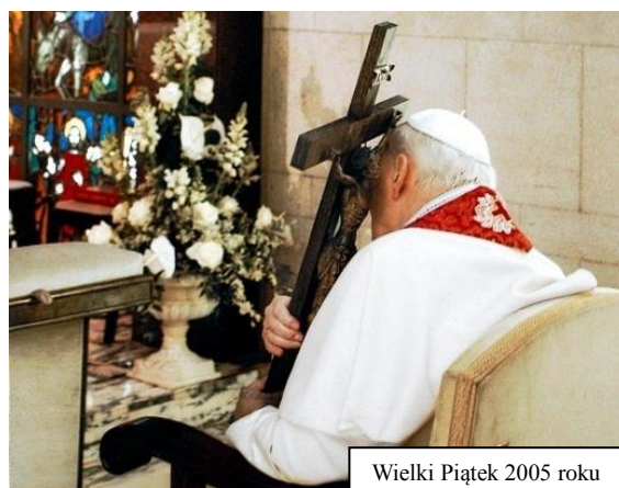
Wielki Piątek 2005 roku

W środowy wieczór (13 X 2016 r.), w kaplicy Domu Pogodnej Starości imienia św. Brata Alberta w Kodniu, zgromadzili się wszyscy pensjonariusze i pracownicy.