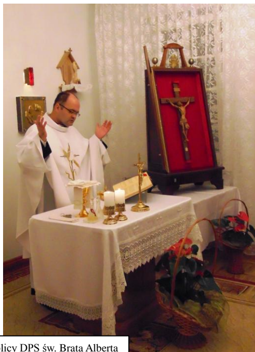
Msza św. w kaplicy DPS św. Brata Alberta

O godz. 18:45 - a była to niezwykajna pora, gdyż zwykle, sędziwi domownicy, udają się o tej godzinie na nocny spoczynek - proboszcz kodeński rozpoczął Mszę św. Do modlitwy, o tym czasie, przynaglił wszystkich szczególny znak, peregrynujący po ośrodkach pomocy św. Brata Alberta w Polsce - krzyż, który św. Jan Paweł II trzymał w rękach podczas ostatniej swojej Drogi Krzyżowej, w Wielki Piątek 2005 r. Papież nie mógł osobiście uczestniczyć w tym nabożeństwie pasyjnym, w Rzymskim