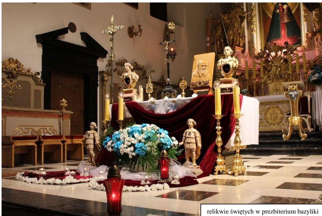
relikwie świętych w prezbiterium bazyliki

Niniwa oraz Ministrantów. Procesyjnie przeszliśmy od kaplicy św. Wawrzyńca na starym cmentarzu do bazyliki św. Anny.