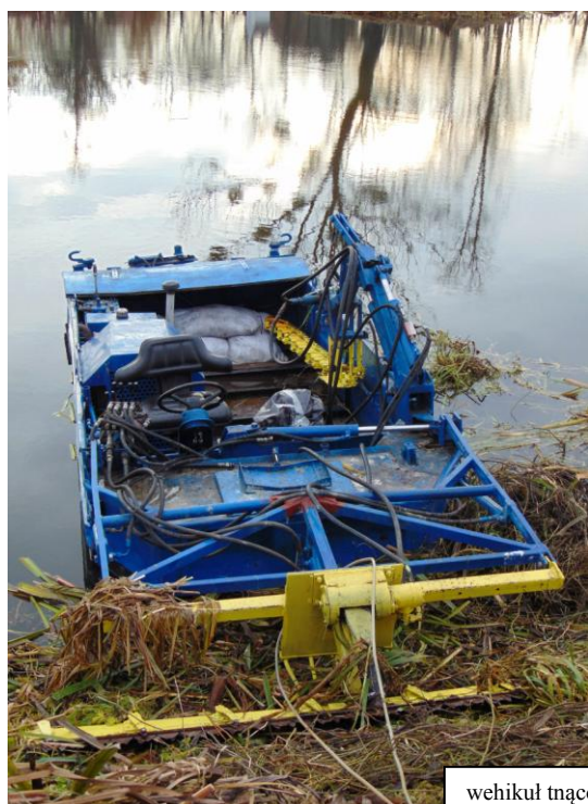
wehikuł tnący - koszący

Korzystając ze sprzyjającej aury, w połowie listopada, przeprowadzono prace mające na celu wycinę trzcinowisk i wodorostów, z "Rozlewiska Genezaret" oraz rzeki Kałamanki na terenie kodeńskiej kalwarii.