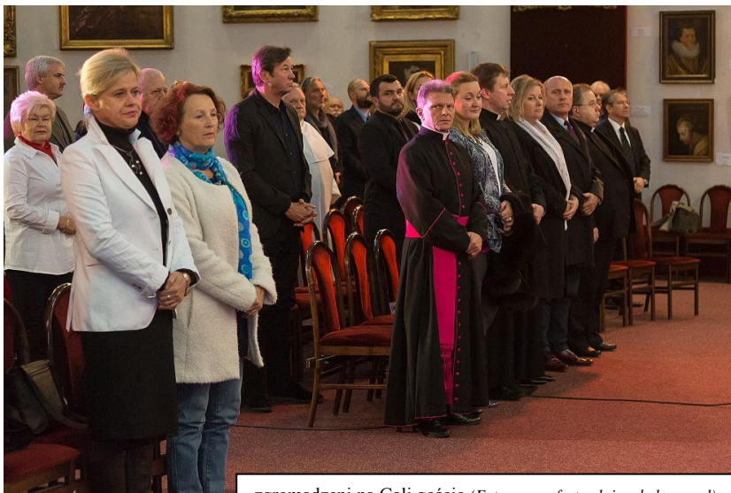
zgrupowani na Gali goście