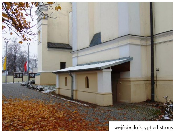
wejście do krypt od strony południowej bazyliki

Po wybudowaniu murowanego kościoła św. Anny, którego fundatorem był Mikołaj Pius Sapieha, w mieście Kodeń