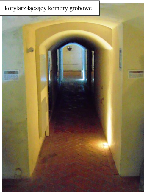
korytarz łączący komory grobowe