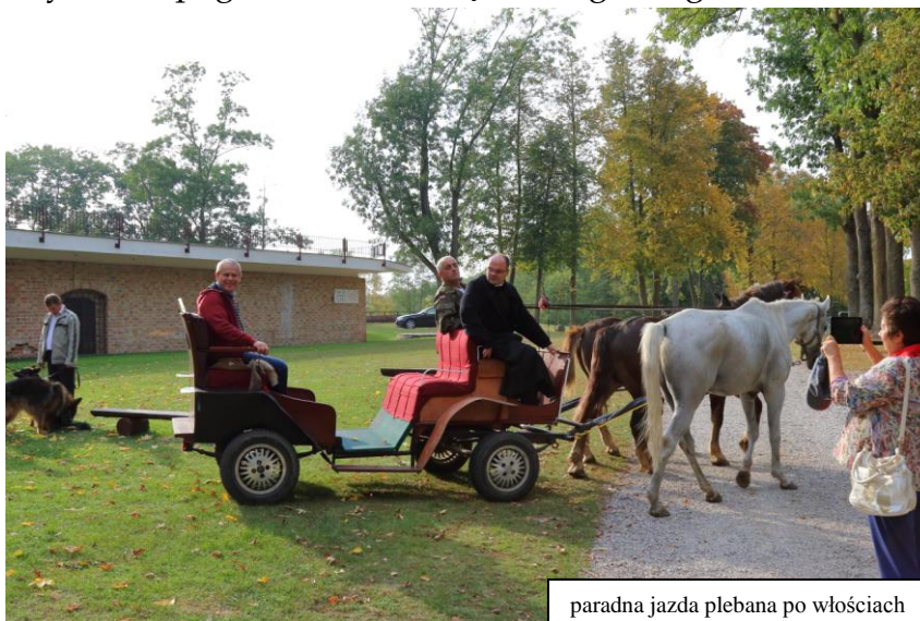
paradna jazda plebana po włościach

Atrakcją dla dzieci była możliwość przejażdżki na kucyku. Kustosz zaś - siedząc na bryce ciągniętej przez dwa konie - majestatycznie paradował. :)