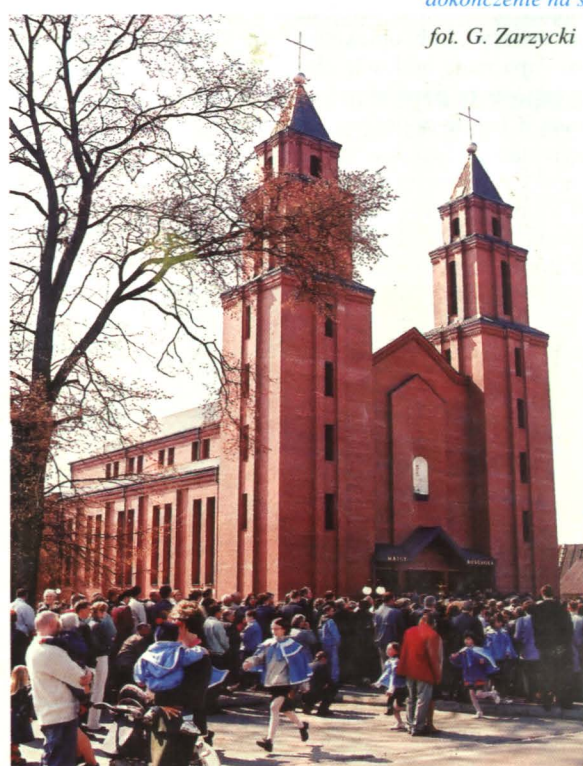
Kościół pw. NMP Matki Kościoła w Łukowie