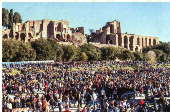
Punkt informacyjny na Circo Massimo

Tradycyjnie na przełomie roku odbywają się w dużych miastach Europy spotkania młodzieży, organizowane przez Wspólnotę Ekumeniczną z Taize. Ostatnie miało miejsce w Rzymie w dniach 28 grudnia - 2 stycznia. Papież spotkał się z młodzieżą 29 grudnia na Placu Św. Piotra.