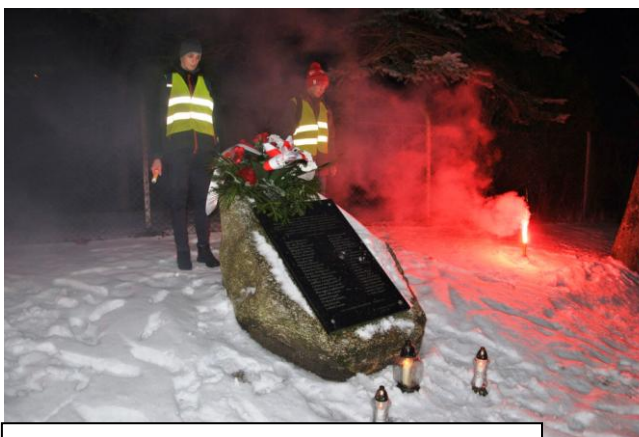
przy pomniku upamiętniającym Kodeńskich Powstańców