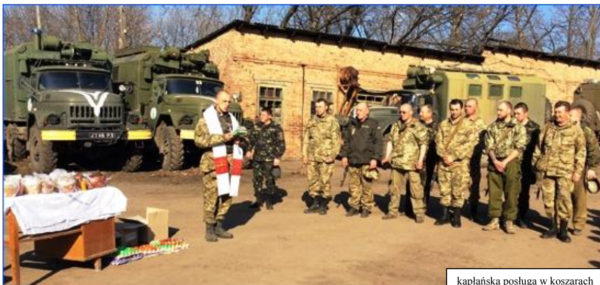
kapłańska posługa w koszarach

Ze stacji duchownego odbiera samochód wojskowy i wiezie do miejsca posługi. Trzeba zaznaczyć, że znajduje się ono na pierwszej linii frontu, często pod dużym ostrzałem.