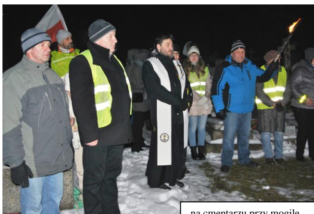
na cmentarzu przy mogile Powstańców Styczniowych