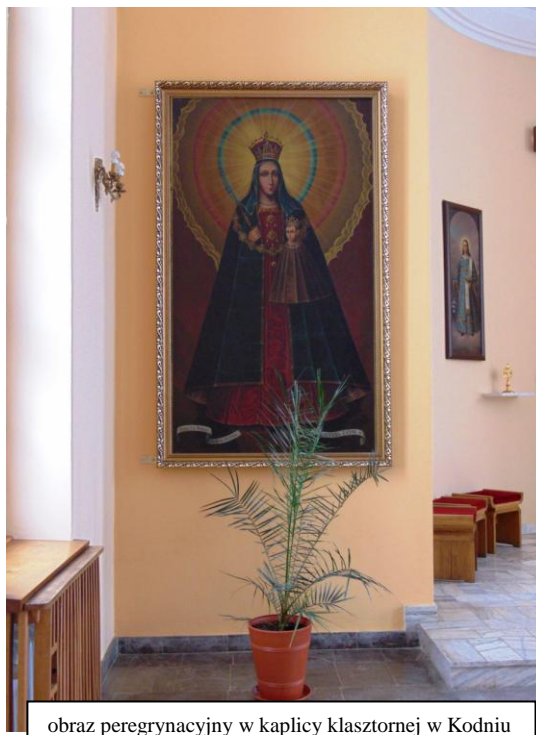
obraz peregrynacyjny w kaplicy klasztornej w Kodniu