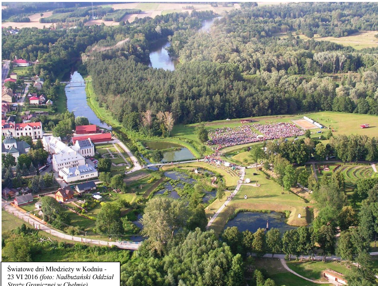
Światowe dni Młodzieży w Kodniu - 23 VI 2016

Pod koniec ubiegłego roku, w lubelskim Centrum Spotkania Kultur, ogłoszono wyniki plebiscytu, którego celem było wyłonienie i uhonorowanie najbezpieczniejszej imprezy 2016 roku.