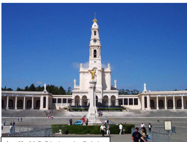
bazylika M. B. Różańcowej w Fatimie

Liczymy, że podjęte działania, pomogą nam lepiej zrozumieć i realizować wolę Boga, przekazaną w Objawieniu i Tradycji Kościoła, dadzą radość z prowadzenia świadomego życia duchowego i pomogą owocniej korzystać z łaski Bożego Miłosierdzia, którego przejawem były objawienia fatimskie Maryi.