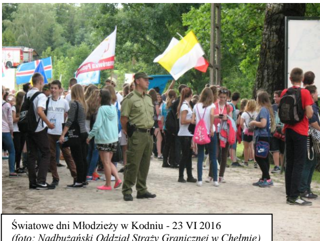
Światowe dni Młodzieży w Kodniu - 23 VI 2016

wzięło udział około 7 000 młodzieży, z 39 krajów". Przybywający uczestnicy nawiedzali bazylikę, z Cudownym Obrazem Matki Bożej, przez cały 23 dzień lipca, zaś głównym punktem spotkania była celebra na kodeńskich błoniach.