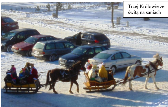
Trzej Królowie ze świątą na saniach

Tradycyjnie 6. stycznia, po Mszy św. o godz. 10:00, wyruszył z kodeńskiej bazyliki Orszak Trzech Króli. W tym roku, odbywał się w wyjątkowo zimnej atmosferze, na dworze mróz sięgał 20 stopni Celsjusza.