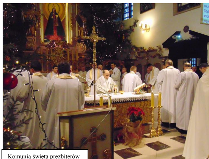
Komunia święta prezbiterów