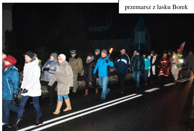
przemarsz z lasku Borek

W niedzielę, 22. stycznia br., w 154. rocznicę tego ważkiego - choć powszechnie mało znanego - wydarzenia, Wójt Gminy Kodeń, Towarzystwo Przyjaciół Kodnia i Zespół Placówek Oświatowych, po raz drugi, zorganizowali obchody patriotyczne, pod hasłem "Na Kodeń marsz", upamiętniające to wydarzenie. Ich uczestnicy przemaszzerowali (z pochodniami, przy wystrzale rac i petard) z lasku Borek - oddalonego od centrum Kodnia o 5 kilometrów (pamiętnej nocy było to miejsce zborne grup powstańczych z okolicznych wsi) - do