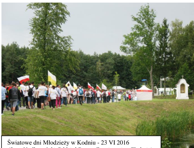
Światowe dni Młodzieży w Kodniu - 23 VI 2016

Jak podają nagrodzeni Organizatorzy "w wydarzeniu tym