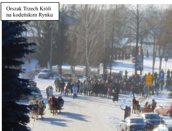
Orszak Trzech Króli na kodeńskim Rynku

Mimo to, licznie zebrani wierni, dziarskim krokiem podążali za saniami,