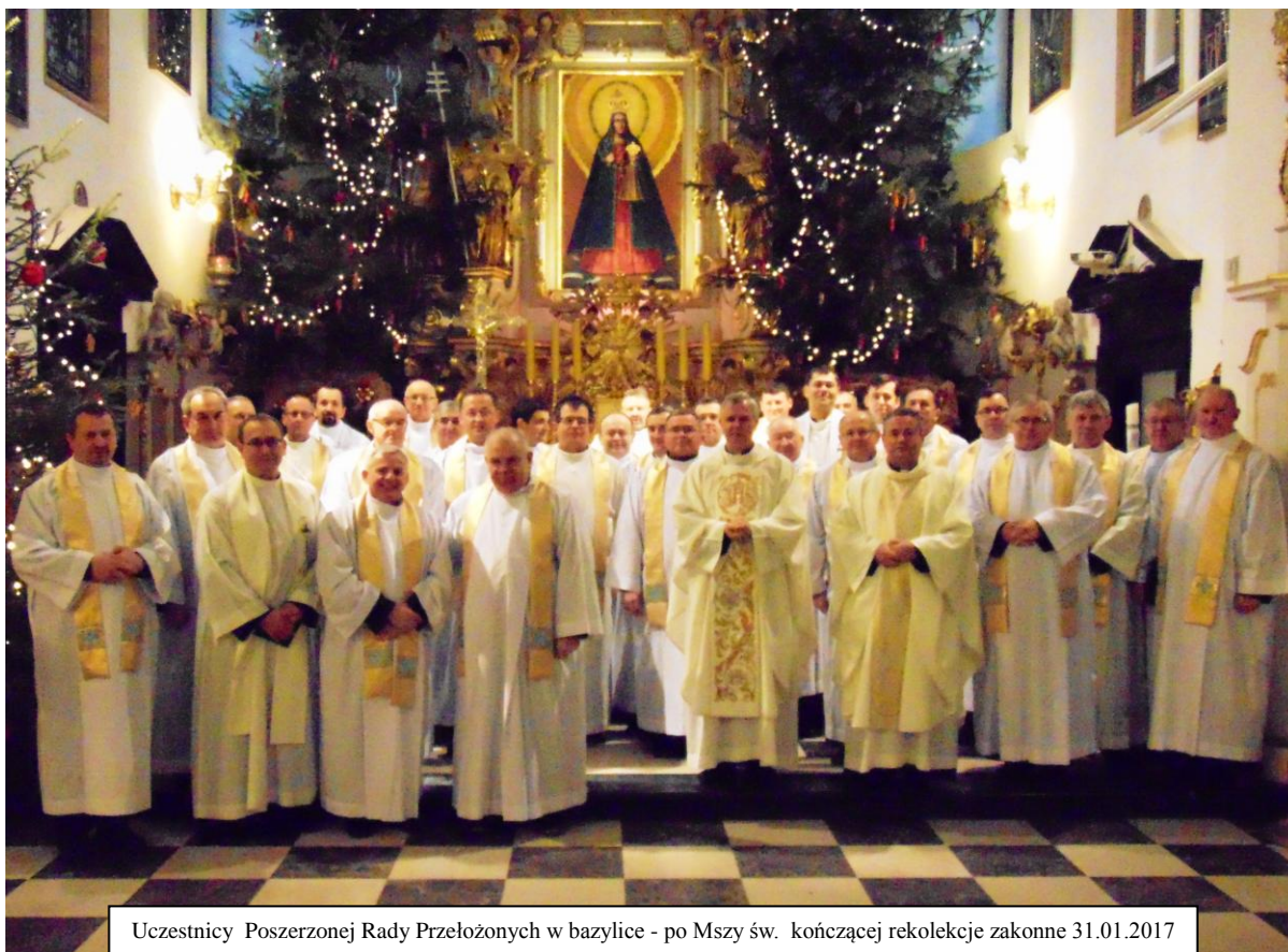
Uczestnicy Poszerzonej Rady Przełożonych w bazylice - po Mszy św. kończącej rekolekcje zakonne 31.01.2017