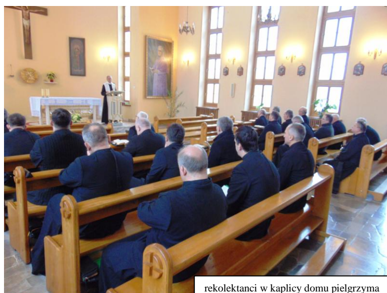
rekolektanci w kaplicy domu pielgrzyma

W dniach od 26. do 31. stycznia br., w domu pielgrzyma kodeńskiego sanktuarium, miała miejsce pierwsza seria rekolekcji, głoszonych rokrocznie dla Misjonarzy Oblatów M. N. Jej uczestnikami byli przełożeni zakonni, należący do Polskiej Prowincji Zgromadzenia. Seria dla przełożonych odbywała się dotąd w domu prowincjalnym w Poznaniu. W tym roku postanowiono - ze względu na lepsze warunki lokalowe - że odbędzie się w Kodniu.