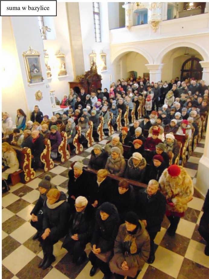
suma w bazylice

Najpierw nastąpiło zawiązanie grupy i pokrzepienie - po trudnej podróży, śliskimi, ośnieżonymi drogami - przy wspólnej kawie, herbacie i ciście. Pół godziny przed sumą pielgrzymi odmówili w bazylice różaniec. O godzinie 12:00