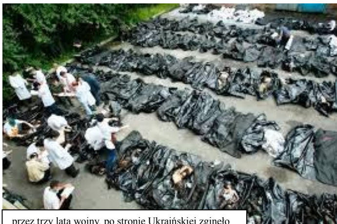
przez trzy lata wojny, po stronie Ukraińskiej zginęło ponad 10 000 ludzi, po stronie Rosyjskiej - choć tego się nie ujawnia - co najmniej dwa razy tyle.

O. Wyszkowski wspominał osiemdziesiąt tysięcy (znane nam z przekazów medialnych) miasto Andriejewka, w którym posługiwał. Jest ono cały czas pod