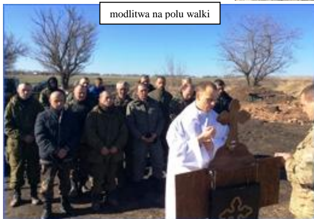
modlitwa na polu walki

wojsko miejsce. Może ze sobą zabrać tylko: rzeczy osobiste, sutannę, olej do namaszczenia chorych, Najświętszy Sakrament, trzy bandaże, kamizelkę kuloodporną. Inne rzeczy wysyła pocztą. W paczkach jest pomoc dla ludności (np. leki, żywność, odzież, koce, środki czystości...).