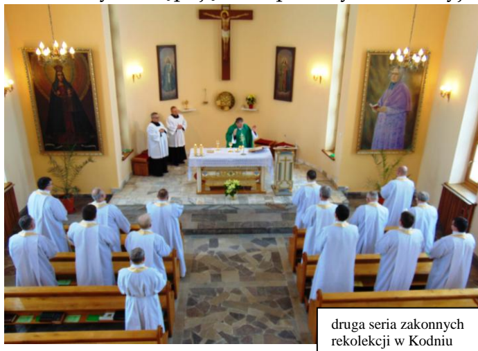
druga seria zakonnych rekolekcji w Kodniu

W okresie 10 tygodni, sanktuarium odwiedziły 4 pielgrzymki zorganizowane. Gościliśmy następujące wspólnoty rekolekcyjne: młodzież KSM z duszpasterstwa