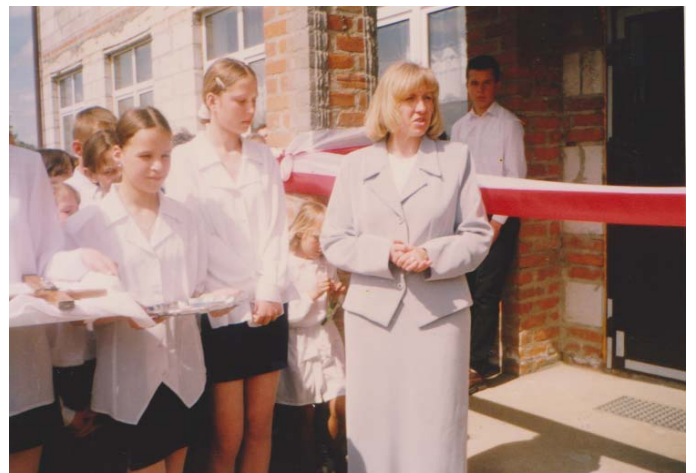
27 kwietnia 1999 roku nastąpiło oficjalne otwarcie budynku.

Marzec 1998 roku przyniósł wizyty wojewody lubelskiego i wójta gminy. Zaczęto również przygotowywać dokumentację centralnego ogrzewania. We wrześniu 1998 roku zakończono budowę linii elektrycznej. Do stycznia 1999 roku trwały prace kosmetyczne.