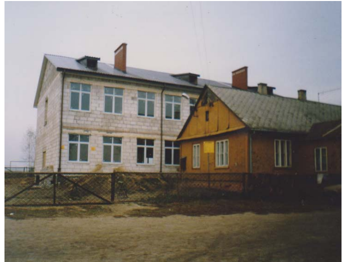
Listopad 1997 roku – nowa szkoła na tle starej.

25 listopada 1996 roku – ostatni dzień pracy. Ukończona została kondygnacja, zalano strop i zabezpieczono budowę na zimę.