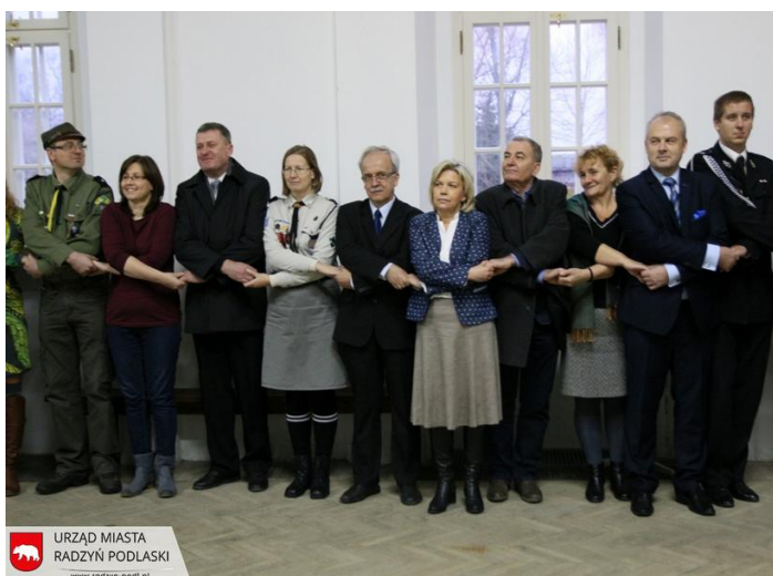
URZĄD MIASTA RADZYŃ PODLASKI www.radzyn-podl.pl