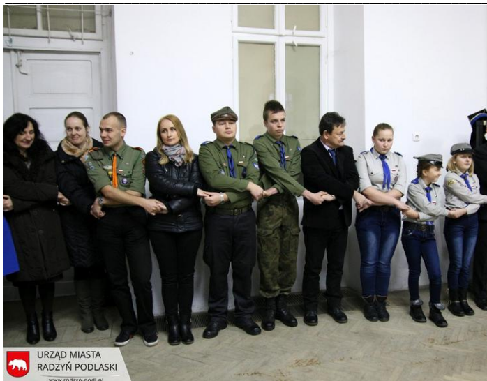
URZĄD MIASTA RADZYŃ PODLASKI www.radzyn-podl.pl