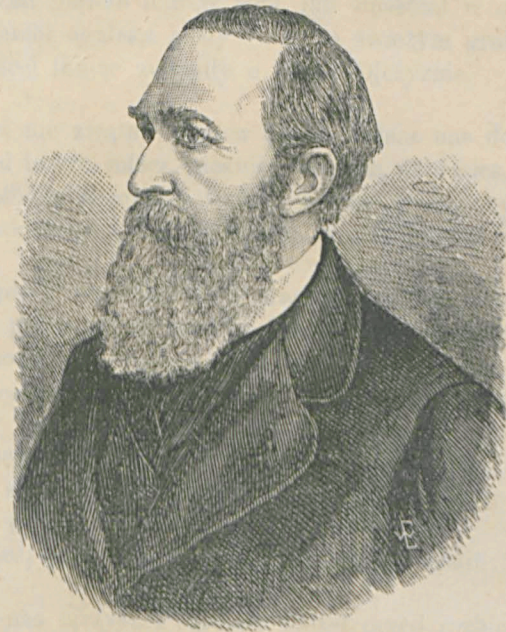
JÓZEF IGNACY KRASZEWSKI.