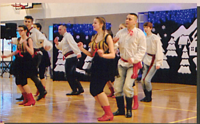
Macierzanka w folkowym szaleństwie