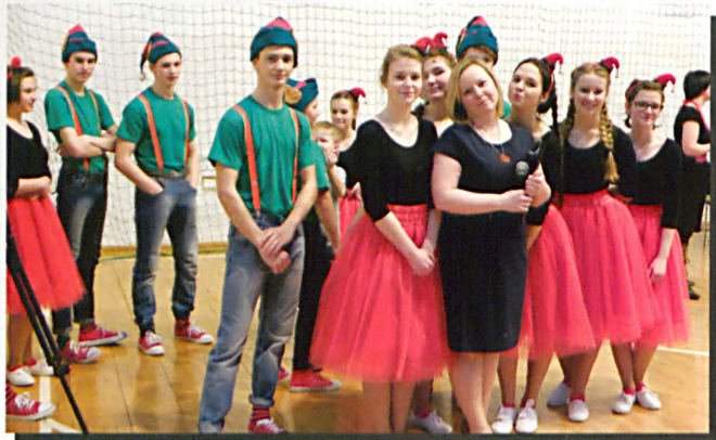
Tancerze Macierzanki z instruktorem