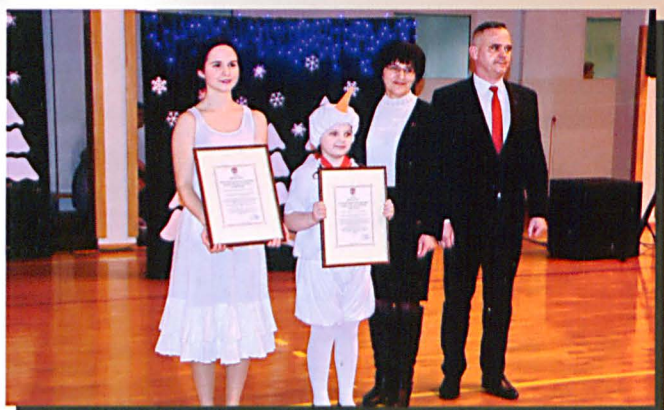
Nagrody starosty białskiego