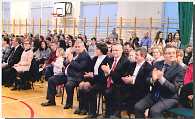
Oklaski władz samorządowych