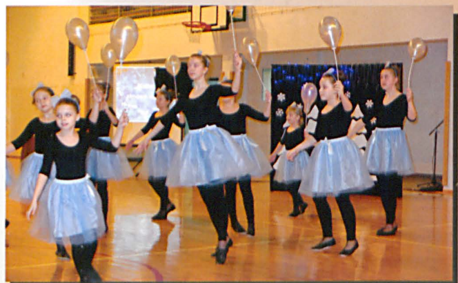
Figiel w śniegowej polce