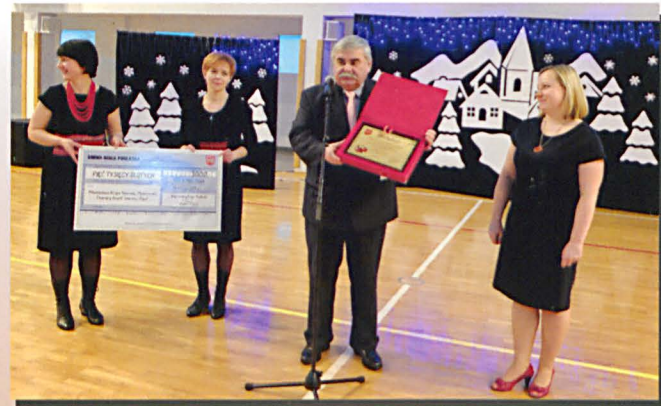
Nagrody wójta gminy