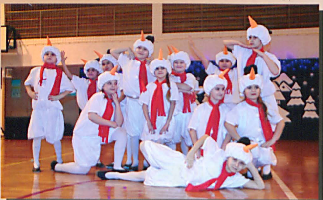
Figiel w tańcu bałwankoów