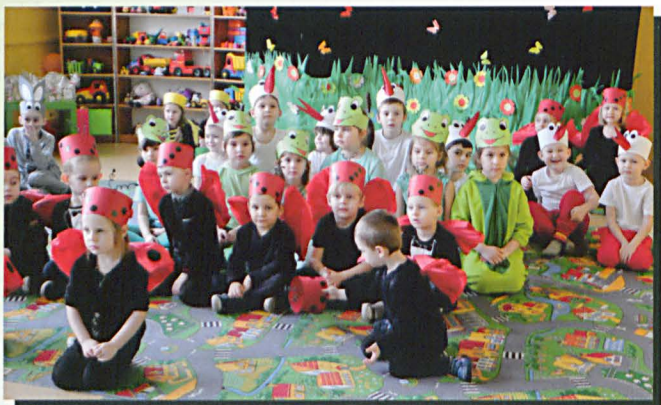
Biedronki i żabki na przedszkolnej łące