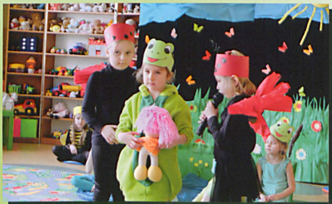
Skruszona żabka obiecała poprawę