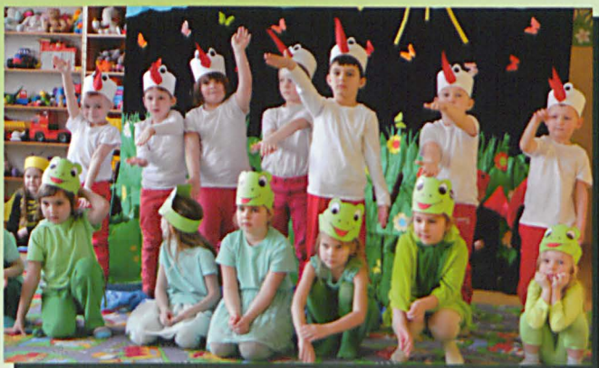
Bociany wyraźnie górą