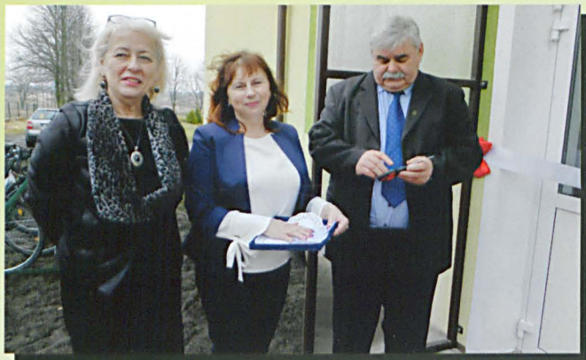
Uroczysty moment otwarcia nowych pomieszczeń