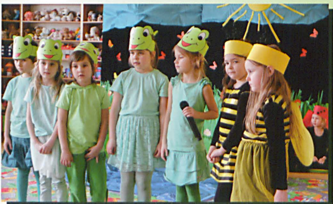
Pszczółki przyszły z pomocą