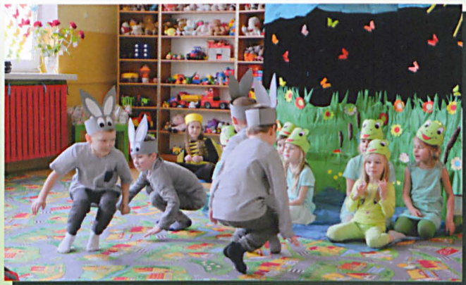
W poszukiwaniu zguby włączyły się zajęczki