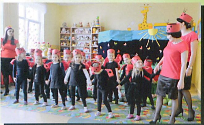
Opiekunki wspomagały wychowanków