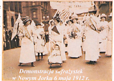
Demonstracja suffrażystek w Nowym Jorku 6 maja 1912 r.

Święto to zostało ustanowione dla upamiętnienia strajku 15 tysięcy kobiet, pracownic fabryki tekstylnej, które 8 marca 1908 roku w Nowym Jorku domagały się praw wyborczych i polepszenia warunków pracy. Właściciel fabryki zamknął strajkujące w pomieszczeniach fabrycznych z zamiarem uniknięcia rozgłosu. W wyniku nagłego pożaru zginęło 129 kobiet.