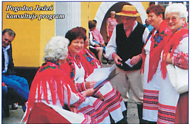
Pogodna Jesień konsultuje program