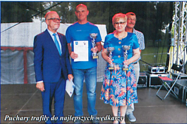
Puchary trafiły do najlepszych wędkarzy