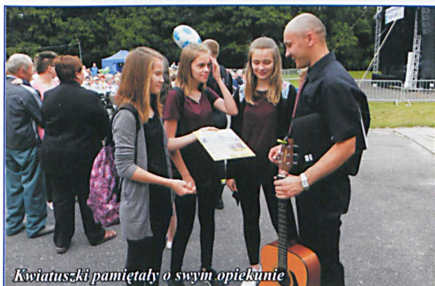
Kwiatuszki pamiętały o swoim opiekunie