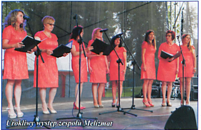
Urokliwy występ zespołu Melizmat