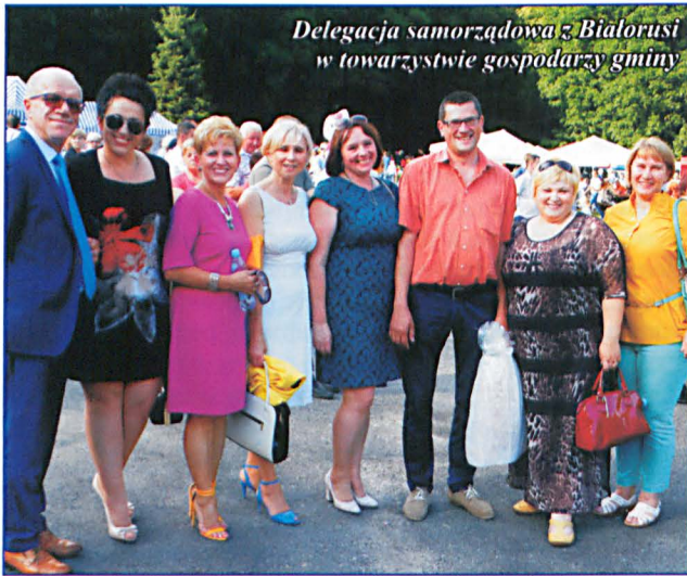
Delegacja samorządowa z Białorusi w towarzystwie gospodarzy gminy