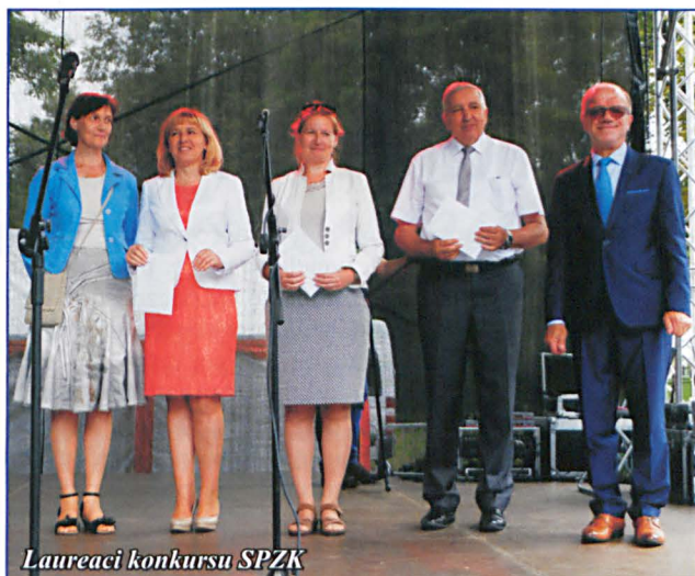
Laureaci konkursu SPZK