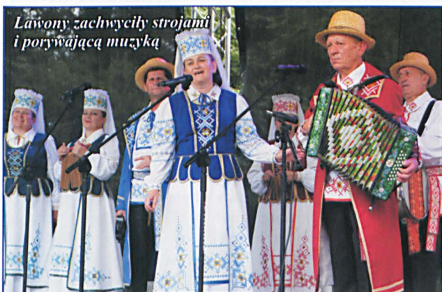
Lawnicy zachwycili strojami i porywającą muzyką