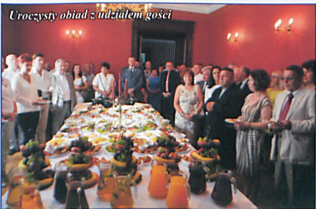
Uroczysty obiad z udziałem gości