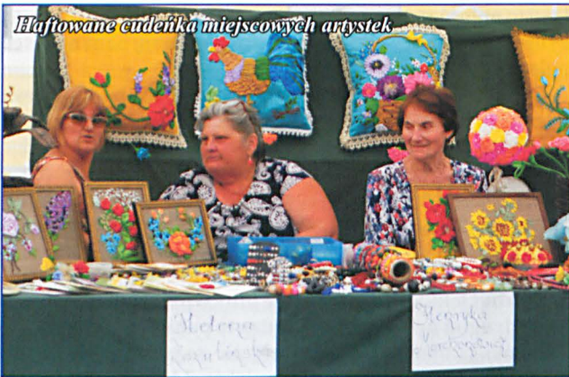
Łaftowane cudziółki miejscowych artystek