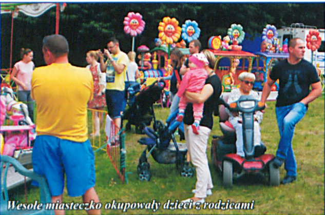
Wesołe miasteczko okupowały dzieci z rodzicami