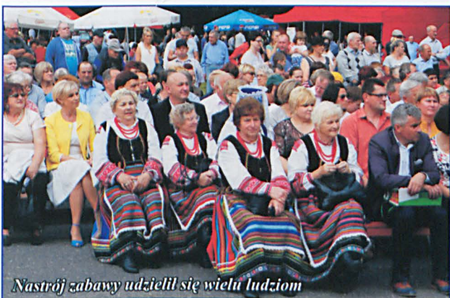
Nastroj zabawy udzielił się wielu ludziom