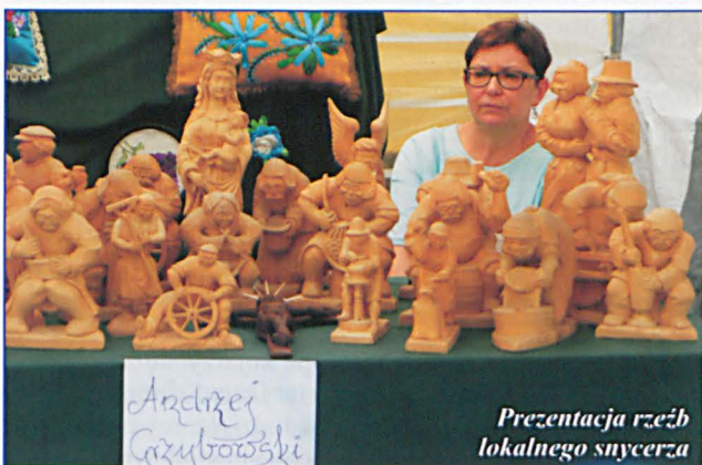
Prezentacja rzeźb lokalnego snycerza