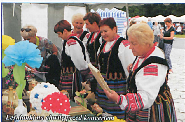
Leśnianki na chwilę przed koncertem