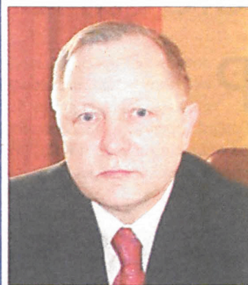
Andrzej Czapski prezydent miasta Biała Podlaska