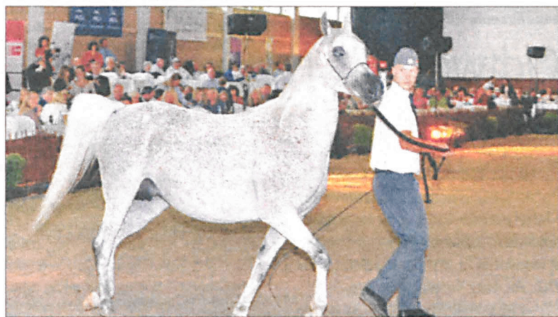
Dochody z tegorocznej aukcji przekroczyły 2 mln. euro

Konie z Michałowa wygrały w czterech konkurencjach championatu, a ponadto uzyskały najwyższą cenę w organizowanej po raz 44. Aukcji arabów czystej krwi, nie bez kozery