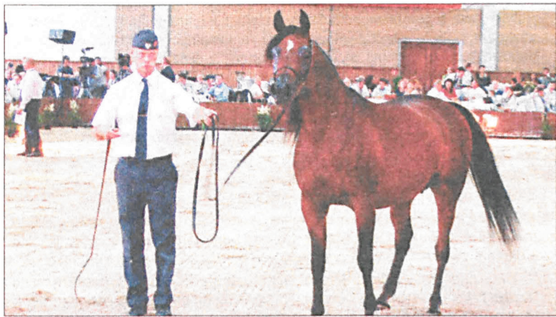
Belgijca z Janowa Podlaskiego sprzedana za 410 tys. euro