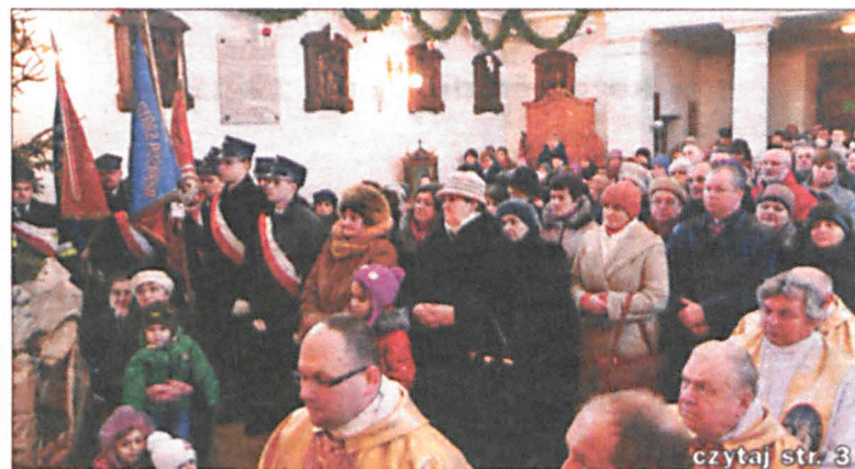
czytaj str. 3