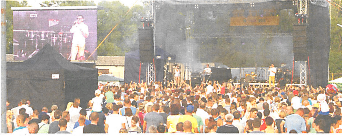
Na scenie Zenek Martyniuk i Akcent

Organizatorzy zadbał o zróżnicowany program. Na scenie wystąpiły takie gwiazdy jak: Enej, Akcent – legenda disco polo z charyzmatycznym Zenkiem Martyniukiem, Wojciech Gąssowski czy Daj Darogu z Brześcia. Nie zabrakło wykonawców lokalnych.