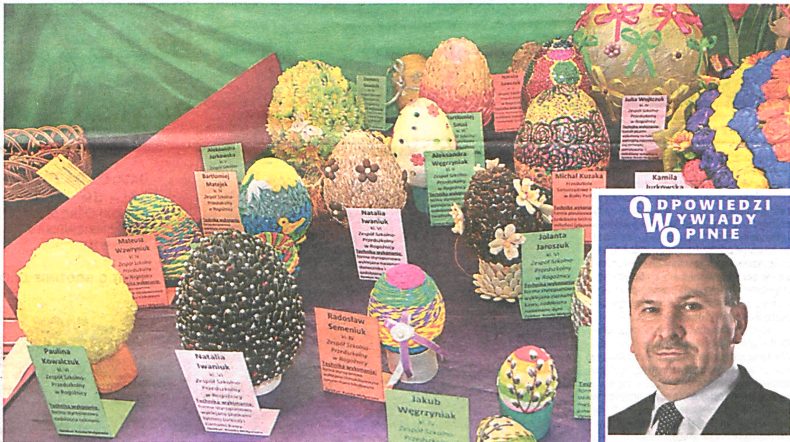
czytaj na str. 3