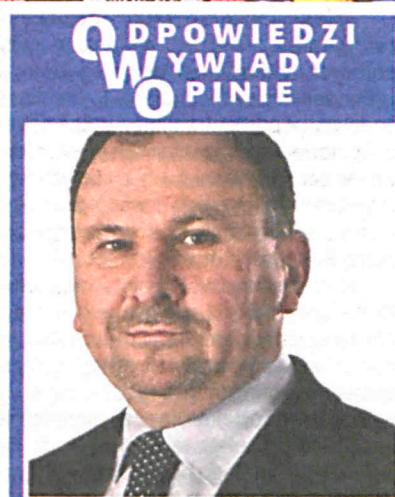
Stanisław Żmijan Poseł na Sejm, PO