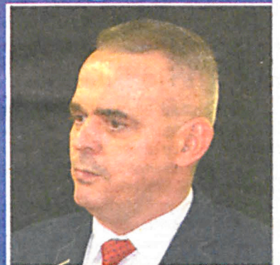
Mariusz Filipiuk Starosta powiatu białskiego