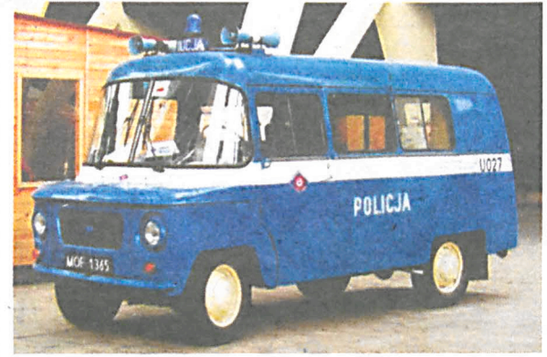
konkurs na temat historii białskiej „drogówki” oraz podamy bliższe informacje o planowanej wystawie i dalszych dziejach białskiej „lotnej”.

„Życie Białskie” objęło organizację wystawy patronatem medialnym. W najbliższą sobotę 25 czerwca, weterani drogówki spotkają się o godz. 13 na II Nadbużańskim Mundurowym Zlocie Motorowym przy Forcie Prochownia w Kobylanach. W zlocie będą też uczestniczyli przedstawiciele innych służb mundurowych (bliższe informacje o zlocie tel. 732 816 080). W kolejnych wydaniach naszego tygodnika ogłosimy