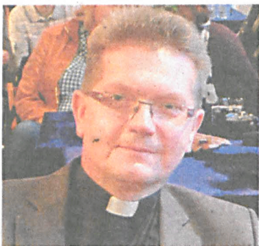
O. Eligiusz Dymowski Poeta i juror konkursu literackiego im. J. I. Kraszewskiego