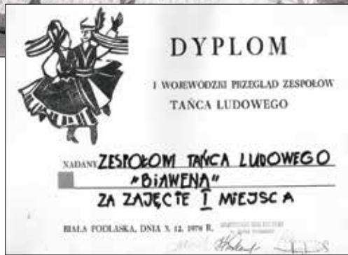
Dyplom za zajęcie I-go Miejsca w Przeglądzie Zespołów Tańca Ludowego – 3.12.1978 r.