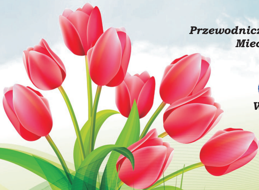
Wójt Gminy Terespol Krzysztof Iwaniuk