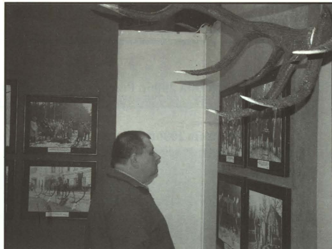
Nasi na Expo 2005