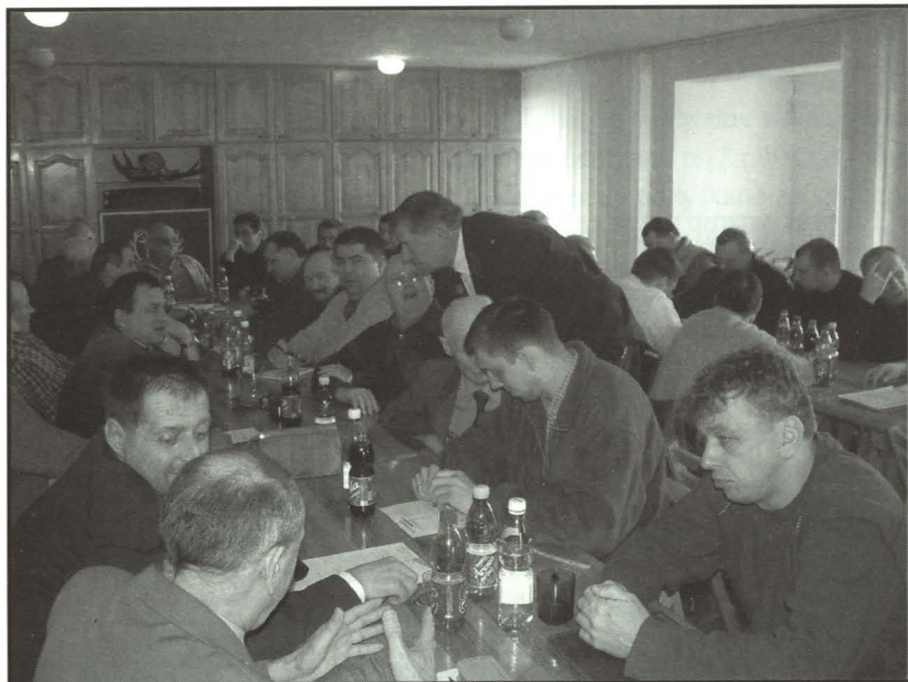
Na Walnym Zebraniu