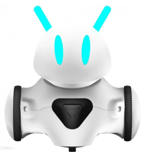
PHOTON - robot edukacyjny

Gminna Biblioteka Publiczna w Łomazach została zakwalifikowana do udziału w projekcie „ Kodowanie w Bibliotece ”. Projekt obejmuje 113 bibliotek z całej Polski, które otrzymały sprzęt służący do nauki kodowania dla dzieci i młodzieży oraz wiedzę na temat organizacji i prowadzenia tego typu zajęć w bibliotece.