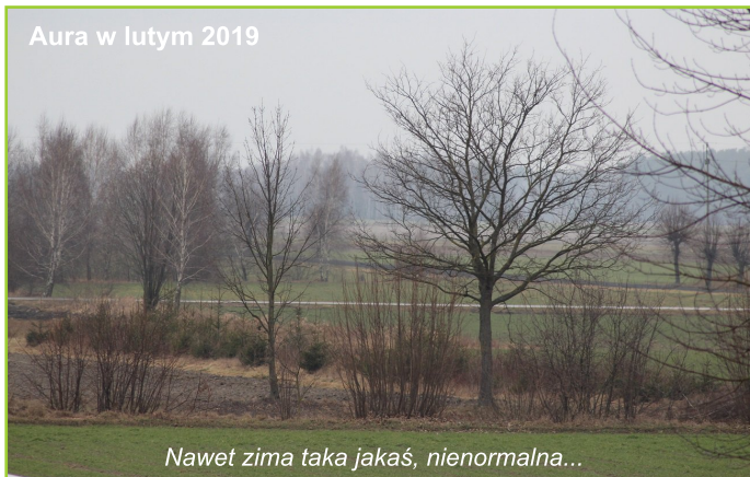
Nawet zima taka jakaś, nienormalna...

Do szczęścia tak niewiele trzeba... Czasem wystarczy tylko dłoń... To dotyk buduje szczęśliwe relacje, nie słowa.