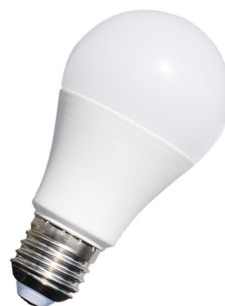
żarówka LED 15 W 1400 lm

Typowy zakres temperatury barwowej dla światła stosowanego w oświetleniu zawiera się w przedziale od 2 000K do 10 000K. Temperatura barwowa światła w zakresie od 2 700K do 3 000K odpowiada barwie ciepłobiałej (przesunięcie w kierunku koloru żółtego). Temperatura barwowa światła w zakresie od 5000 do 6500 K odpowiada barwie zimnobiałej . Pomiędzy tymi barwami rozpościera się to, co producenci nazywają światłem o barwie neutralnej .