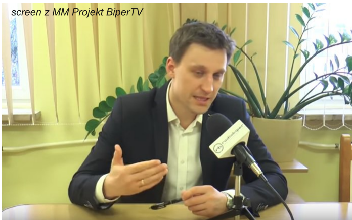
screen z MM Projekt BiperTV

Radio BIPER: - Rok 2019 rozpoczęty, budżet gminy Łomazy przyjęty jeszcze w ostatnich dniach grudnia 2018 roku. Ponad 30 mln po stronie wydatków, 29 z kawalkiem po stronie dochodu. Jak wyglądała sama praca nad budżetem? Czy jest on wystarczający?