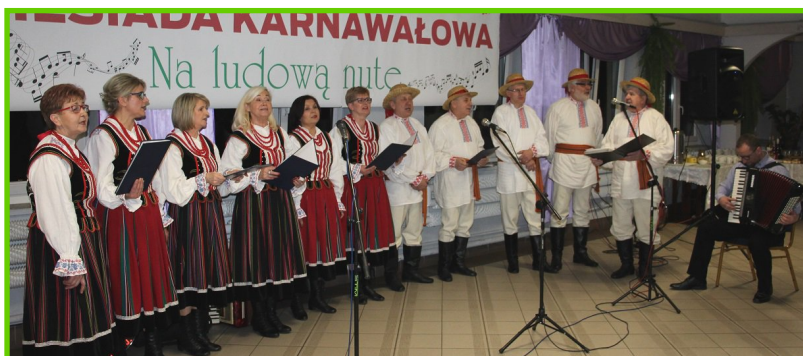
Gospodarz imprezy czyli zespół Śpiewam bo lubię