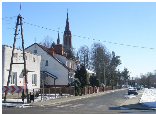
Zdjęcie powyżej (wykonane w lutym 2019) ukazuje to samo miejsce co zdjęcie obok, czyli ulicę Kościuszki widzianą ze skrzyżowania jej z ulicami - Lubelską i Małobrzeską.