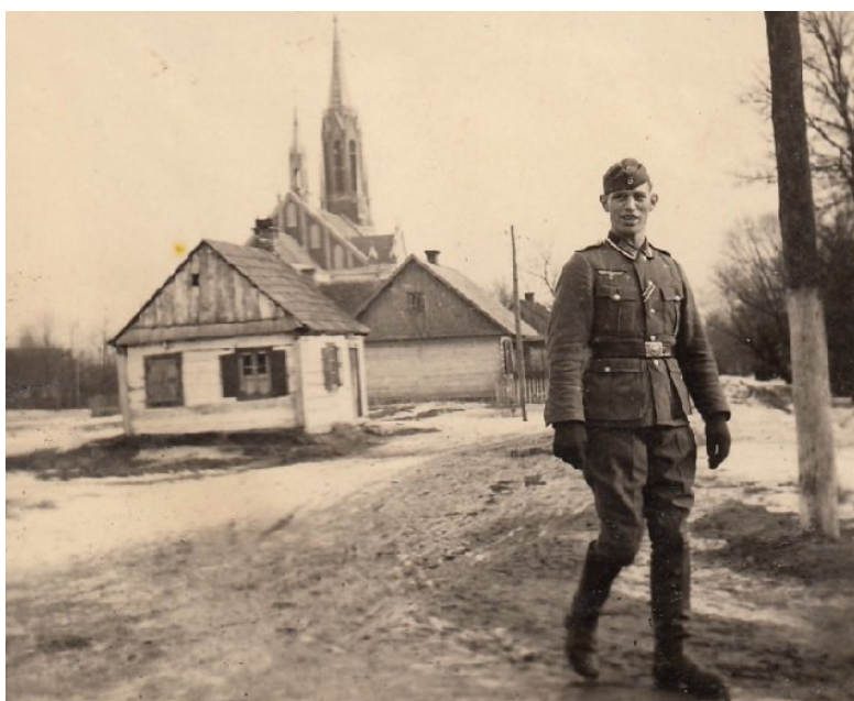
Łomazy - rok 1940. Widok na ul. Kościuszki. Na pierwszym planie niemiecki żołnierz.