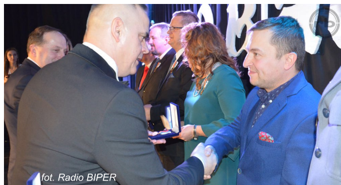
fol. Radio BIPER