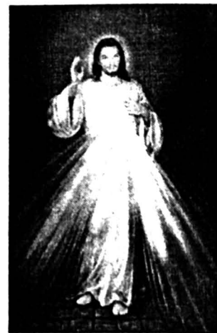
JEZUS UFAM TOBIE