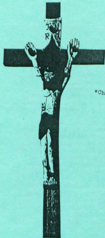
"Chrystus ukrzyżowany", Tadeusz Ignatowicz, Biała Podlaska