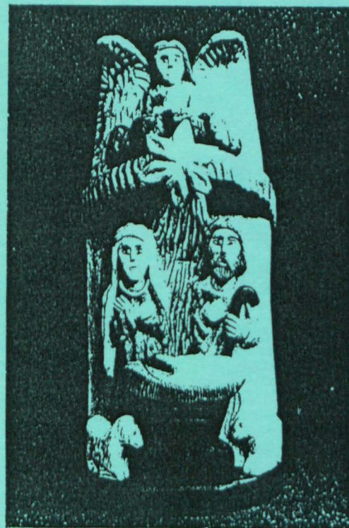
"Szopka", wykonał Mieczysław Zawadzki, Łuków