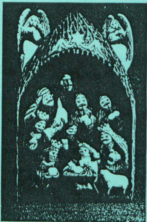
"Szopka", wykonał Krzysztof Osak, Łuków