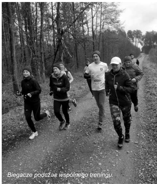
Biegacze podczas wspólnego treningu.

Klub Biegacza Szuracz Terespol działa jako sekcja lekkoatletyczna przy Miejskim Ośrodku Kultury w Terespolu. Obecnie mamy około 40 członków. Biegacze pierwsze starty biegowe w tym roku mają już za sobą. Zaplanowaliśmy także grupowe wyjazdy na zawody biegowe na 2019 rok. Zachęcamy do śledzenia Nas na naszej facebookowej stronie, na której aktualizujemy informacje o naszej działalności.