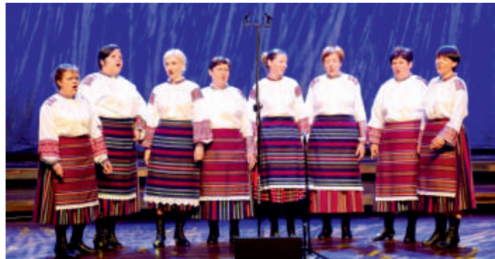
Sokotuchy w szczecińskiej filharmonii

To za jej przyczyną Sokotuchy uczestniczyły w festiwalach i prestiżowych konkursach, m.in. dwukrotnie w Festiwalu Kapel i Śpiewaków Ludowych, gdzie zdaniem etnologów uchodziły za nowe odkrycie i muzyczną rewelację południowego Podlasia. Również dwukrotnie koncertowały z powodzeniem na Festiwalu Tradycji Ludowych Lubelszczyzny, Mazowsza i Podlasia "U zbiegu rzek"