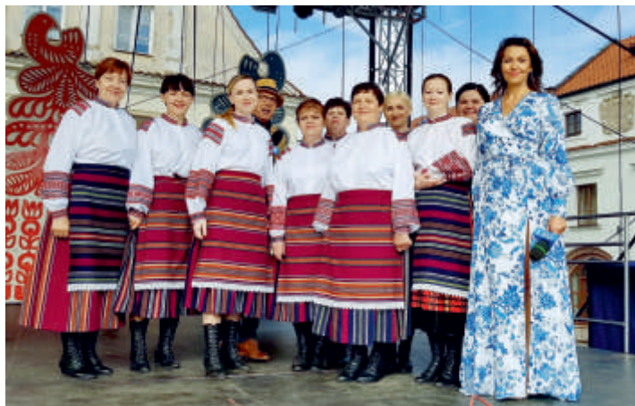
Sokotuchy w Kazimierzu

- Samo zakwalifikowanie się do turnieju, w którym startują najlepsi w kraju jest nie lada wyczynem. Zgłoszenia dźwiękowe wykonawców oceniają wybitni znawcy tematu. Nam udało się nie tylko wystartować w imprezie, ale też