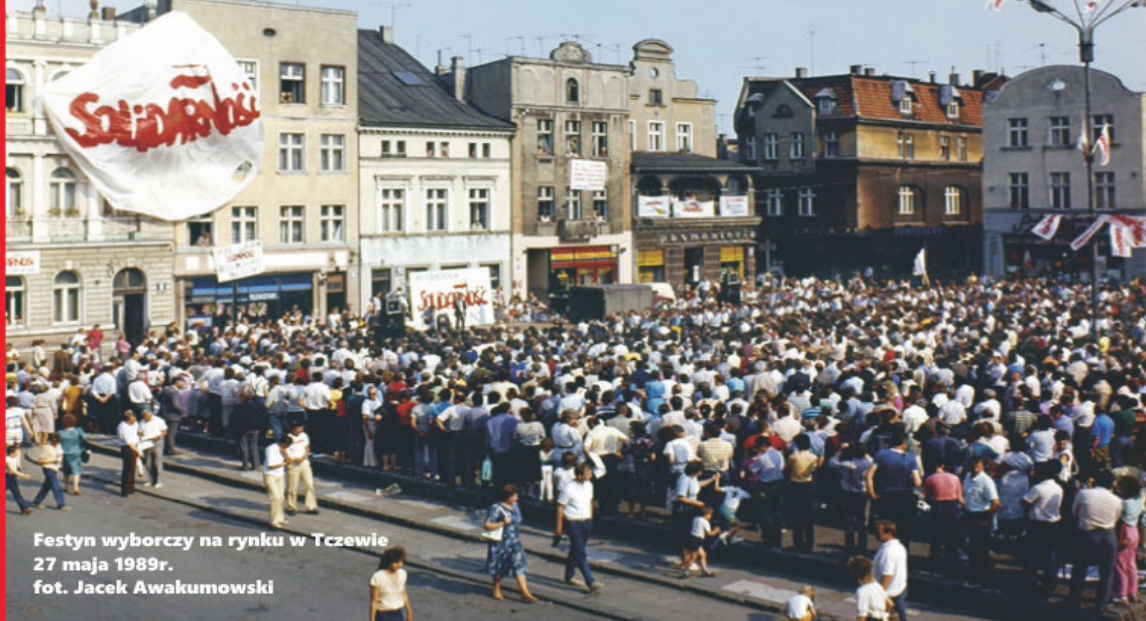
Festyn wyborczy na rynku w Tczewie 27 maja 1989r.