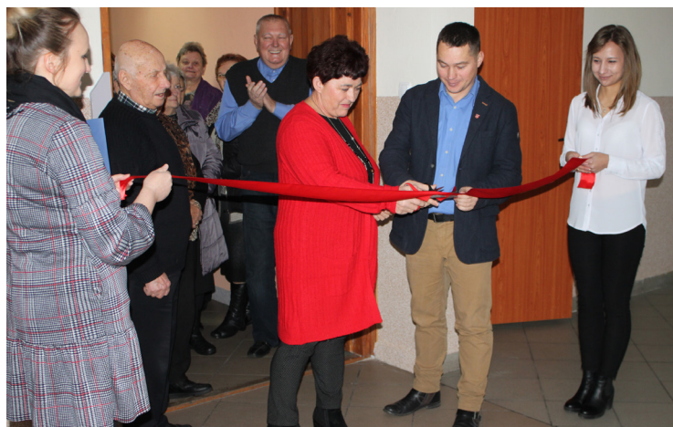
OKŁADKA: Otwarcie drogi w Krasewie