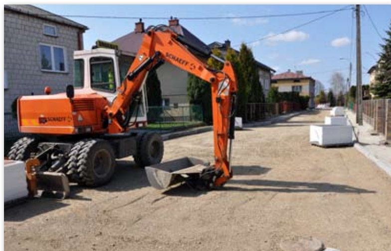
Prace na ul. Słonecznej