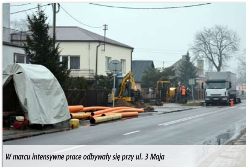
W marcu intensywne prace odbywały się przy ul. 3 Maja

Planowana jest dalsza rozbudowa sieci na terenie miasta. ZG zawarł