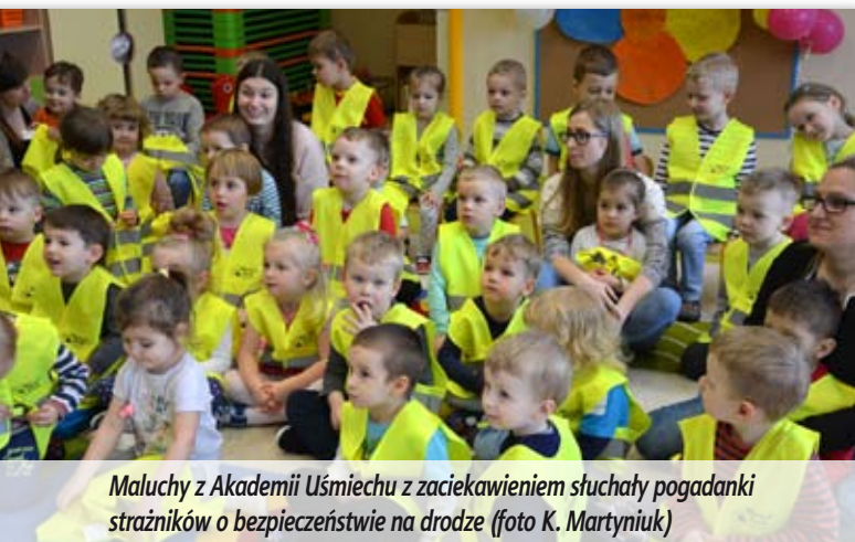
Maluchy z Akademii Uśmiechu z zaciekawieniem słuchały pogadanki strażników o bezpieczeństwie na drodze