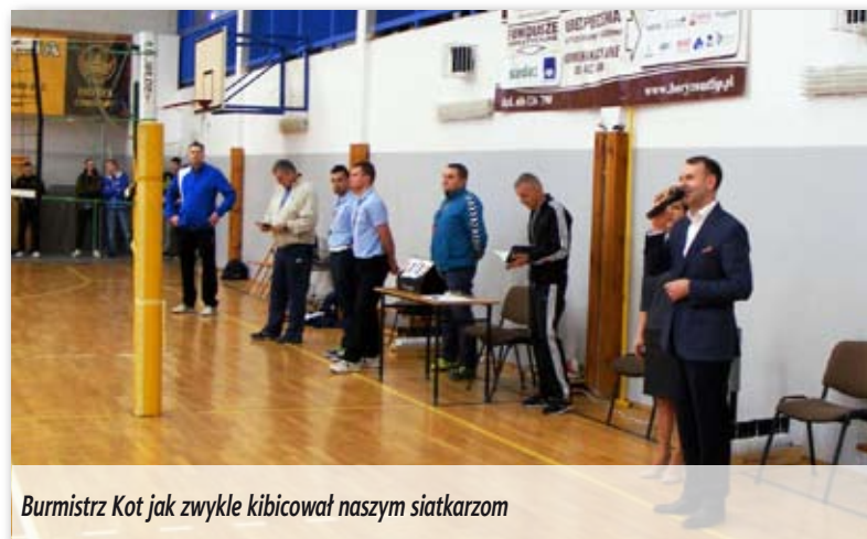
Burmistrz Kot jak zwykle kibicował naszym siatkarzom