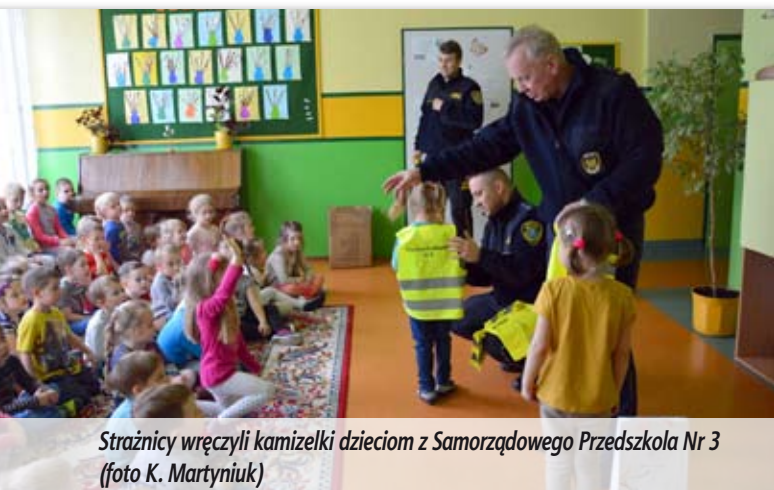
Strażnicy wręczyli kamizelki dzieciom z Samorządowego Przedszkola Nr 3