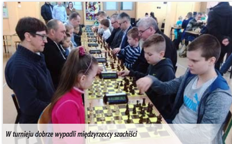
W turnieju dobrze wypadli międzyrzeccy szachiści

i Aleksandrą Marciniuk. W grupie chłopców do lat 8 trzecie miejsca zdobył Aleksander Nakaziuk z Gambitu. Kolejny turniej cyklu odbędzie się 30 kwietnia.