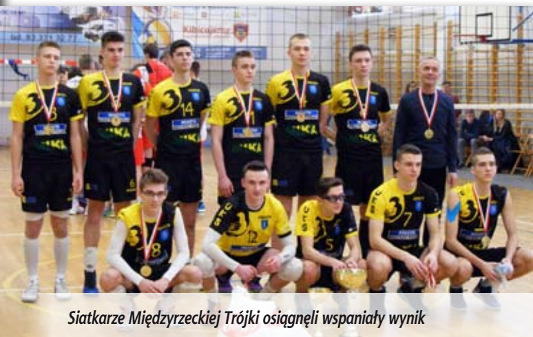
Siatkarze Międzyrzeckiej Trójki osiągnęli wspaniały wynik