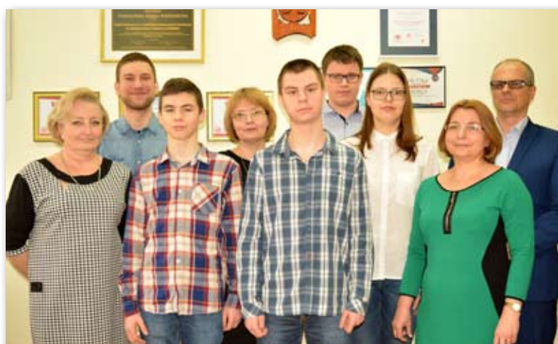
Laureaci konkursów z ZPO nr 2 wraz opiekunami