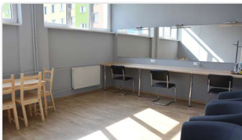
W garderobie wreszcie jest przytulnie

Niedawno zakończył się remont garderoby dla artystów w Miejskim Ośrodku Kultury. W pomieszczeniu postawiono ściankę działową, wyremontowano podłogi i zamontowano nowe oświetlenie. Ze ścian zniknęły wreszcie nieestetyczne płytki, a pojawiły się meble i lustra. W sąsiednim pomieszczeniu, po dawnej pracowni plastycznej w przyszłości ma powstać zaplecze sceniczne dla występujących zespołów. Ponadto odremontowano zniszczone dwie małe garderoby w podpiwniczeniu budynku. Na co dzień służą one kapeli i zespołowi Dzieci Podlasia. Dobiegł też końca generalny remont w dawnej kawiarni „Pasja”. Jest już nowa podłoga, podwieszany sufit i oświetlenie, a wkrótce pojawią się nowe meble. Będą się tu odbywały zajęcia plastyczne dla dzieci i dorosłych. Na remonty MOK wydał ponad 50 000 zł.