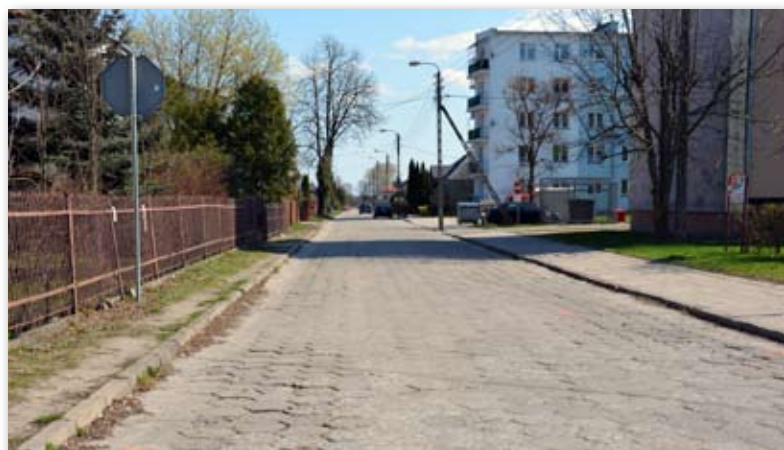
Niebawem na ul. Pułaskiego rozpocznie się budowa kanalizacji deszczowej

Mieszkańcy bloku przy ul. Jelnickiej 4 wkrótce będą mogli wydzierżawić nowe garaże o konstrukcji stalowej. Miasto zainwestowało w ich budowę 140 000 zł.