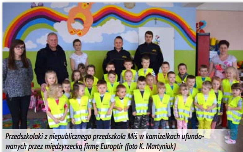
Przedшкоlaci z niepublicznego przedszkola Miś w kamizelkach ufundowanych przez międzyrzeczską firmę Europtir