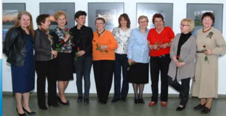
Autorki prac podczas wernisażu