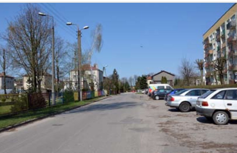
Na dniach ruszą prace na ul. Wita Stwosza