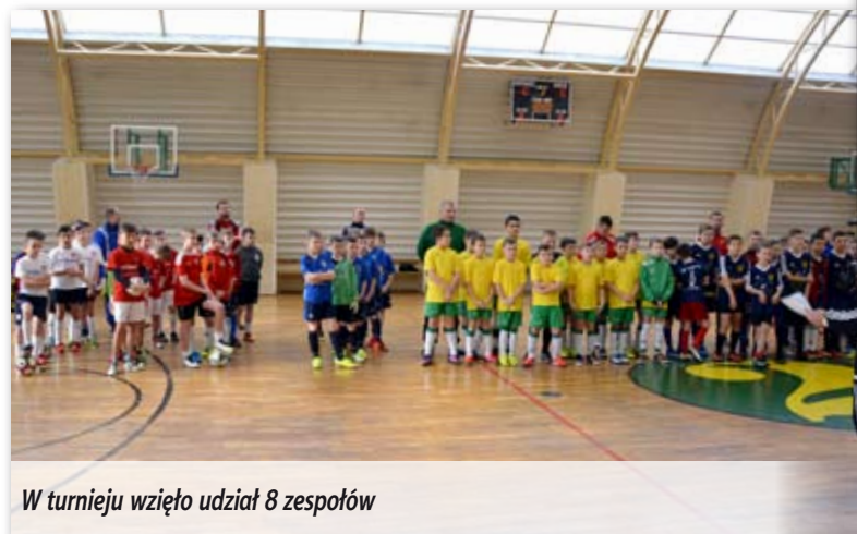
W turnieju wzięło udział 8 zespołów