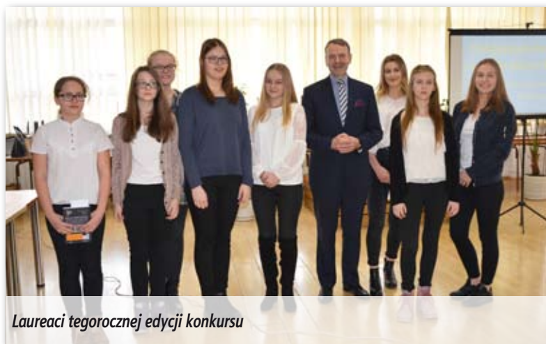
Laureaci tegorocznej edycji konkursu