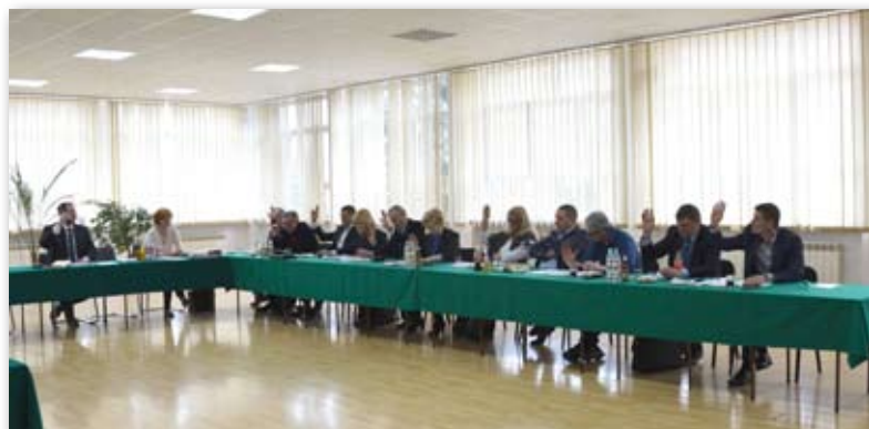
Radni przegłosowali uchwałę podczas sesji 30 marca

Projekty będą wybierane poprzez głosowanie. Miasto rozważa dwie opcje: elektroniczną i tradycyjną (papierową). Głosowanie nad budżetem odbędzie się jeszcze w tym roku, natomiast wybrane przedsięwzięcia zostaną zrealizowane w 2018 roku.