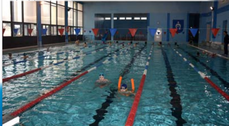
Nowe urządzenia pozwalają na szczegółowe badanie parametrów wody na pływalni

Urządzenia, na co dzień niewidoczne dla użytkowników pływalni, są sercem uzdatniania wody. Ich wymiana, w połączeniu z planowanymi w niedalekiej przyszłości remontami obiektu z pewnością przyczyni się do poprawy warunków międzyrzeckiej pływalni