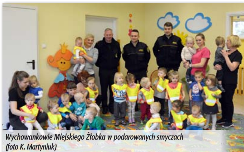
Wychowankowie Miejskiego Żłobka w podarowanych smyczkach