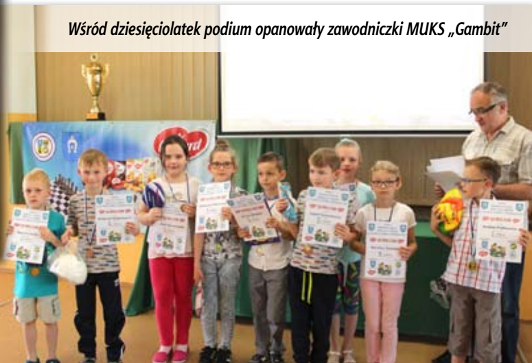
Wśród dziesięciolatek podium opanowały zawodniczki MUKS „Gambit”