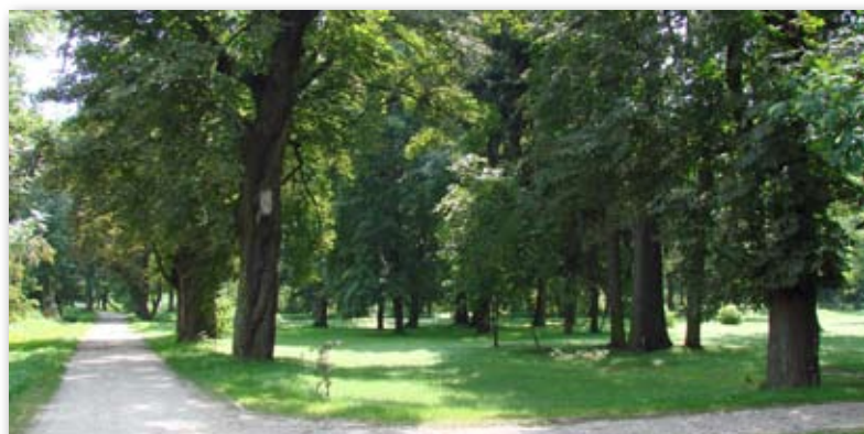
Efekte prac rewitalizacyjnych w parku zobaczymy już w przyszłym roku

Wszystko będzie zrobione z wykorzystaniem istniejącej zieleni, która zostanie uporządkowana, ale pojawią się też zupełnie nowe, ciekawe aranżacje kwiatowe i krzewy (ponad 5000 nasadzeń).