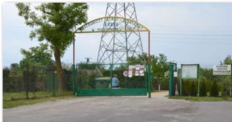
Na terenie „Krzna” niebawem zostanie zamontowany monitoring

Dotacja mogła być udzielona w wysokości 70 proc. poniesionych nakładów, w kwocie nie wyższej niż 10 000 zł.