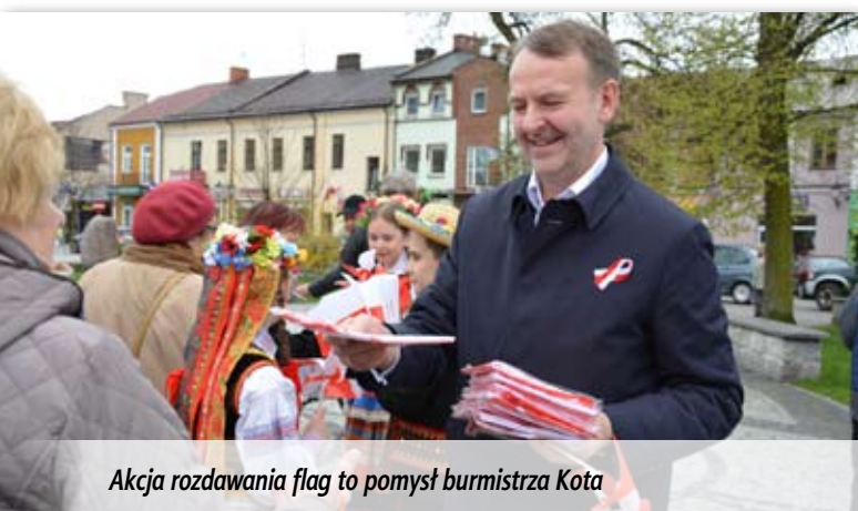
Akcja rozdawania flag to pomysł burmistrza Kota