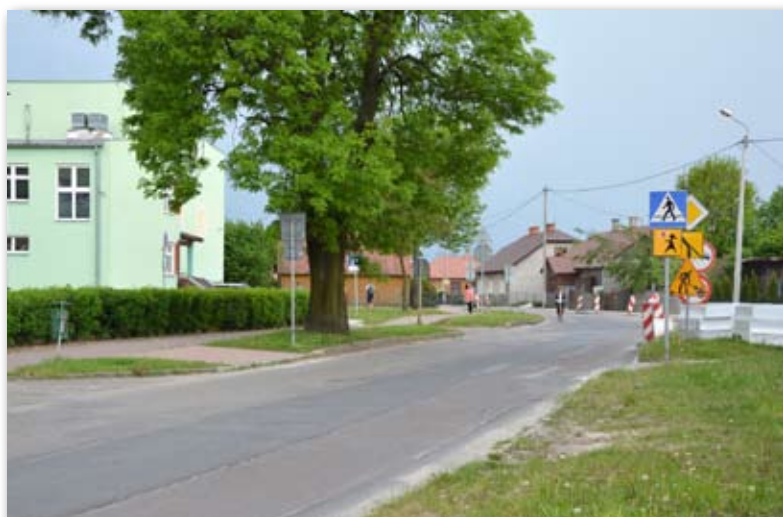
Dzięki inwestycji dzieci będą mogły poruszać się bezpiecznie

Projekt pn. „Poprawa warunków bezpieczeństwa w obrębie przejścia dla pieszych w ul. Leśnej w Międzyrzeczu Podlaskim” warty jest 50 000 zł. W ramach zadania przy Zespole Placówek Oświatowych nr 3 zainstalowany zostanie aktywny znak ostrzegawczy, pojawi się także nowa „zebra”, wykonana ze specjalnej masy.