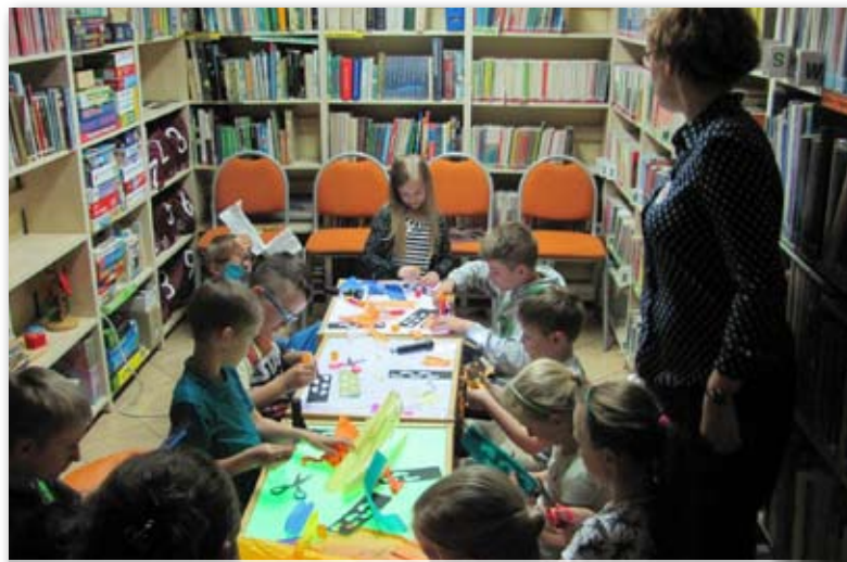
Dzieciom podobało się wieczorne myszowanie po bibliotece

o Afryce i jej mieszkańcach. Na zakończenie spotkania dzieci wykonały podróżnicze zakładki – witraże.