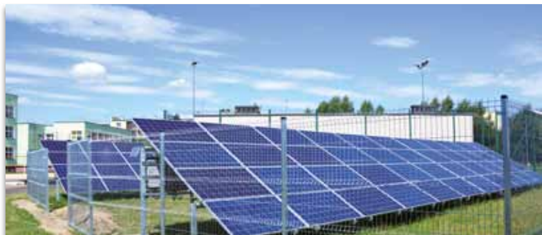
Dzięki instalacjom fotowoltaicznym utrzymanie basenu będzie tańsze

Pozyskane dofinansowanie z Regionalnego Programu Operacyjnego Województwa Lubelskiego na głęboką termomodernizację pływalni Oceanik, wpłynie w przyszłości na mniejsze koszty jej utrzymania. Zakończono kolejny etap prac związany z montażem energooszczędnego oświetlenia ledowego oraz instalacją paneli fotowoltaicznych, dzięki którym energia słoneczna będzie wykorzystywana do bieżącego funkcjonowania basenu. Niebawem rozpocznie się montaż instalacji solarnych i pomp ciepła, wymiana drzwi i okien oraz remont dachu. Prace będą kosztowały 2,2 mln zł, z czego pozyskane środki to 1,5 mln zł.