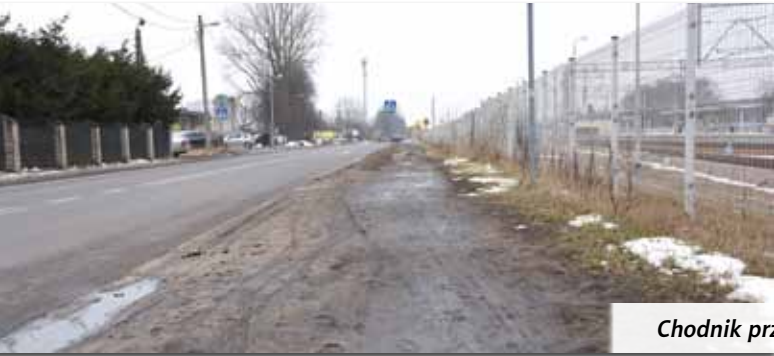
Chodnik przy ul. Kolejowej