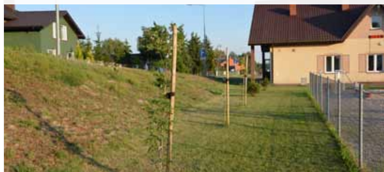
Nowe drzewka na Międzyrzeczskich Jeziorkach

i tulipanowiec amerykański. Wśród krzewów mieszkańcy zobaczą m.in.: berberys i irgę błyszczącą. Sadzonki roślin trafiły też do mieszkańców. W ramach ubiegłorocznej akcji zbiórki zużytego sprzętu elektrycznego i elektronicznego przekazano ponad 130 sadzonek drzew i krzewów.