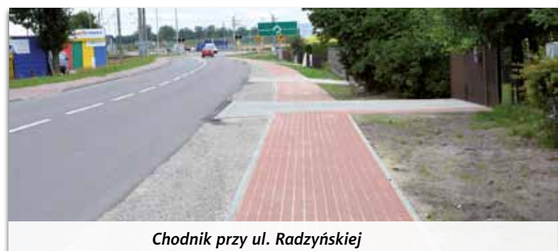
Chodnik przy ul. Radzyńskiej