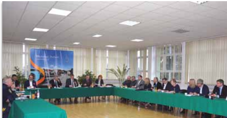
Podczas czerwcowej sesji radni udzieli burmistrzowi absolutorium za wykonanie budżetu w 2017 roku