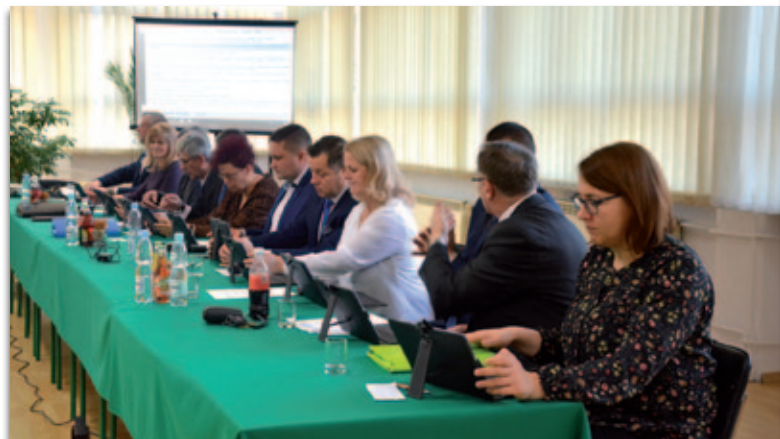
Dzięki zmianom obrady będą przebiegały o wiele sprawniej

W sali konferencyjnej, gdzie zwykle obradują radni została zamontowana kamera, dzięki temu każdy może zobaczyć jak pracują. Wystarczy wejść na kanał urzędu miasta na YouTube. To nie koniec nowości. Radni otrzymali też tablety z dostępem do Internetu, za pomocą których głosują elektronicznie i przeglądają materiały na sesję. Nagrania z obrad są dostępne w Biuletynie Informacji Publicznej i na stronie internetowej urzędu miasta.