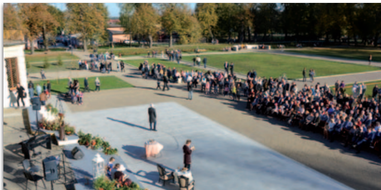
Park po rewitalizacji to obecnie najchętniej odwiedzane miejsce

Oficjalne otwarcie parku po rewitalizacji odbyło się 14 października. Wzię-