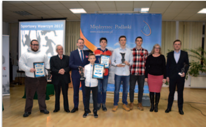
W lutym podczas uroczystej gali uhonorowano sportowców za sukcesy odniesione w 2017 r.

Szczegółowe informacje i formularz dostępny jest na stronie internetowej miasta : www.miedzyczec.pl .