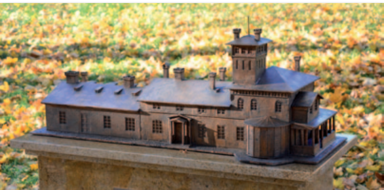
Makieta spalonego w 1918 r. pałacu Potockich jest jedną z nowych atrakcji w parku