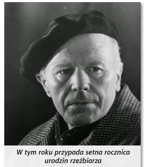
W tym roku przypada setna rocznica urodzin rzeźbiarza