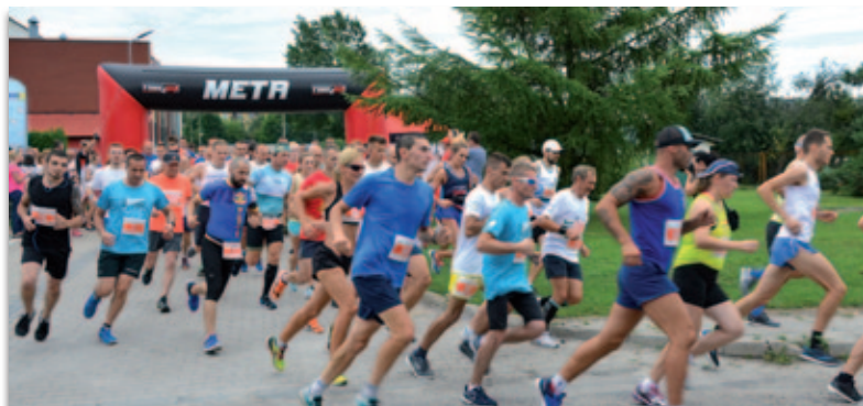
Tym razem uliczna dycha będzie jednym z etapów traktu brzeskiego. Organizatorzy spodziewają się większej liczby uczestników

Grand Prix to sześć miesięcy wspólnej biegowej zabawy. To nie tylko rywalizacja o lokatę w końcowej klasyfikacji i miejsce na podium, ale przede wszystkim okazja do sprawdzenia się w skrajnie