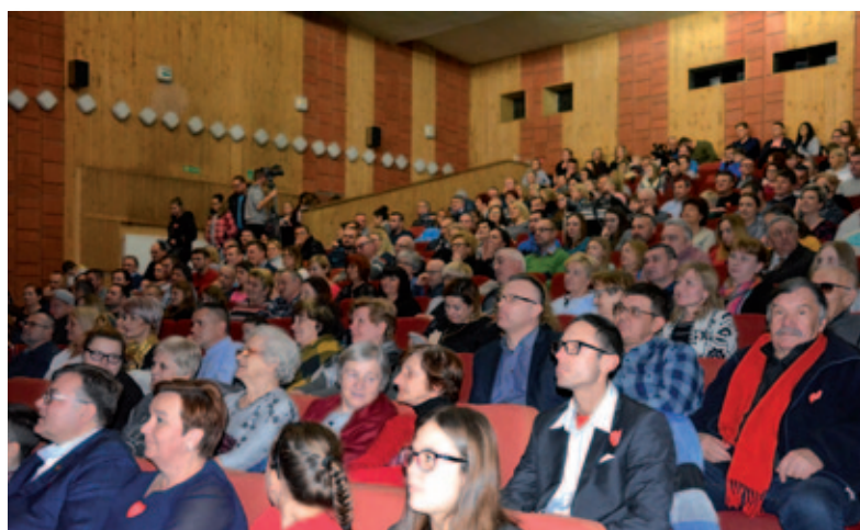
Międzyrzeczanie jak co roku chętnie wsparli WOŚP

Tego dnia rankiem Międzyrzeczka Grupa Biegowa zorganizowała wspólne morsowanie na placu Jana Pawła II. Warunkiem wejścia do basenu z lodowatą wodą był datek do puszek na rzecz WOŚP. Dla Orkiestry zagrały również międzyrzeczkie szkoły. 11 stycznia w ZPO nr 2 rozegrano mecz