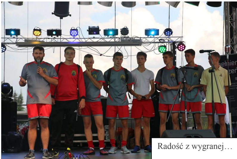
Radość z wygranej...