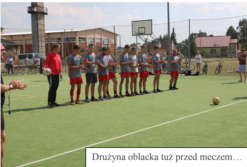
Drużyna oblacka tuż przed meczem...

Podczas Dni Kodnia oraz w ramach zakończenia “Wakacji z Piłką Nożną im. Józefa Tymoszuka”, oblaci rozegrali mecz z pracownikami gminy Kodeń. Spotkanie zakończyło się wynikiem 7:2 dla oblatów. To już trzecie tego typu spotkanie i trzecia wygrana zakonników. Drużynę Misjonarzy Oblatów Maryi