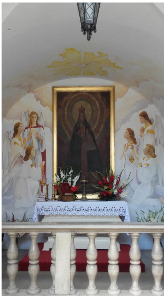
Ołtarz MBK w Wieczerniku na Jasnej Górze