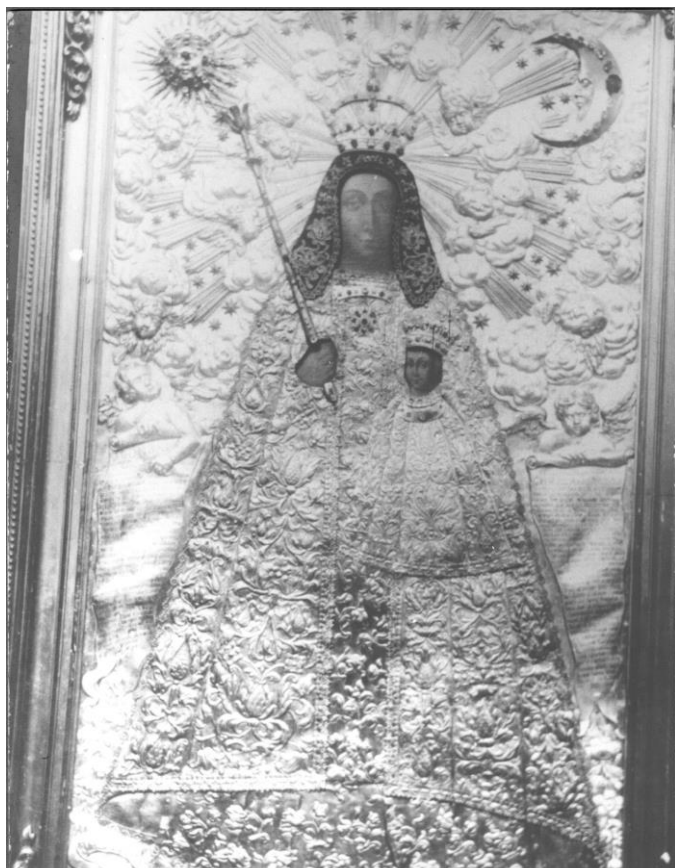
KODEŃSKA PANI W SREBRNEJ SUKIENCIE I WELONIE (1927)