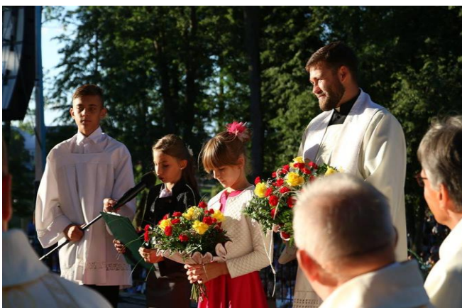
Dzieci z naszej parafii witają Księdza Arcybiskupa