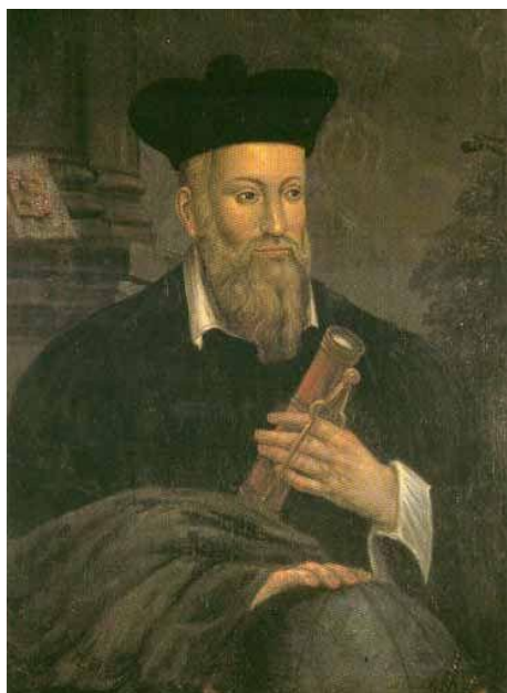
1 – Michael de Nostre Dame

Historia iluzji rozpoczyna się już przed naszą erą. Jak podają źródła historyczne, jej ojcem był najprawdopodobniej Egipcjanin – Dedi. Około 2700 p.n.e. zaprezentował swoje możliwości w obecności Faraona Cheopsa. Dedi uciął głowę gęsi, po czym wypuścił ją po to, by mogła jak gdyby nigdy nic biegać po pomieszczeniu królewskim. Na koniec, w niewyjaśniony wówczas sposób, złączył z powrotem uciętą głowę gęsi z resztą jej ciała, po czym ta zaczęła gęgać. Taki sam pokaz powtórzył z pelikanem i wołem. Nie zgodził się jednak, mimo próśb faraona, by zademonstrować to samo z człowiekiem. Iluzją posługiwali się również starożytni kapłani, głównie egipscy, babilońscy i Chaldejscy. Dzięki nabytej wiedzy z dziedziny matematyki, fizyki, chemii i astronomii skonstruowali całą masę urządzeń, które nadawały magiczny charakter religijnym ceremoniom. Przy blasku księżyca drzwi do świątyni same się otwierały, a w ogromnych pustych salach rozlegały się tajemnicze głosy przepowiadające przyszłość.