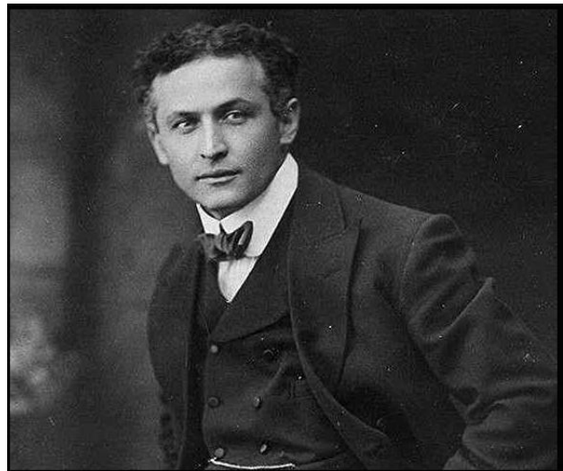
2 – Eugene Robert-Houdin

Iluzja, jaką znamy dziś, rozwinęła się dopiero około XIX w. Przełomem stała się działalność Jeana Eugène Roberta-Houdina, który wprowadził urządzenia mechaniczne, a także rozwinął triki wspomagające sprawną oraz płynną manipulację dłońmi i przedmiotami. Jean urodził się w 1805 r. we Francji. Swoją karierę rozpoczął jako zegarmistrz i dopiero później zaczął