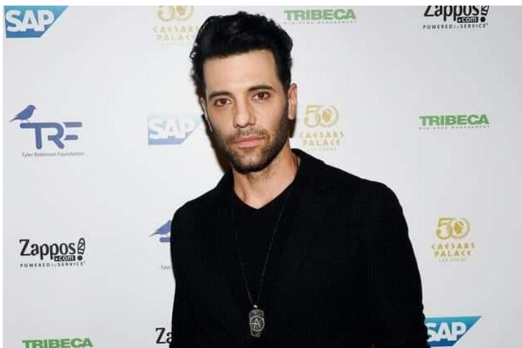
Criss Angel (ur. 19.12.1967)

Pochodzący z Grecji Christopher N. Sarantakos oprócz tego, że jest jednym z najbardziej znanych iluzjonistów, interesuje się również muzyką. Na rzecz iluzji zrezygnował z edukacji, aby całym sercem poświęcić się swojej pasji. W wieku 12 lat miał swój pierwszy występ