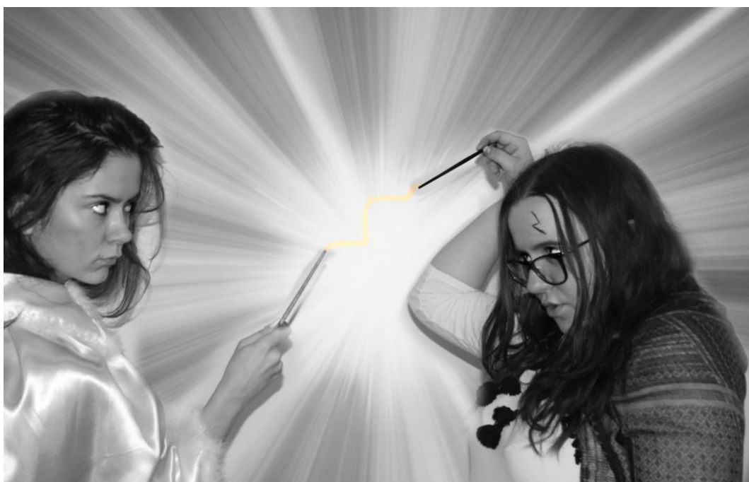
4 - Walka Harrego Pottera z Lordem Voldemortem (wersja żeńska, mamy XXI wiek i równouprawnienie).

DATA: 28.01.2019, czarno-białe. Lordowi Voldemortowi odróśł nos.