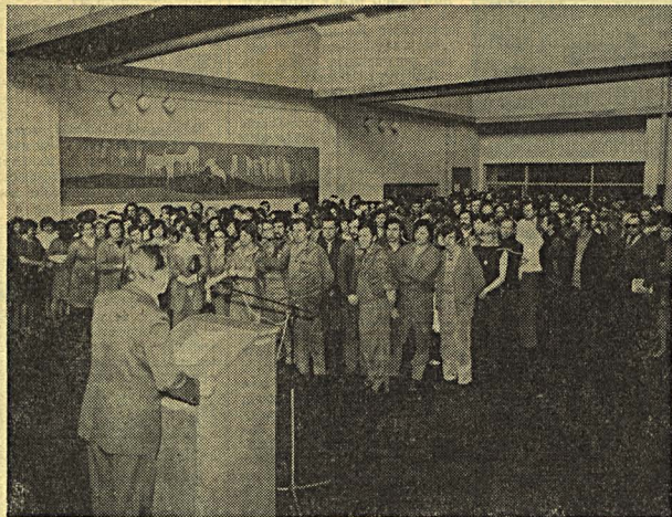
Wiec protestacyjny w ZPW „Biawena”.