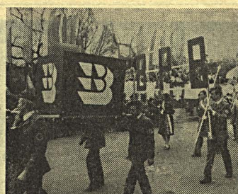
Idzie załoga bialskiej „mieszkańówki”.