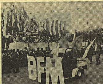
Manifestuje załoga BFM.