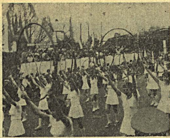
Przed trybuną honorową — młodzież szkolna.