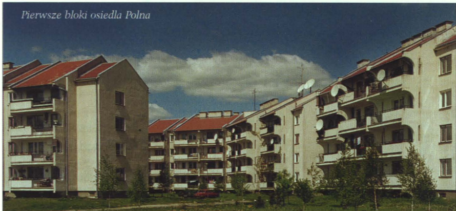
Pierwsze bloki osiedla Polna

1989 r. – rozpoczęcie budowy nowego osiedla spółdzielczego przy ul. Polnej. Pierwszy 24-rodzinny budynek przekazano lokatorom w 1989 r.