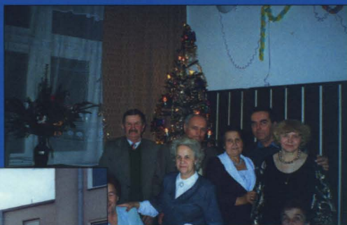
Przy Osiedlowym Domu Kultury aktywnie działa Klub Seniora.