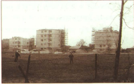
Budowa pierwszych spółdzielczych domów.

listopad 1961 r. – po zarejestrowaniu Spółdzielni w sądzie rozpoczęto budowę dwóch pierwszych bloków mieszkalnych po 20 mieszkań każdy.