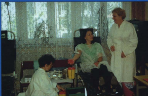
W budynku przy ul. 11-go Listopada 62 funkcjonuje mini-centrum medyczne. Jedną z form jego działalności jest honorowe krwiodawstwo.