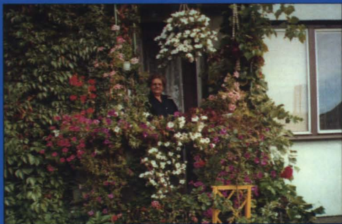
Jeden z najpiękniejszych balkonów w osiedlu.