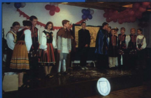
Sala widowiskowa ODK służy mieszkańcom całego miasta – odbywają się w niej roliczne koncerty, przeglądy, widowiska, konkursy itp.