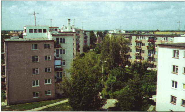
Kolejne bloki wzniesiono przy ul. 22 Lipca (obecnie ul. Sportowa i J. Pawła II)

grudzień 1975 r. – Spółdzielnia miała 730 członków, w tym 240 zamieszkujących i 590 oczekujących.