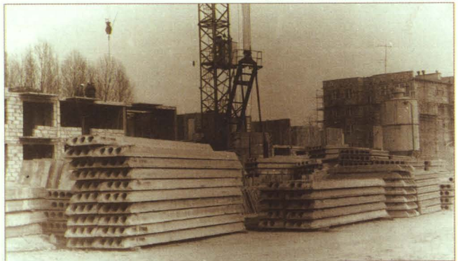
W latach 70-ych bloki mieszkalne budowano z tzw. wielkiej płyty.

15.10.1969 r. – rozpoczęto zasiedlanie 20-rodzinnego budynku przy ul. 22 Lipca 3 (ob. Al. Jana Pawła II) zbudowanego wraz z kotłownią – był to pierwszy blok spółdzielczy w Parczewie z centralnym ogrzewaniem.