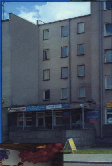
Siedziba władz Spółdzielni oraz Osiedlowego Domu Kultury – budynek przy ul. 11-go Listopada 62