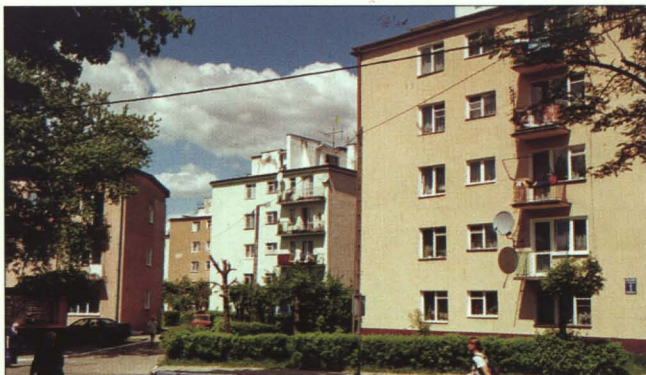
Najstarsze spółdzielcze domy zbudowano przy ul. Młynarskiej (obecnie ul. Spółdzielcza)