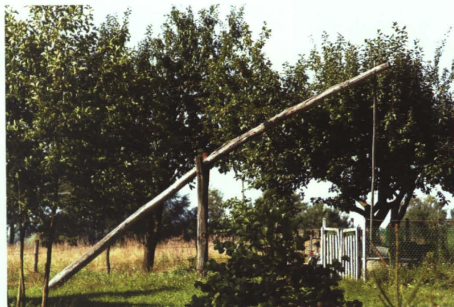
Dawniej w użyciu były takie „żurawie”

Z wodociągów korzysta w woj. lubelskim 68,6 proc. mieszkańców wsi. W gminie Terespol – 96,5 proc. mieszkańców.