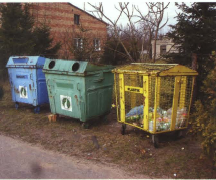
Pojemniki do segregacji odpadów

Od 2004 roku rozpoczęto w gminie Terespol selektywną zbiórkę odpadów.