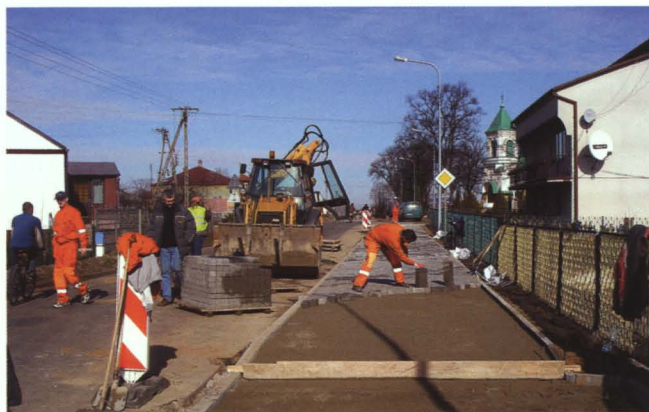
Układanie chodnika wzdłuż ulicy Słonecznej w Kobylanach