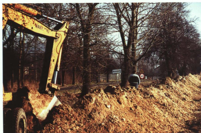
Budowa sieci wodociągowej w Bohukałach