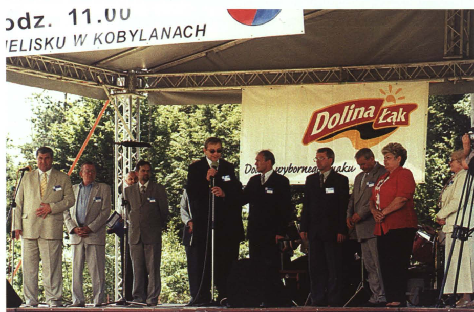
Po raz pierwszy przegląd „Kultura bez granic” zorganizowano 4 lipca 2004 roku, z okazji odnowienia polsko-białoruskiej współpracy samorządowej

Dumni jesteśmy, że do kalendarza imprez kulturalnych na ziemi bialskiej wszedł na stałe przegląd „Kultura bez granic”, organizowany co roku w miesiącu lipcu. Rozpoczęto obchody gminne świąt państwowych, takich jak rocznica uchwalenia Konstytucji 3 Maja czy też święto Niepodległości 11 Listopada. Przy GOK funkcjonują zespoły artystyczne: „Obertas”, „Małe liski”, grupy wokalne, koła teatralne itd. Pojawiły się liczne inicjatywy szkoleniowe, konferencyjne, wystawieni- niczne, rozpoczęto naukę tańca ludowego, break dance, przystąpiono do organizacji festynów rodzinnych, konkursów dla dzieci i młodzieży, itp.