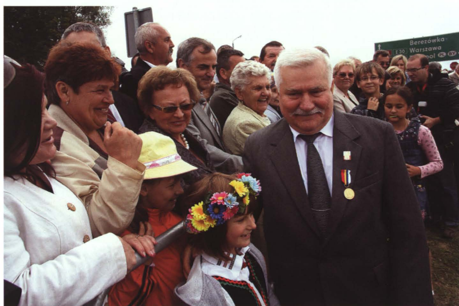
W sierpniu 2009 roku gościem dożynek w Kobylanach był prezydent Lech Wałęsa