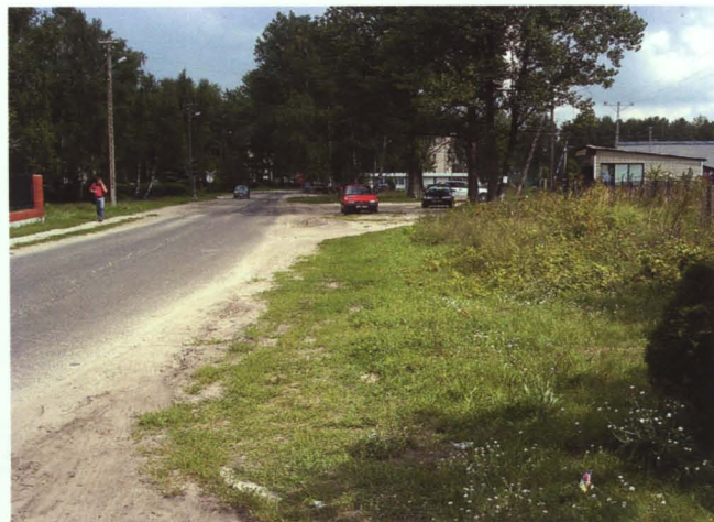
Ul. Kolejarzy w Małaszewiczach będzie odnowiona w latach 2010-2011