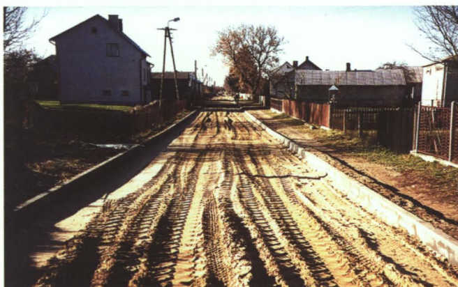
Budowa drogi do Krzyczewa

Te najbardziej kosztowne inwestycje wsparły środki z UE, pozyskiwane przez gminę Terespol zarówno w okresie przedakcesyjnym, jak i po wstąpieniu Polski do Unii Europejskiej oraz z budżetu państwa – łącznie gmina uzyskała około 25 mln zł na 12 projektów drogowych.