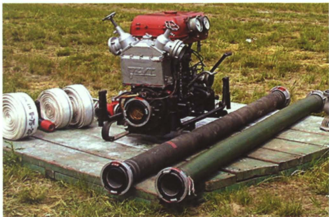
Przed 20 laty podstawowym sprzętem OSP były motopompy

Systematycznie wyposażano jednostki OSP w nowy sprzęt. W efekcie strażacy mają dziś do dyspozycji: jeden ciężki wóz bojowy marki „Kamaz”, 3 średnie samochody gaśnicze, jeden samochód lekki marki „Lublin” oraz samochód terenowy marki „Toyota”. W 2010 roku, dzięki funduszom europejskim, strażacy gminy Terespol wzbogacą się o 2 nowoczesne terenowe samochody gaśnicze: jeden otrzyma Jednostka Ratowniczo-Gaśnicza w Małaszewiczach, drugi OSP Neple. Gmina wyposażała OSP także w 3 łodzie ratownicze z napędem motorowym, agregaty prądotwórcze, pompy szlamowe, maszty oświetleniowe, węże strażackie itp.