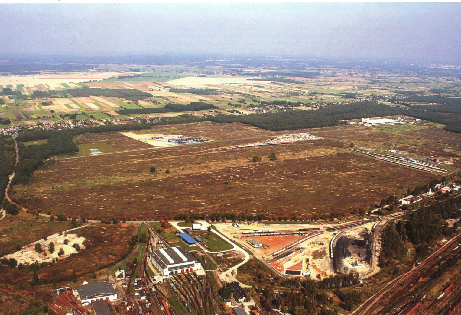
Teren Wolnego Obszaru Celnego

24 marca 1993 roku Rada Ministrów RP utworzyła WOC w Małaszewiczach, obejmujący teren o powierzchni 166 ha, położony pomiędzy drogą krajową nr 2 a suchym portem PKP w Małaszewiczach. Jednocześnie Rada Ministrów podjęła decyzję, iż zarządzającym WOC jest Gmina Terespol. Było to bezprecedensowe rozwiązanie w skali kraju.