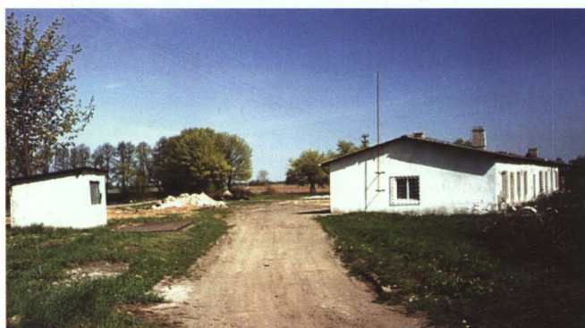
Siedziba Gospodarstwa Pomocniczego UG

W 1998 roku na bazie GP zUG władze gminy stworzyły spółkę komunalną „Eko-Bug”. Spółka: eksploatuje gminne ujęcie wody w Koroszczynie, konserwuje i utrzymuje sieć wodociągową, buduje wodociągi oraz przyłącza wodociągowe i kanalizacyjne; eksploatuje oczyszczalnię ścieków i sieci kanalizacyjne; organizuje gospodarowanie odpadami stałymi – odbiera odpady z 220 koszy ulicznych oraz 122 dużych kontenerów 1100-litrowych, a także od 1300 gospodarstw domowych, eksploatuje gminne składowisko odpadów. Ponadto sprzedaje i przewozi kruszywa naturalne z kopalni w Lebiedziewie (uruchomiono ją w 1996 roku) i Małaszewiczach Małych; pielęgnuje tereny zielone; obsługuje oczyszczalnie ekologiczne (zagrodowe), zajmuje się też zimowym i letnim utrzymaniem dróg i poboczy. Wykonuje również inne usługi dla mieszkańców.