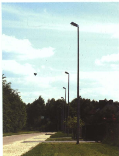
Oświetlenie uliczne w Małaszewiczach