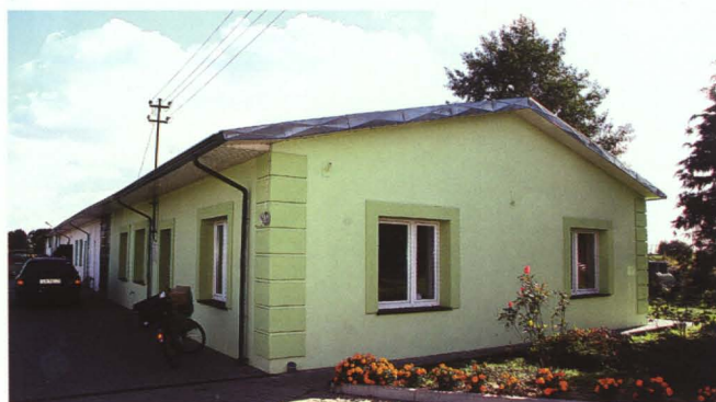
A tak prezentuje się siedziba spółki „Eko-Bug”