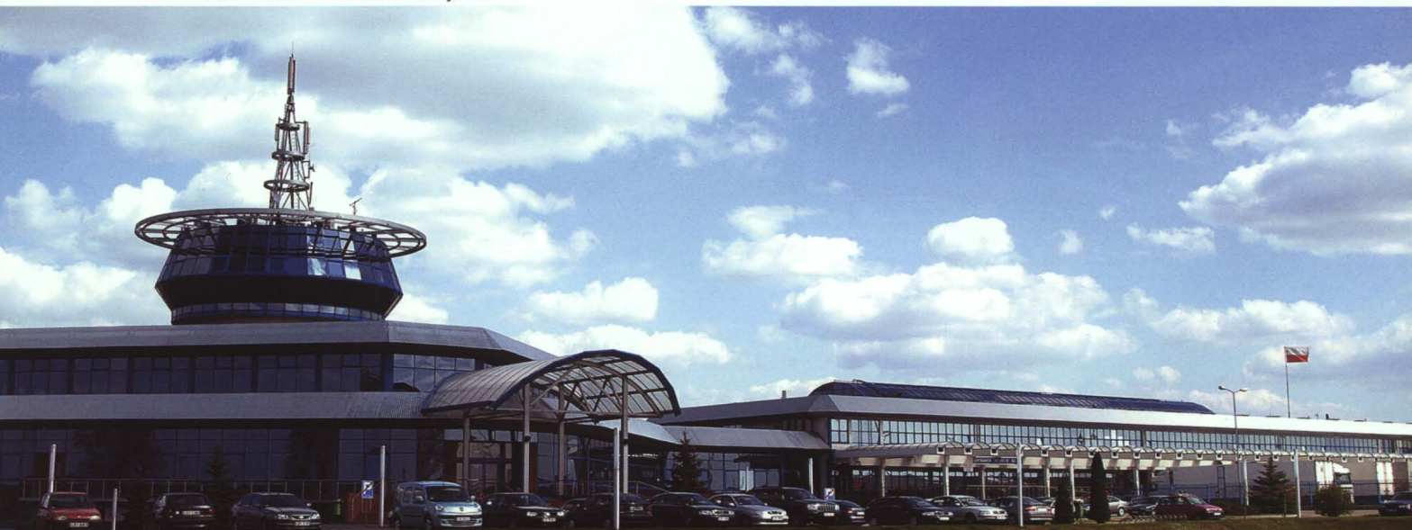
Panorama Terminalu w Koroszczyń