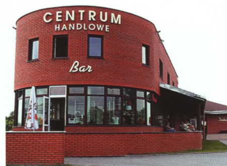
Centrum Handlowe Agrostop na przejściu granicznym w Terespolu

Kilka firm prywatnych zainwestowało też na terenie gminy w branżę usługową: „Sezam” w Małaszewiczach Dużych – hotel „Feniks”, „Agrostop” – motel „Pod Dębami” w Kobylanach i Centrum Handlowe na przejściu drogowym w Terespolu.