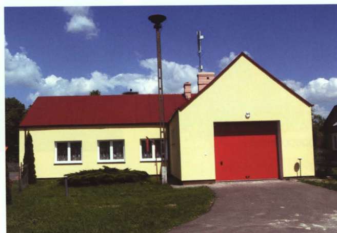
Świetlica w Łęgach przed i po remoncie