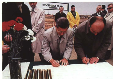
Podpisanie aktu erekcyjnego

Trzy decyzje Rady Ministrów dotyczące gminy Terespol: – decyzja trzecia z 1996 roku – budowa Terminalu Samochodowego Odpraw Granicznych w Koroszczyń