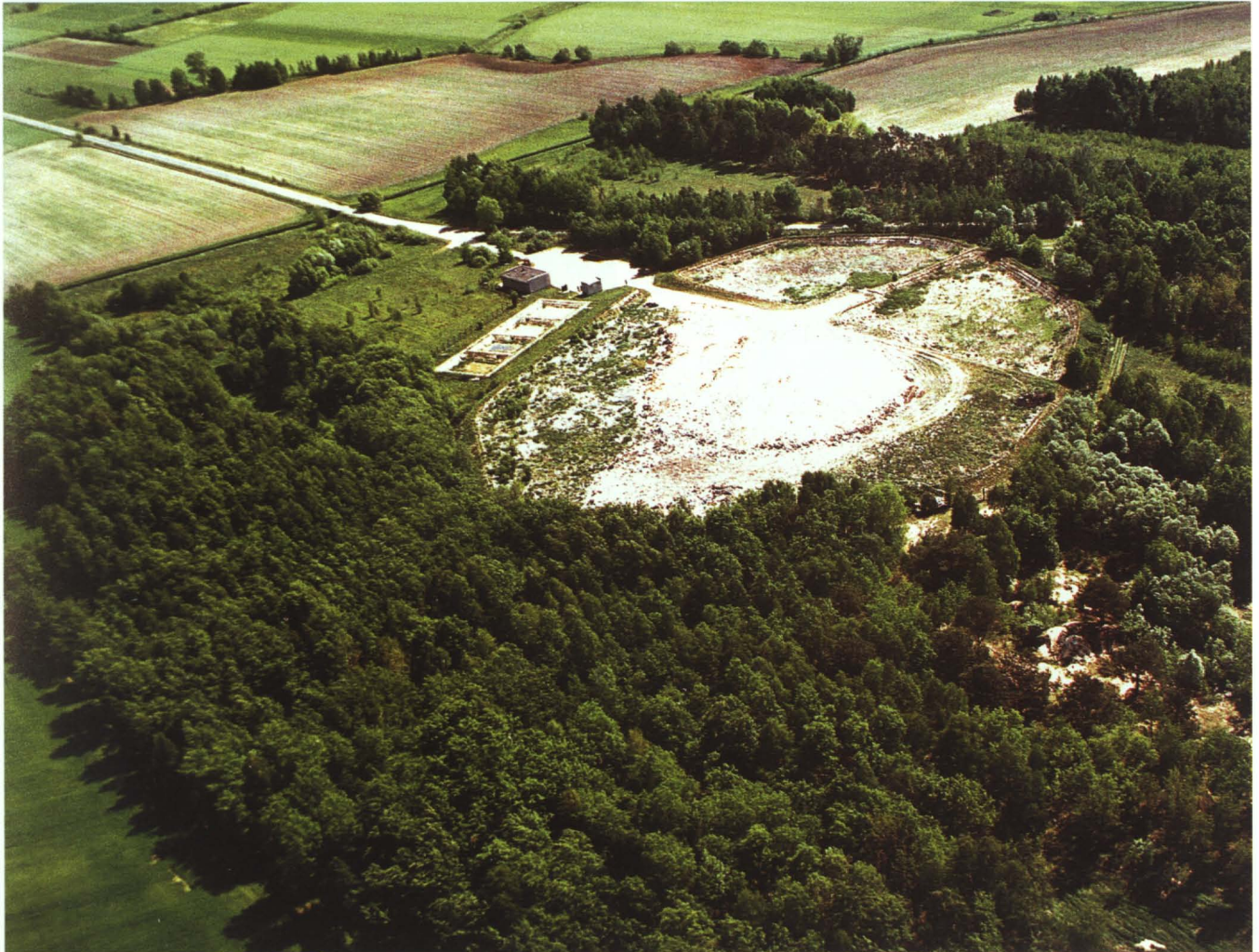
Wysypisko w Lebedziewie