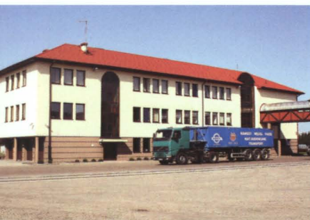
Terminal Odpraw Weterynaryjnych i Fitosanitarnych w Kobylanach

W 1990 roku na terenie gminy funkcjonowały następujące firmy: Dyrekcja Rejonów Przeladunkowych PKP w Małaszewiczach, Baza CPN w Małaszewiczach, C.Hartwig Spedycja oraz Gminna Spółdzielnia „SCh” w Terespole.