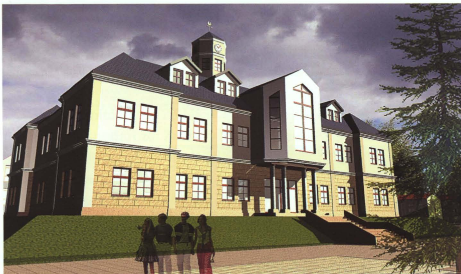
Wizualizacja nowego centrum gminy Terespol: budynek Urzędu Gminy oraz plac centralny z widoczną zabudową usługowo-mieszkaniową