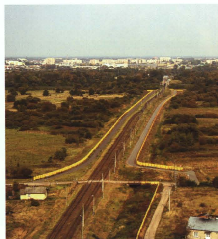
Kolejowe przejście graniczne Terespol-Brześć