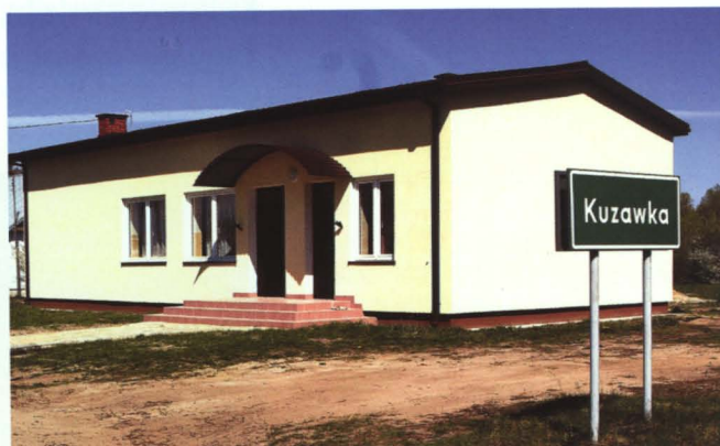
Świetlica w Kuzawce przed i po remoncie