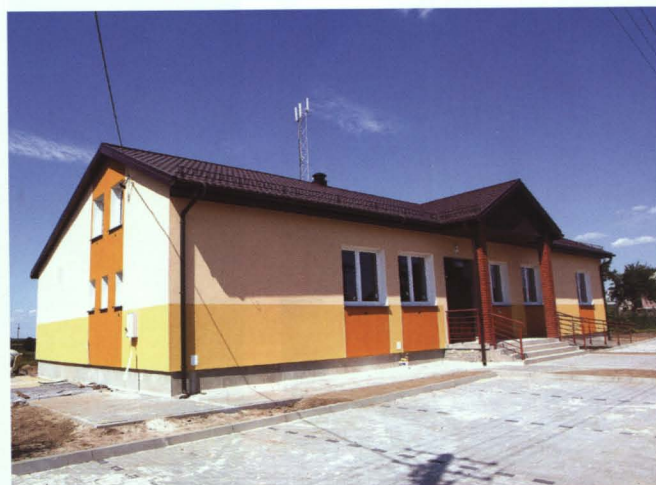
Świetlica w Małaszewiczach Dużych przed i po remoncie