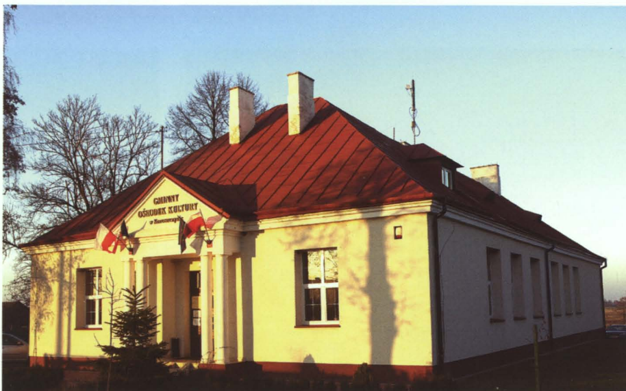
Gminny Ośrodek Kultury w Koroszczynie rozpoczął działalność w listopadzie 2005 roku