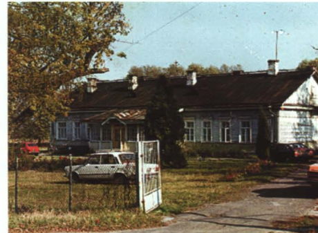
Tak wyglądała „carska” szkoła w Kobylanach

Infrastruktura społeczna (oświata, kultura, OSP, sport i rekreacja) po dwudziestu latach