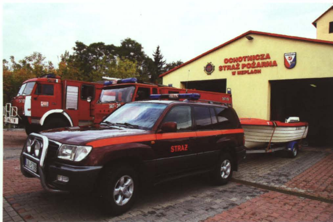
Dzisiejsze wyposażenie OSP w Neplach