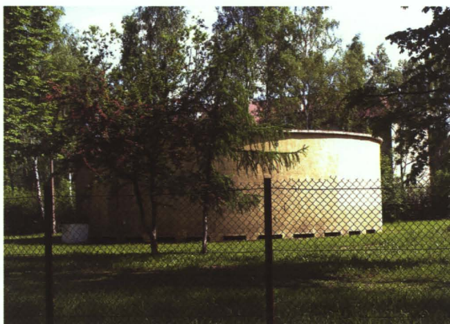
Stara oczyszczalnia ścieków w Małaszewiczach

W województwie lubelskim zaledwie 12 proc. mieszkańców wsi korzysta z infrastruktury kanalizacyjnej. W kraju – 22,6 proc. Na tym tle osiągnięcia gminy Terespol są imponujące.