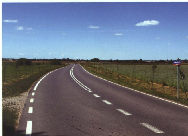
Nowa droga Kobylany–Lebiedziew