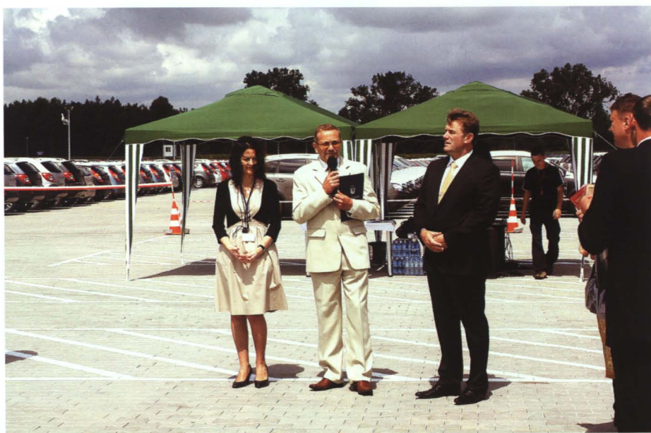
Otwarcie terminalu Adampol na terenie WOC Małaszewicze