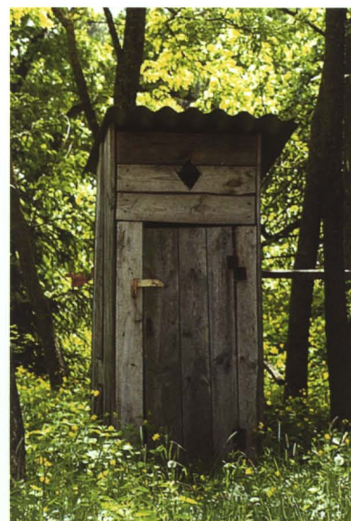
Przed kanalizacją gminy w powszechnym użyciu były „sławojki” A z takich toalet korzystają teraz uczniowie wszystkich szkół w gminie Terespol