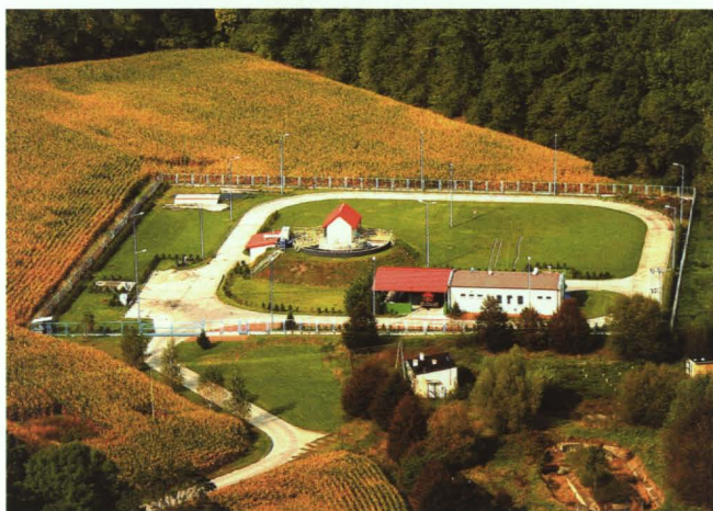
Gminna oczyszczalnia ścieków w Koroszczynie