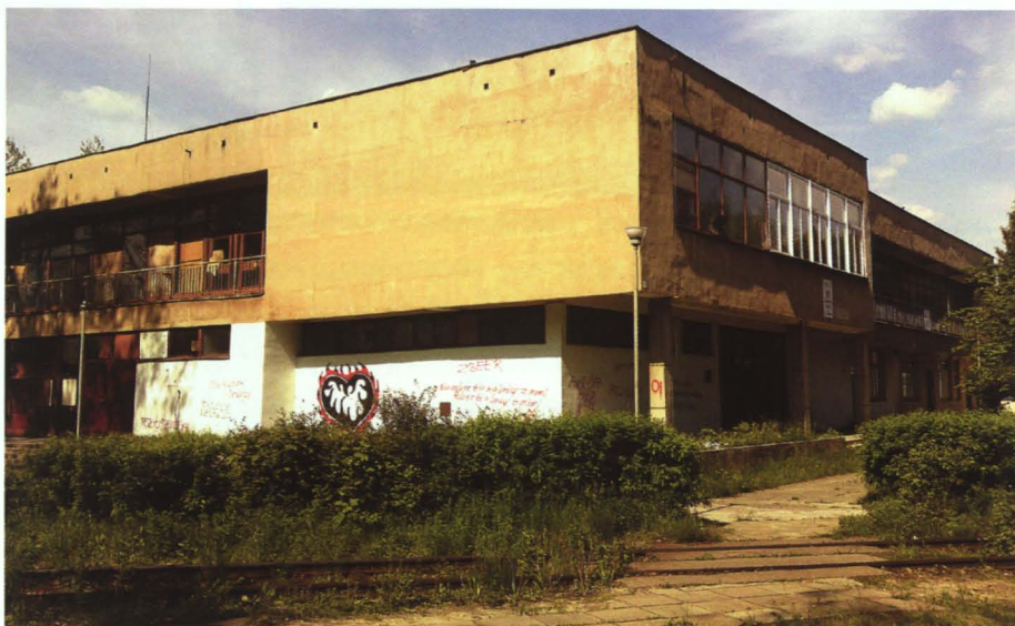
Dom Kultury Kolejarza jest dzisiaj bez gospodarza

W 2005 roku Rada Gminy powołała do życia Gminny Ośrodek Kultury z siedzibą w Koroszczynie oraz Gminną Bibliotekę Publiczną. Z tą chwilą oferta kulturalna gminy znacznie się rozszerzyła.