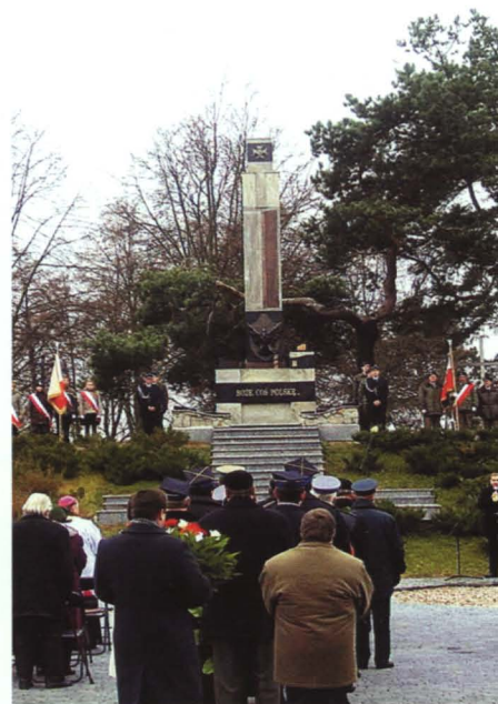
Pomnik Niepodległości i Nieznanego Żołnierza w Koroszczyne