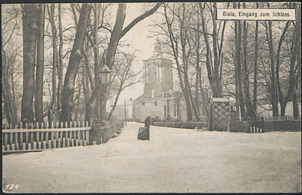
Biala, Eingang zum Schloss.