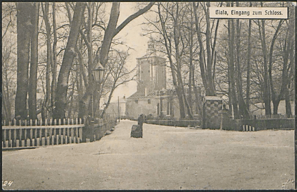
Biala, Eingang zum Schloss.