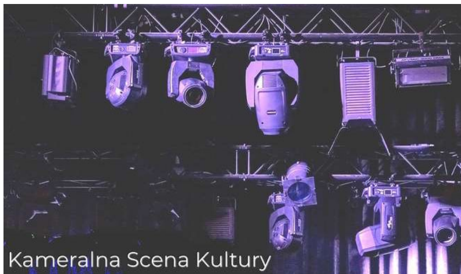
Kameralna Scena Kultury

Z niecierpliwością czekamy na pierwsze spektakle i spotkania na Kameralnej Scenie Kultury. Zapraszamy do Drelowa i śledzenia działań Gminnego Centrum Kultury na portalu Facebook. Oby 2021 rok przyniósł możliwość pełnego wykorzystania lokalnego potencjału!